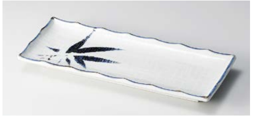
ヤ122-187 古染布目笹尺突出皿 26.5×10.7cm(40入・磁)