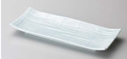
口122-127 青磁スタレ 長角9.0皿 27.8×11.5×3cm(30入・磁)