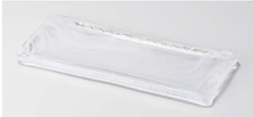
ハ122-017 水墨長角皿小白(ガラス) 24×10×1.1cm(32入)(ガラス)