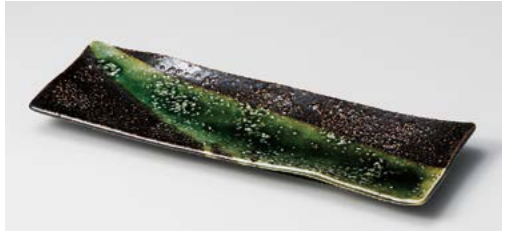
タ122-217 天の川華突出皿 28.5×9.5×2.3cm(20入・陶)