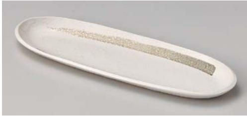
オ122-177 粉引刷毛目フェスタ皿(大) 34.5×11.2cm(30入・磁)