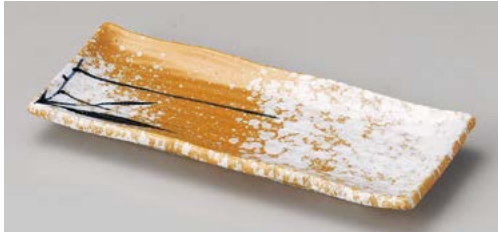
ア122-167 あげぼの突出皿 25.5×10.5×2.5cm(40入・磁)