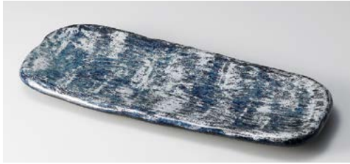
ト122-207 パレット 荒波 29cm突出皿 29×12×2.5cm(24入・磁)