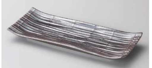
口122-147 鉄砂 長角9.0皿 27.8×11.5×3cm(30入・磁)