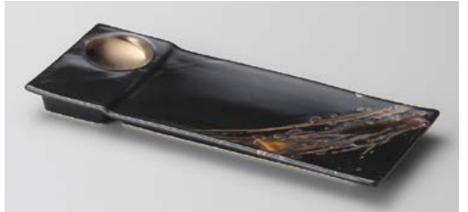
カ122-067 ゴールド線模様珍珠付突出皿 26×10.3×2cm(40入・磁)