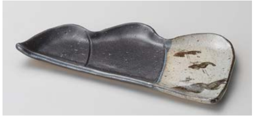
ミ122-107 黒織部サビ絵山型皿 20.5×11.2cm(80入・陶)