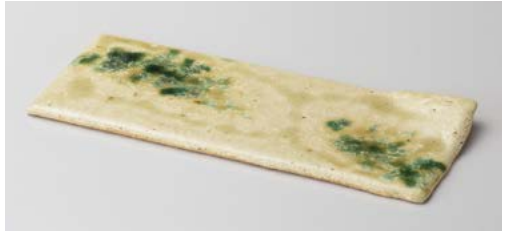
ネ122-037 織部散らし焼物皿 26.5×11×1.5cm(30入・陶)