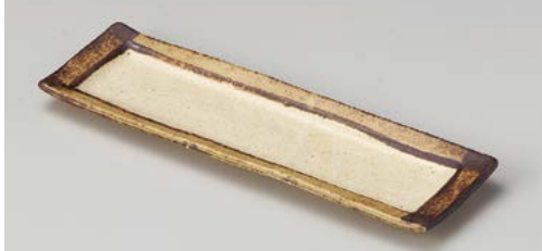
ト122-117 角淵サビ突出し皿 28×9×2cm(60入・磁)