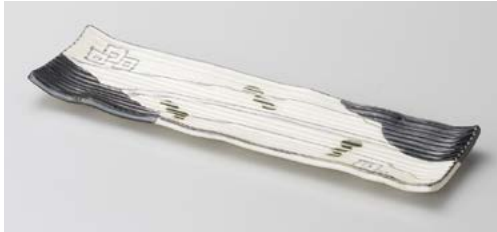
ミ122-057 黒織部 細長皿 29.3×8.2×2cm(60入・陶)