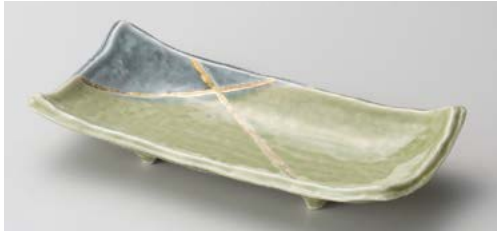
ア122-087 若草金彩四つ足長角皿(大) 23.3×11.2×4.2cm(40入・磁)