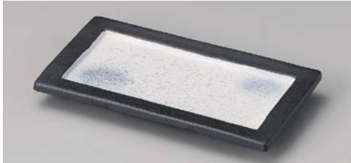
ア122-047 むらさきパール長角皿 22.9×12.5×2.2cm(30入・磁)