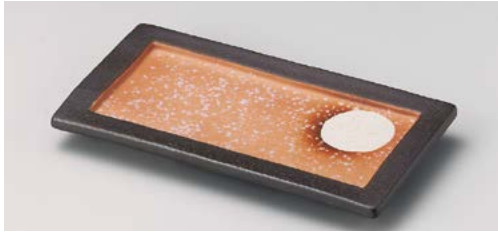
ト122-077 黒土満月突出皿 22.5×12.3×2.2cm(30入・磁)