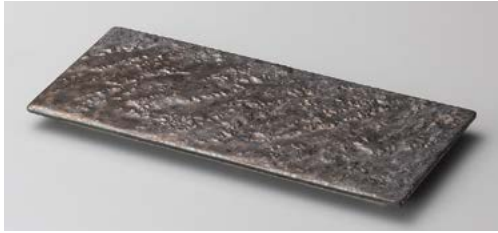
ホ122-197 金結晶23.5cm長角皿 23.5×11×1.3cm(40入・磁)