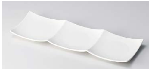
ミ121-117 NBエクシード3連モダン皿 28.6×9.7×2cm (48入・磁) (中国)