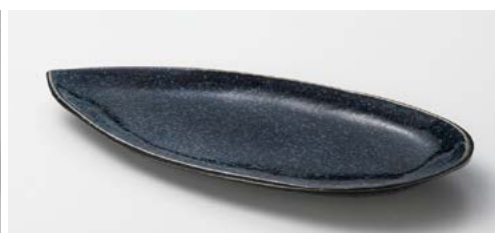
カ121-177 新淡雪しずくサンマ皿 30×12.6×2.4cm (40入・磁)