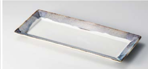
ア121-027 E シーレ29.5cm長角皿 29.5×12.3×2.4cm (30入・磁)