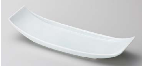
キ121-047 青白磁舟型皿 32×10×5cm (20入・磁)