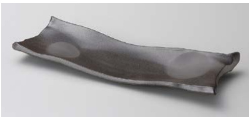
キ121-077 炭化土ちぎり長皿 35×13×3.5cm (30入・陶)