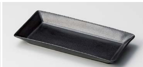
ア121-147 黒釉23.5cm長角皿 23.5×11.5×2.6cm (40入・磁)