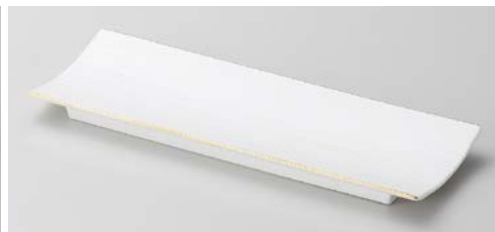
カ121-087 測金白マット筋彫長角皿 26.7×9.6×1.7cm (40入・磁)