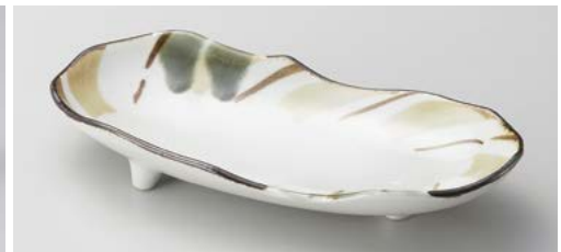
オ121-127 モダン十草三つ足大皿 25.4×12.2×4.8cm (40入・磁) (美濃焼)