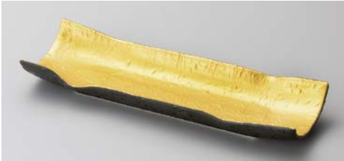
オ121-017 油滴天目金和紙突出皿 28.5×9.4×3.9cm (48入・磁) (美濃焼)