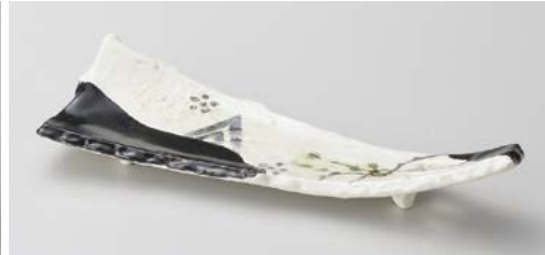
ミ121-057 黒織部弥七田扇皿 26.5×9.2×5cm (60入・磁)