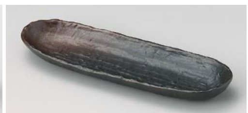
ヤ121-187 新黒備前トレー皿 30×9.8×3.4cm (40入・磁)