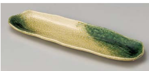
ユ121-167 黄瀬戸織部吹櫛目長皿 33.5×10×2cm (40入・陶)