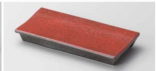
ツ121-097 紅黒炭 レール(小) 20.7×10×2.8cm (40入・陶)