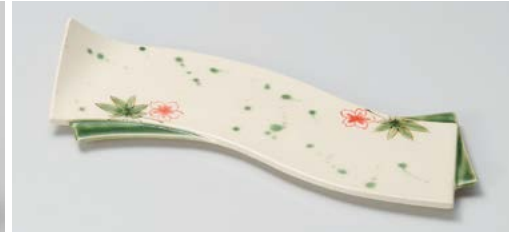
ツ121-067 春秋 重ねウェーブ皿(細) 28×9.6×3.5cm (30入・磁)