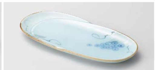
ミ121-157 手書きぶどう重ね皿 23.3×11×1.5cm (80入・磁)