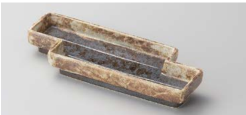
キ121-107 黒伊賀かいらぎハッ橋突出皿 24.5×9.2×3.7cm (50入・磁)