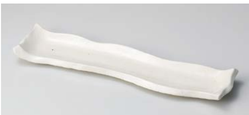
M119-107 手造りモダン粉引(土物)モダンカット尺2前菜皿 36.8×7.7×3.2cm (40入・陶)