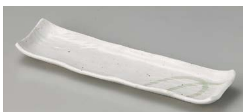
ヤ119-177 水晶ガラス流し長皿 32.8×9×3cm (50入・磁)