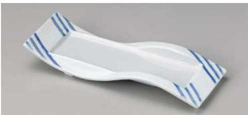
M119-077 ブルー線ラスター突出皿 32.3×11.5×3.8cm (40入・磁)