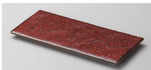
ホ119-147 赤柚子天目23.5cm長角皿 23.5×11×1.3cm (40入・磁)