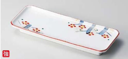
A119-017 手描き梅園突出皿 23.8×8.6×2.5cm (40入・強)