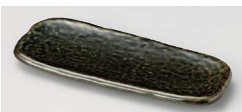
イ119-167 匠織部パレット突出皿 29×11.9×2.1cm (20入・磁)