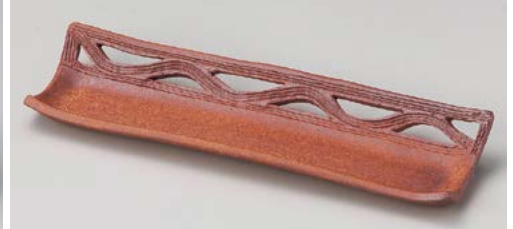
M119-037 火色透かし長角突出し皿(手造り) 28.5×8.5×3cm (50入・陶)