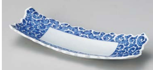
M119-027 タコ唐草波淵突出皿 27.5×9.2×4.2cm (60入・磁)