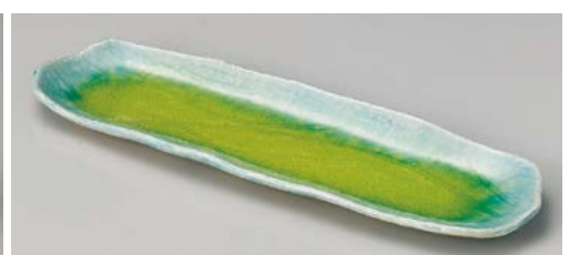
イ119-187 菜花くじ目長皿 35×10×2cm (40入・磁)