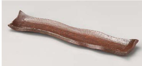
M119-057 備前風モダンカット12.0前菜皿 36.5×7.7×3cm (40入・陶)