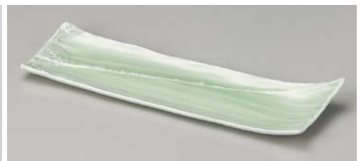
タ119-127 もえぎしぶぎ長皿 33.8×9×3.5cm (40入・磁)