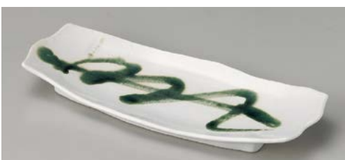
ツ119-137 白マット織部流し長皿 30.5×12.7×3cm (40入・磁)