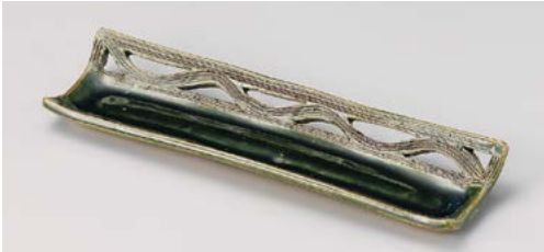
M119-047 織部透かし長角突出し皿(手造り) 28.5×8.5×3cm (50入・陶)