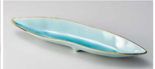
K119-067 瀬鯖マリンプルー葉型長皿 31×3cm (30入・磁)