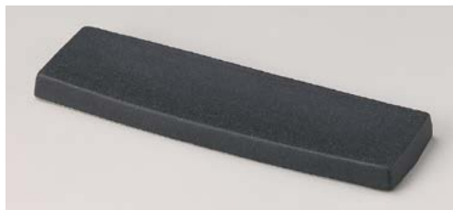
ホ119-087 黒マットロングまな板 30×9cm (36入・磁)