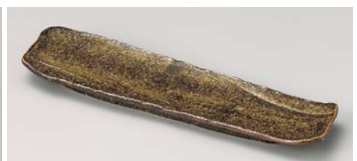
ネ119-157 不動荒磯長皿 36×9.5×2.8cm (30入・磁)