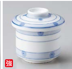
強 ロ111-247 ダミラインむし碗 φ6.8×7.8cm(80入・強) 1,110円