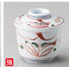
強 カ111-197 手描き京小花ミニむし碗 φ6.8×7.5cm(100入・強) 2,200円