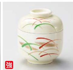
強 オ111-187 武蔵野ミニむし碗 φ7×7.8cm(80入・強) 2,380円