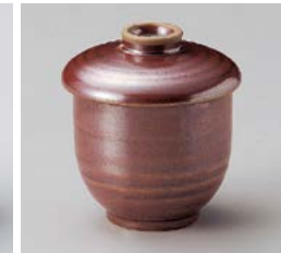
ロ111-277 紅結晶小蒸し φ6.7×8cm(80入・磁) 1,060円