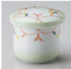
ミ111-297 小花ミニむし碗 φ6.6×6.9cm(80入・磁) 1,400円