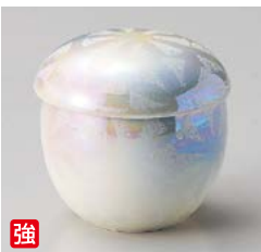
強 カ111-167 ラスター銀彩二色吹むし碗(小) φ6.5×7cm(100入・強) 2,550円