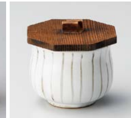
ネ111-337 十草むし碗 小身 φ7.5×5.8cm(80入・磁) 900円 ネ111-347 十草むし碗 小木蓋 φ8.2×1.5cm(120入) 300円