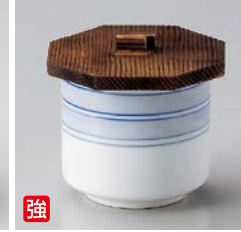
強 ア111-147 駒筋小むし φ6.8×7.5cm(120入・強) 900円