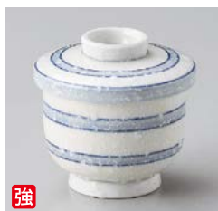
強 ロ111-367 かすみ二本筋むし碗 φ6.5×7.2cm(120cc)(80入・強) 1,280円