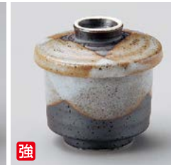
強 ロ111-267 志野塗分むし碗(小) φ6.3×7.2cm(110cc)(80入・強) 1,370円