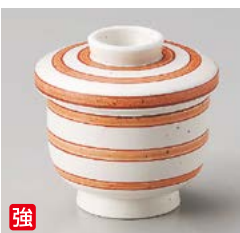
強 ロ111-357 赤絵筋マツ軸むし碗 φ6.5×7.2cm(120cc)(80入・強) 1,880円