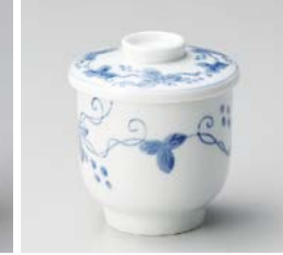
ハ111-157 つたぶどうむし碗 φ8×9cm(60入・磁)(中国) 1,140円