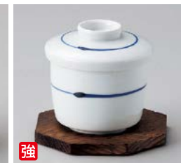
強 チ111-217 呉須筋ミニ蒸碗 φ6.9×7.5cm(60入・強) 1,350円