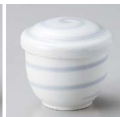
キ111-387 渦むし碗(中) φ7.2×7.5cm(80入・磁) 1,050円