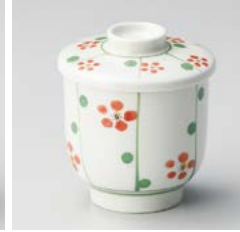
ハ111-137 十草梅むし碗 φ8×9cm(60入・磁)(中国) 1,140円