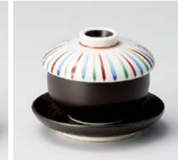
ロ111-087 三色十草ミニミニ蒸し φ7×6cm(100入・陶) 1,300円 ロ111-097 黒ミニミニ受皿 φ9.2×1.8cm(300入・陶) 360円