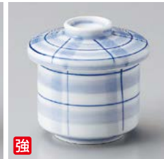
強 ロ111-257 格子むし碗 φ6.8×7.8cm(80入・強) 1,110円