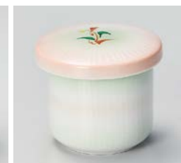
ホ111-407 オレンジ小花あけぼのミニむし碗 φ6.5×6.5cm(120cc)(80入・磁) 1,280円

刺身鉢・千代口 向付 中鉢 小鉢 小付 珍味 松花堂 蓋向 円菓子碗 むし碗 天皿・とんすい