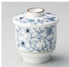
ハ111-177 花草草むし碗 φ8×9cm(60入・磁)(中国) 1,140円