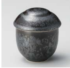
ア111-117 黒クリスタル小むし碗 φ7×8.5cm(140cc)(80入・磁) 1,210円