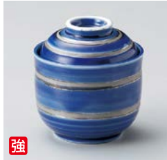
強 ア111-027 ルリ銀千段小むし 碗 φ8×8.5cm(80入・強) 2,160円