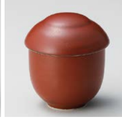
ア111-127 朱小むし碗 φ7×8.5cm(140cc)(80入・磁) 1,210円