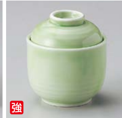
強 ア111-057 ヒワ小むし碗 φ8×8.5cm(80入・強) 1,800円