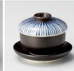
ロ111-067 南蛮青十草ミニミニ蒸し φ7×6cm(100入・陶) 1,300円 ロ111-077 黒ミニミニ受皿 φ9.2×1.8cm(300入・陶) 360円