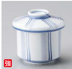
強 ロ111-237 親子十草むし碗 φ6.8×7.8cm(150cc)(80入・強) 1,110円