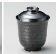
タ111-397 黒天目一口碗 7.1×9.3cm(80入・磁) 1,100円