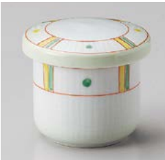
ミ111-287 間取格子ミニむし碗 φ6.6×6.9cm(80入・磁) 1,400円