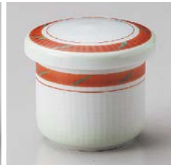
ミ111-307 細点字ミニむし碗 φ6.6×6.9cm(80入・磁) 1,300円