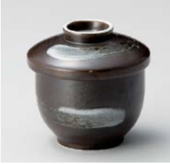
ト111-107 鉄結晶むし碗(小) φ7.8×8.4cm(80入・磁) 1,250円