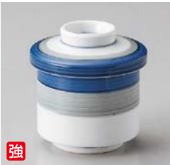
強 ロ111-227 二色ラインむし碗 φ6.7×8.5cm(80入・強) 1,380円