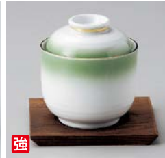
強 ロ111-037 グリーンむし碗 φ8×8.4cm(170cc)(80入・強) 2,050円 ロ111-047 焼杉受皿 10×10cm(200入)(木製品) 290円