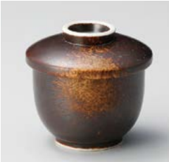
ト111-017 焼締むし碗(小) φ7.8×8cm(80入・磁) 1,250円