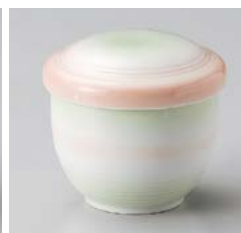
カ111-377 白磁二色吹き(中)むし碗 7.2×7.5cm(80入・磁) 1,050円