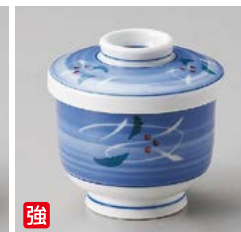
強 ロ111-207 彫唐草むし碗 φ6.5×7.2cm(120cc)(80入・強) 1,450円