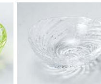
ハ083-417 荒波(スキ)豆珍味(ガラス) 6×5.3×2.5cm(10×20入) (ガラス) 1,300円