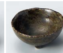
カ083-257 織部結晶三ツ足鉢 小 φ8.2×3.8cm(120入・磁) 280円