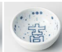
イ083-457 吉深豆皿 φ6.2×2.5cm(200入・陶) 280円