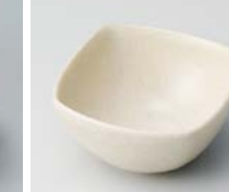
ヨ083-057 うのふ角小付 #013 6.7×6.7×3.5cm(120入・磁) 450円