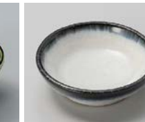
イ083-277 ゴス流し貫入 豆皿 φ6.5×2cm(200入・陶) 350円