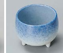
カ083-047 吹墨丸三ツ足珍味(小) 5×3.6cm(150入・磁) 480円