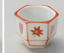
タ083-037 春秋ぼんぼり珍味 4.5×3.3cm(200入・磁) (中国) 280円