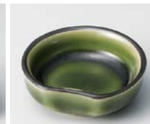
ロ083-387 織部 片押豆千代口 5.8×5.5×2.1cm(300入・陶) 360円