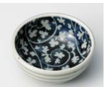
イ083-437 益子唐草深豆皿 φ6.2×2.5cm(200入・陶) 280円