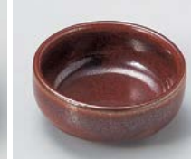
ネ083-107 赤鉄丸珍味 小 φ6.5×2.8cm(200入・磁) 250円