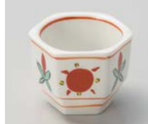
タ083-027 丸紋ぼんぼり珍味 4.5×3.3cm(200入・磁) (中国) 280円