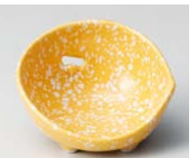
キ083-367 黄白吹かまくら珍味 7.2×4.2cm(150入・磁) 900円