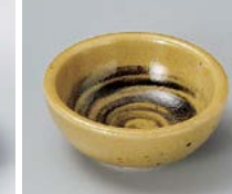
ネ083-117 黄瀬戸 φ6.1×2.5cm(200入・磁) 210円