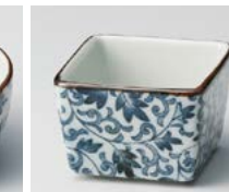
ソ083-337 古染つる唐草 正角珍味 5.2×5×3.5cm(50cc) (磁) (有田焼) 570円