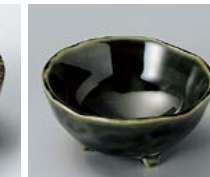
ホ083-267 織部三ツ足珍味 8×4cm(160入・磁) 290円