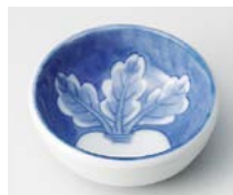
イ083-447 かぶら深豆皿 φ6.2×2.5cm(200入・陶) 280円