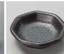
ト083-187 黒鉄吹き 八角小皿 7.5×7.2×2cm(120入・磁) 460円