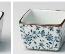
ソ083-357 古染スイート 正角珍味 5.2×5×3.5cm(50cc) (磁) (有田焼) 570円