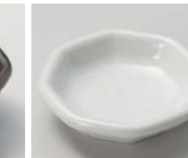
ト083-207 白マット 八角小皿 7.5×7.2×2cm(120入・磁) 460円