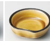
ロ083-397 黄瀬戸 片押豆千代口 5.8×5.5×2.1cm(300入・陶) 360円