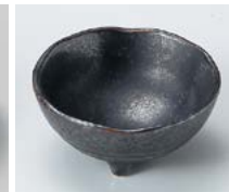
カ083-247 ゴールド結晶結晶三ツ足鉢 小 φ8.2×3.8cm(120入・磁) 280円