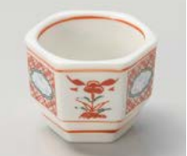
タ083-017 山水ぼんぼり珍味 4.5×3.3cm(200入・磁) (中国) 280円