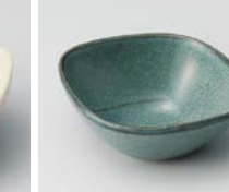
ヨ083-067 窯変グリーンつまみ #049 7.7×6.3×3cm(120入・磁) 450円