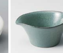
ヨ083-137 窯変グリーンつまみ片口 #009 8×6×3.5cm(120入・磁) 400円