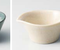
ヨ083-147 うのふつまみ片口 #008 8×6×3.5cm(120入・磁) 400円