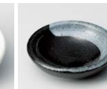
ネ083-487 黒刷毛ミニ皿 7.5×1.7cm(200入・陶) 240円