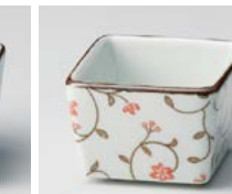
ソ083-347 古染錆唐草(赤) 正角珍味 5.2×5×3.5cm(50cc) (磁) (有田焼) 570円