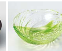
ハ083-407 荒波(グリーン)豆珍味(ガラス) 6×5.3×2.5cm(10×20入) (ガラス) 1,400円