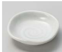
ト083-237 白マット2.8なで角皿 8.3×7.7×2.1cm(100入・磁) 330円