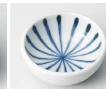
イ083-467 太十草深豆皿 φ6.2×2.5cm(200入・陶) 280円