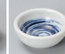
ネ083-127 ゴス渦珍味 φ6.1×2.5cm(200入・磁) 210円