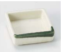
オ083-227 織部流し角鉢角千代口 7.6×7.6×2.3cm(150入・磁) (美濃焼) 360円