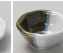
ト083-217 織部塗分け 八角珍味 6×5.8×2.6cm(120入・磁) 580円