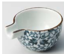
ソ083-307 古染つる唐草 片口珍味 6.8×5.6×3cm(30cc) (磁) (有田焼) 570円