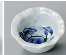
オ083-177 吹墨淵波カニ珍味 6×2.7cm(200入・磁) 550円