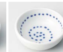
イ083-477 ドットウス深豆皿 φ6.2×2.5cm(200入・陶) 280円