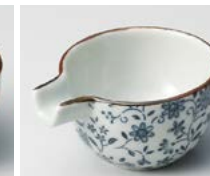
ソ083-327 古染スイート 片口珍味 6.8×5.6×3cm(30cc) (磁) (有田焼) 570円