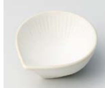
ト083-097 金砂 萌 珍味 6.7×6×3cm(200入・磁) 370円