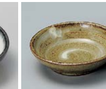
イ083-287 茶刷毛目小皿 φ6.5×1.9cm(200入・陶) 350円