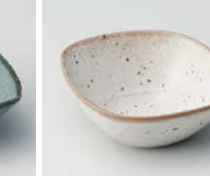
ヨ083-077 オルジュつまみ #051 7.7×6.3×3cm(120入・磁) 450円