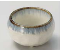
チ083-157 ウノフ三ツ足珍味(小) φ4.8×3cm(200入・磁) 430円