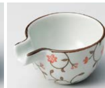
ソ083-317 古染錆唐草(赤) 片口珍味 6.8×5.6×3cm(30cc) (磁) (有田焼) 570円