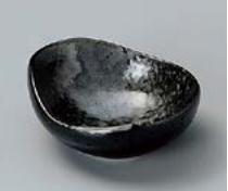
イ083-087 黒水晶白吹タゴ型珍味 6×5.5×2.5cm(300入・陶) 280円