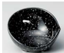
キ083-377 黒白吹かまくら珍味 7.2×4.2cm(150入・磁) 900円