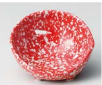
キ083-297 赤白吹かまくら珍味 7.2×4.2cm(150入・磁) 900円