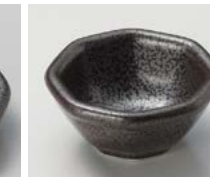
ト083-197 黒鉄吹き 八角珍味 6×5.8×2.6cm(120入・磁) 460円