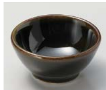
ト083-167 織部 こつぶ φ5.8×2.8cm(100入・磁) 350円