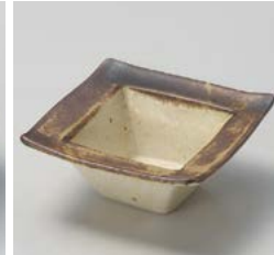
ト059-097 角瀝サビ小鉢 11.7×11.7×5cm(80入・磁) 1,450円