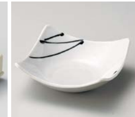
ソ059-197 白釉黒一珍四方上り鉢(小) 13×13×4.5cm(80入・磁) 970円