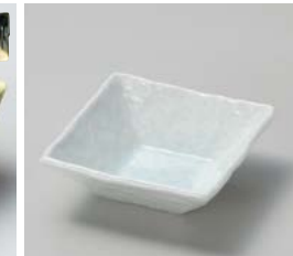
タ059-257 青白磁正角浅小鉢 φ11×11×4cm(80入・磁) 800円