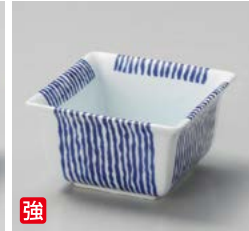
強 ウ059-037 乱十草 反小鉢 9×9×5.2cm(100入・強)(イングレ) 1,700円