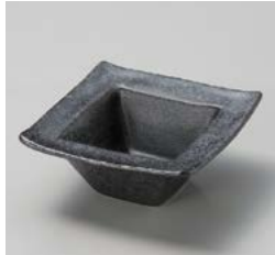
カ059-077 銀黒回角小鉢 11.5×11.5×5cm(100入・磁) 1,500円