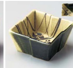
イ059-247 織部深小鉢 9.5×9.5×4.7cm(100入・陶) 850円