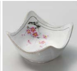
オ059-157 野書紅梅4.0四方鉢 10.5×10.5×6.2cm(100入・陶) 1,150円