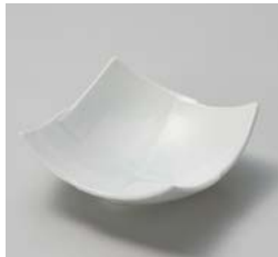
イ059-137 青地市松彫4.5鉢 14×14×5.2cm(80入・磁) 1,100円 イ059-147 青地市松彫3.5鉢 11×11×6cm(100入・磁) 950円