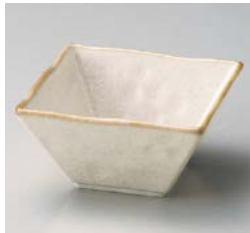
ハ059-267 粉引しおり角小鉢 10.9×10.9×5.6cm(80入・磁) 850円