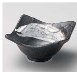
イ059-337 栗色刷毛目塗り壁3.5角小鉢 10.3×10.3×6cm(100入・磁) 630円