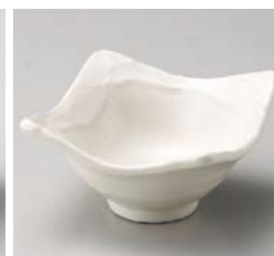
イ059-347 練色塗り壁3.5角小鉢 10.3×10.3×6cm(100入・磁) 630円