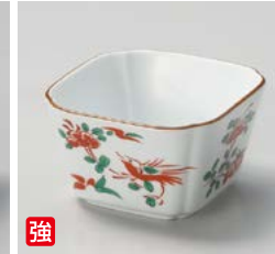
強 ウ059-047 赤絵花鳥入角小鉢 9.5×9.5×5.4cm(80入・強)(美濃焼) 1,750円