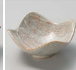
テ059-107 粉引刷毛目四ツ山小鉢 12.5×12.5×6cm(80入・陶) 1,350円