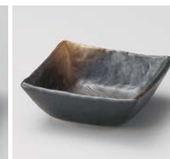
ア059-367 備前吹(松花堂兼用)角小鉢 10.5×10.5×3.9cm(100入・磁) 520円