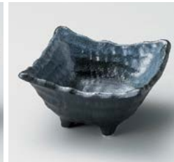
ツ059-287 黒志野四つ足3.6小鉢 10×10×5.5cm(100入・磁) 750円