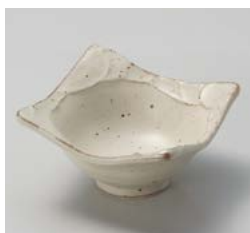
カ059-327 オルジェ塗壁10cm角小鉢 10×10×5.8cm(100入・磁) 600円