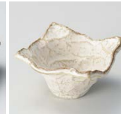
イ059-307 萩粉引波四角小鉢 小 11.5×11.5×6.8cm(100入・磁) 500円