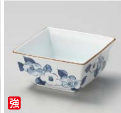
強 ウ059-027 イングリ椿絵 反角小鉢 9.8×9.8×5cm(100入・強)(イングレ) 1,800円