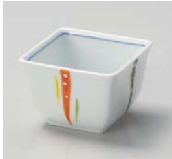
タ059-017 剣先四角仲付 8×8×5.5cm(80入・磁)(有田焼) 1,980円