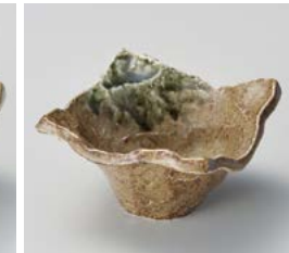
イ059-317 古信楽オリエ吹波四角小鉢 11.5×11.5×6.8cm(100入・磁) 500円