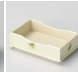
コ059-187 黄釉織部流し 重ね長角鉢 11.5×7.4×3.5cm(60入・陶) 1,220円