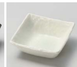
ホ059-377 グリーン吹四角小鉢 10.8×10.8×4cm(70入・磁) 490円