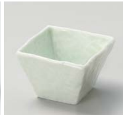
ト059-217 もえぎ 正角深小鉢 9×9×6cm(80入・磁) 900円