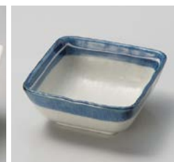
ハ059-357 一珍瀝ライン3.6角小鉢 10.5×10.5×4.3cm(100入・磁) 590円