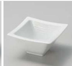
ア059-167 白磁縞織角小鉢 11×11×6cm(60入・磁) 1,000円