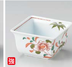
強 ウ059-057 赤絵草花 反四角小鉢 9×9×5.2cm(100入・強) 1,700円