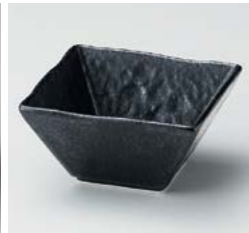
ハ059-277 黒水晶しおり角小鉢 10.9×10.9×5.6cm(80入・磁) 850円