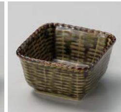
ホ059-177 カゴメ織部角小鉢 9.7×9.7×5.5cm(90入・磁) 1,150円