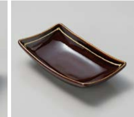
ア059-127 琥珀ロングボール 16×9.2×3.5cm(60入・磁) 1,150円