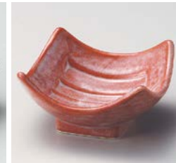
ウ059-237 赤染四方向上り小鉢 10×10×5.3cm(80入・陶) 850円