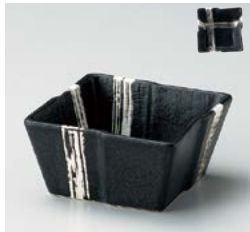
ト059-207 黒カヤメクロス角小鉢 10.1×10.1×5cm(80入・磁) 880円