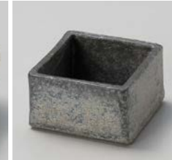
メ059-117 黒窯変3.0角小鉢 8.7×8.7×4.9cm(50入・陶) 1,440円