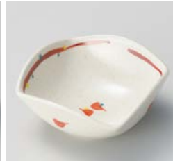
ホ059-087 芽生え四ツ山小鉢 9.5×9.5×4.2cm(100入・磁) 1,100円