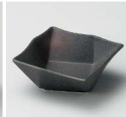
ネ059-227 備前風オリエ角鉢小 9.6×9.6×3.8cm(100入・磁) 1,000円