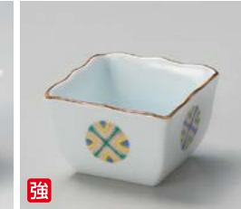
強 ウ059-067 錦丸紋 波瀾小鉢 8×8×5.1cm(100入・強) 1,800円