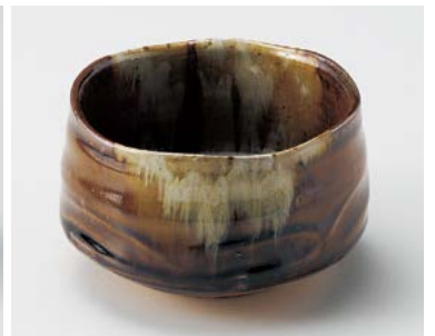
ミ026-177 朝鮮唐津抹茶碗 φ12.5×8.2cm (80入・陶) 2,800円