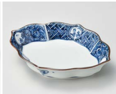
ト026-167 丸紋山水木甲型 向付 18.5×14.5×3.8cm (70入・磁) 2,750円