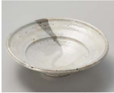
ト026-027 粉引ヌリ分段付6.5鉢 φ19×5.6cm (40入・陶) 3,600円