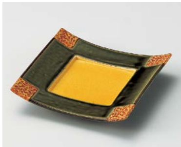
ホ026-067 織部スジ正角皿 17×17×3.6cm (40入・磁) 3,380円