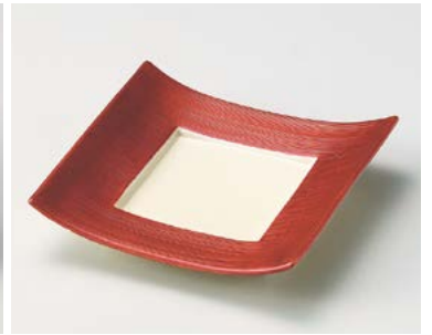
ミ026-137 パールレッド正角皿 16.7×16.7×3.8cm (40入・磁) 3,150円