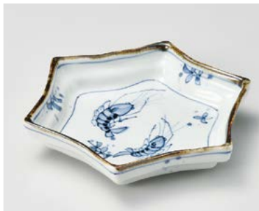
ト026-157 吹墨エビ六角 6寸皿 19×16.5×3.5cm (50入・磁) 2,800円