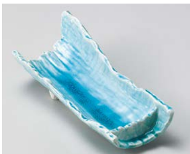
ツ026-187 マリンブルー竹割型向付 30.5×13×7.5cm (30入・陶) 2,900円