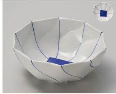
オ026-037 紺筋十角鉢 16.7×15.8×6.4cm (50入・磁) (美濃焼) 3,750円