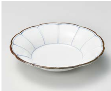
ト026-117 染付菊割輪花 6寸向付 φ19×4cm (60入・磁) 2,900円