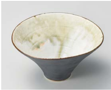
ミ026-107 灰釉流し朝顔鉢 15.2×14.4×8cm (50入・磁) 3,050円