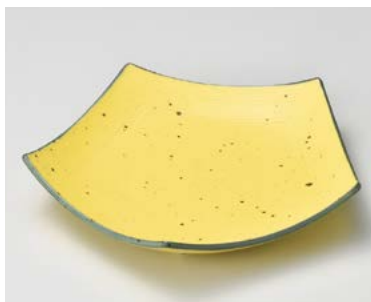
ツ026-197 鉄粉黄五角皿(大) 23.5×23.5×4.5cm (20入・磁) 2,300円