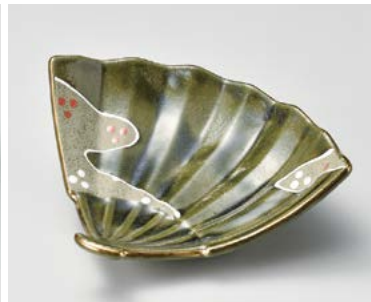
ア026-077 金彩織部扇型向付 21×17.6×5.8cm (40入・磁) 3,400円