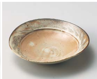
テ026-207 粉引櫛目楕円和皿 19.5×17.5×4.5cm (60入・陶) 3,200円