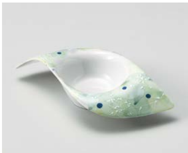
ツ026-147 染付一珍風車型小鉢 28×12×5.7cm (50入・磁) 2,900円