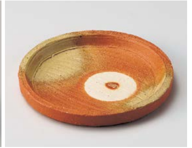
カ026-047 伊賀炎色切立6.5平皿 φ20.4×2.3cm (30入・陶) 3,400円