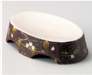
ミ026-127 金流水槽円高台向付 19.5×13.4×4.7cm (30入・磁) 3,180円