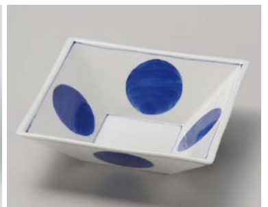
オ026-217 ダミ丸紋角向付 15.2×15.2×4.3cm (60入・磁) (美濃焼) 2,750円