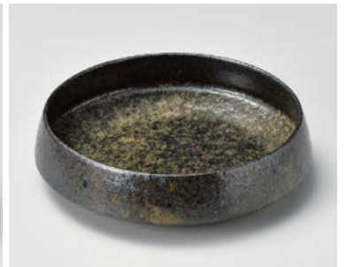
キ026-087 黒唐津くくり鉢(大) φ19×5.2cm (50入・磁) 3,200円 キ026-097 黒唐津くくり鉢(小) φ16×4cm (80入・磁) 2,500円