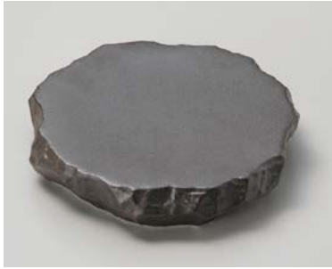
ツ026-017 あら黒 ロックプレート(中) 21×19×4.2cm (30入・磁) 3,500円

刺身鉢・千代口 向付 中鉢 小鉢 小付 珍味 松花堂 蓋向 円菓子碗 むし碗 天皿・とんすい