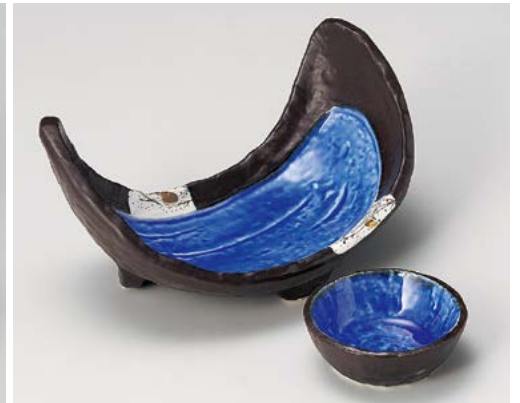
ソ008-177 南蛮二方上り刺身鉢 19.7×10.6×9cm (30入・陶) 3,500円 ソ008-187 南蛮千代口 φ8.2×2.7cm (200入・陶) 1,050円