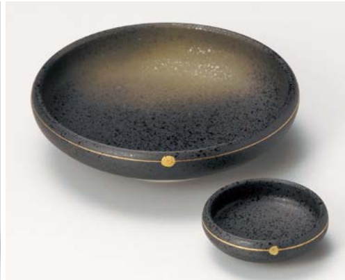
ミ008-097 金彩焼締め鉄鉢向付 φ15.2×4.1cm (60入・陶) 3,450円 ミ008-107 金彩焼締め鉄鉢千代口 φ6.8×2.4cm (200入・陶) 1,100円