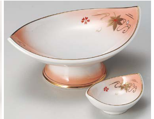
オ008-117 オレンジ吹舟型高台刺身鉢 20.8×14.2×8.3cm (30入・磁) 3,800円 オ008-127 オレンジ吹舟型千代口 9.1×7×3.6cm (200入・磁) 1,350円