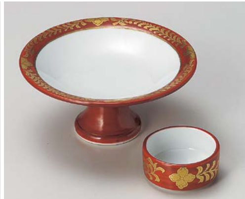
ミ008-157 朱巻金彩高台向付 φ14.5×6.3cm (30入・磁) 3,850円 ミ008-167 朱巻金彩丸千代口 φ6.8×3cm (150入・磁) 1,500円