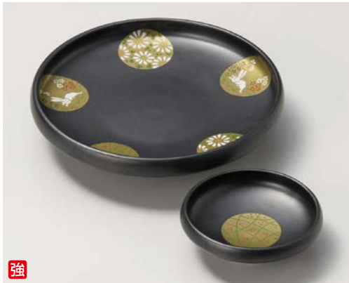
強 ウ008-137 黒釉金彩丸紋 向付 φ15.7×3.3cm (60入・強) 3,800円 ウ008-147 黒釉金彩丸紋 千代口 φ8.5×2.7cm (120入・強) 1,700円