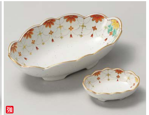
強 ウ008-237 錦瓔珞楕円刺身 21.5×11.5×6.2cm (40入・強) 3,300円 ウ008-247 錦瓔珞楕円千代口 9.4×7×2.9cm (80入・強) 1,550円