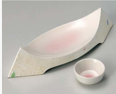
ミ008-037 ラスターピンク吹舟型向付 30.5×10.7×6.5cm (30入・磁) 3,800円 ミ008-047 ラスターピンク吹丸千代口 φ6.5×2.9cm (200入・磁) 860円