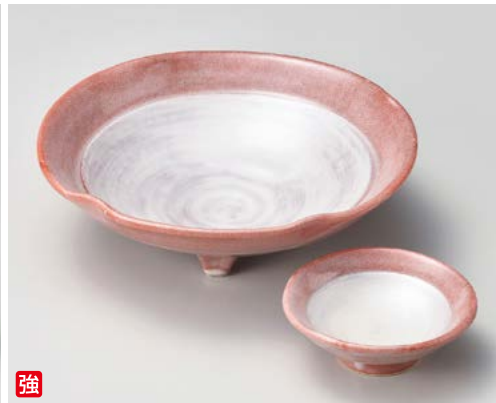
強 ウ008-217 赤楽銀彩向付 φ18×5.5cm (40入・強) 3,000円 ウ008-227 赤楽銀彩千代口 φ9×3cm (100入・強) 1,100円