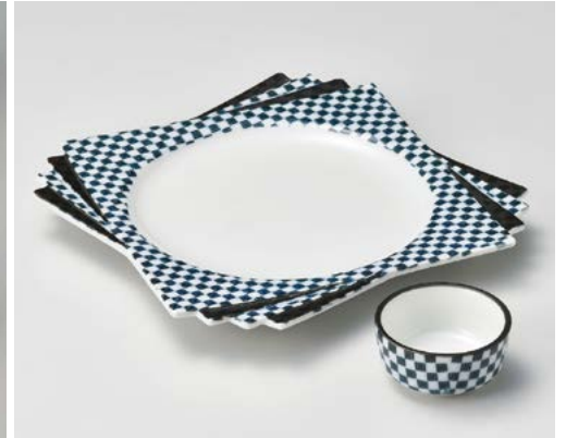
ソ008-057 青市松千代折角刺身皿 25×25×2.5cm (40入・磁) 2,700円 ソ008-067 青市松丸千代口 φ6.3×3cm (150入・磁) 750円