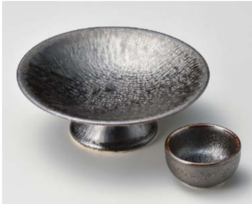
ソ008-077 黒結晶丸高台刺身 φ16.5×6cm (30入・磁) 2,650円 ソ008-087 黒結晶丸千代口 φ6.5×3.3cm (120入・磁) 750円