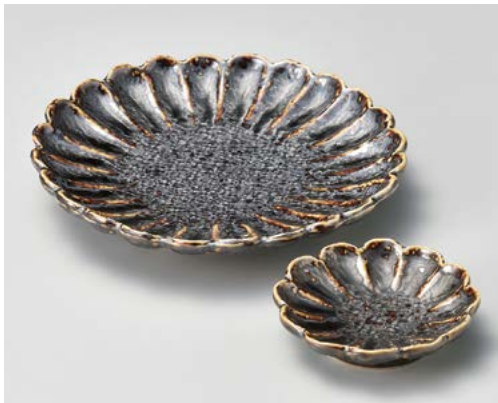
イ008-197 金茶菊型さしみ皿 φ17×3.3cm (40入・磁) 2,400円 イ008-207 金茶菊型千代口 φ8.5×2.1cm (80入・磁) 800円