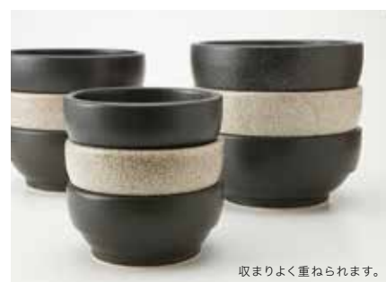
収まりよく重ねられます。