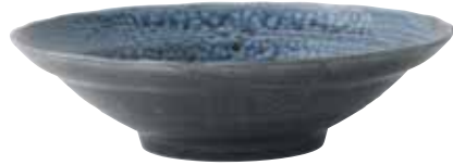
024-0098 尺盛り鉢 φ31×8.2cm 6,000円