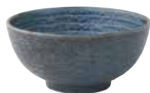
024-0141 砂目5.8丸丼 φ17.3×8.2cm 1050cc 1,380円