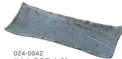
024-0042 枯山水 長角皿 中 31cm 31×12.5×3cm 2,700円