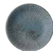
024-0005 千段4.0皿 φ12.9×2.2cm 600円