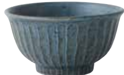
024-0051 しのぎ5.5丼 φ17.8×9.5cm 1,850円