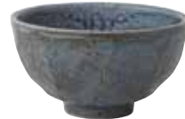
024-0142 5.5面取丼 φ17×9.7cm 1130cc 1,380円