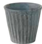
024-0022 しのぎロック φ9.2×8.6cm 260cc 700円