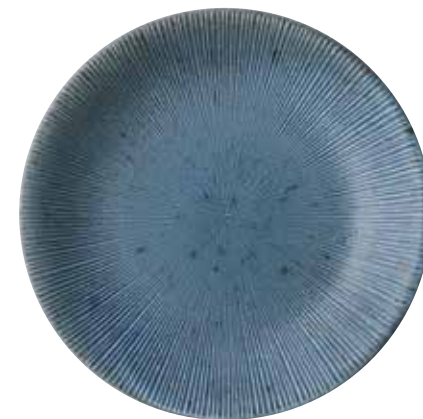
024-0001 千段尺皿 φ30.5×4.3cm 4,000円