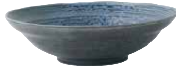
024-0097 9.0盛り鉢 φ27×7cm 4,000円