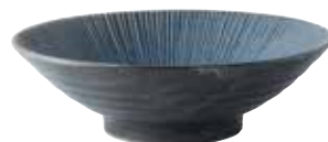
024-0166 千段8.0めん鉢 φ24.5×7.5cm 1,580円