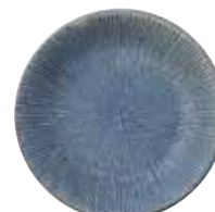
024-0004 千段4.5皿 φ15×2.2cm 750円