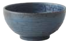
024-0140 砂目5.0丸丼 φ15.5×7.7cm 820cc 900円