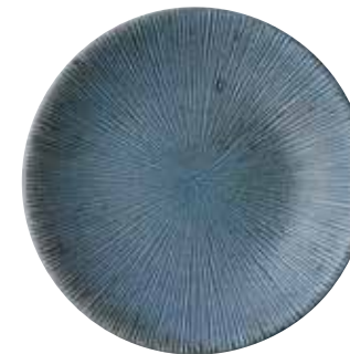
024-0002 千段7.5皿 φ23.7×3.4cm 1,480円