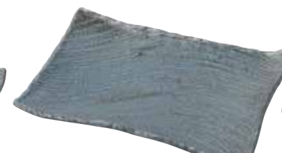
024-0039 枯山水 角皿31cm 31×21×4cm 4,800円