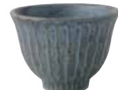
024-0049 しのぎ小丼 φ12.3×8.8cm 1,100円