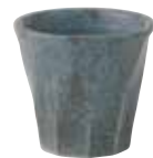
024-0023 ねじりロック φ9.2×8.6cm 260cc 700円