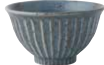
024-0050 しのぎ5.0丼 φ15.5×9cm 1,500円