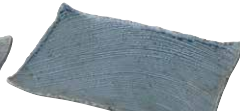
024-0038 枯山水 角皿37cm 37×24.5×4cm 6,200円