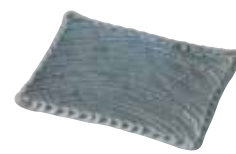
024-0035 枯山水 角皿17.5cm 17.5×13×2.2cm 930円