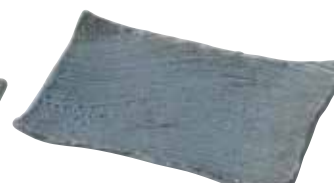
024-0040 枯山水 角皿26cm 26×17.5×3.5cm 2,800円