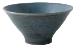
024-0161 6.5千段高ハマ丼 φ20×10cm 1100cc 2,000円