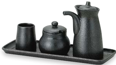
199 31 000 カスター3点セット ¥5,600 (199 31 088・173 31 083・199 31 066・173 31 049)