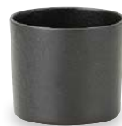
173 31 068 スティックシュガー& ナプキンスタンド 大 L-10 S-8.2 H-8.9 ¥1,800