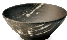
529 32 041 6.8けずり井 D-20.5 H-8.3 C-1,225cc ¥2,300