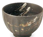
529 32 022 けずり十草4.8井 D-14.8 H-10.5 C-800cc ¥1,100