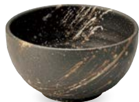
515 32 033 石目5.5井 D-17 H-9.5 C-1,260cc ¥1,800