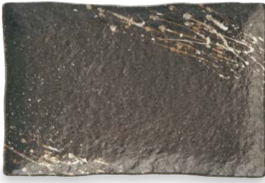
516 32 043 石目尺二長角皿 L-36.5 S-24.3 H-3.5 ¥6,100