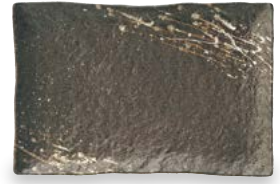
516 32 048 石目8.0長角皿 L-26 S-17.5 H-2.8 ¥2,800