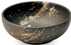
515 32 028 石目6.5ボウル D-20.4 H-7.5 C-1,350cc ¥1,700