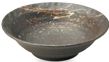
515 32 063 石目リム尺鉢 D-31 H-8.8 ¥6,400