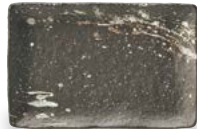
516 32 012 串皿 小 L-17 S-11.2 H-1.8 ¥850