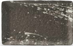
516 32 011 串皿 大 L-21.3 S-13.3 H-2 ¥1,200