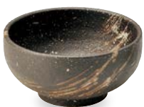
516 32 030 石目高浜5.5井 D-17.5 H-8.5 C-1,100cc ¥1,200