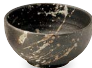
515 32 034 石目5.0井 D-15.5 H-7.7 C-750cc ¥1,100