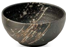
515 32 032 石目6.0井 D-19.5 H-9.6 C-1,580cc ¥2,400