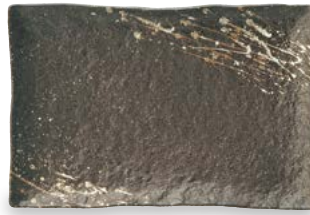
516 32 046 石目9.5長角皿 L-29 S-19 H-3 ¥3,900