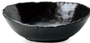
515 35 070 石目楕円鉢 大 L-27.4 S-19.7 H-9.2 ¥3,600