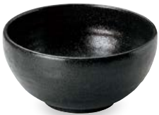
515 35 032 石目6.0井 D-19.5 H-9.6 C-1,580cc ¥2,300