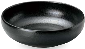
515 35 025 石目8.0ボウル D-24.5 H-7.6 C-2,420cc ¥3,000