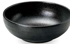
515 35 028 石目6.5ボウル D-20.4 H-7.5 C-1,350cc ¥1,600