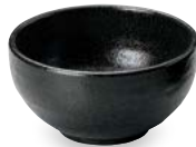
515 35 034 石目5.0井 D-15.5 H-7.7 C-750cc ¥950