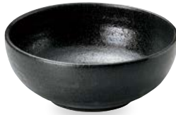
515 35 027 石目7.0ボウル D-21.8 H-8.4 C-1,840cc ¥2,500