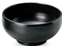
516 35 030 石目高浜5.5井 D-17.5 H-8.5 C-1,100cc ¥1,100