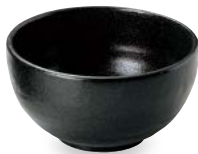
515 35 033 石目5.5井 D-17 H-9.5 C-1,260cc ¥1,600