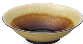
512 62 013 7.5平鉢 D-23 H-6.4 ¥2,100