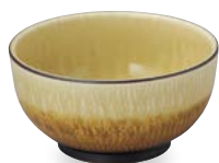
512 62 031 5.5多用井 D-17 H-8.7 ¥1,900