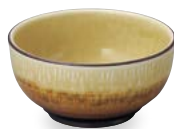
512 62 032 4.8多用井 D-14.7 H-7.2 ¥1,600