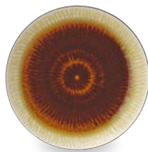
512 62 007 6.0丸皿 D-18 H-2.1 ¥900