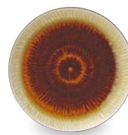
512 62 008 5.0丸皿 D-16 H-2.1 ¥850