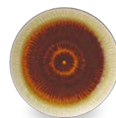
512 62 009 4.5丸皿 D-13.7 H-1.6 ¥700