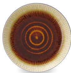
512 62 006 6.5丸皿 D-19.5 H-2.1 ¥1,100