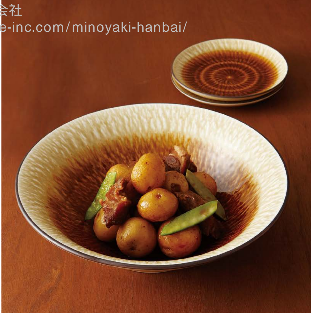
■水明かり 飴 4.5丸皿 ■水明かり 飴 8.5平鉢