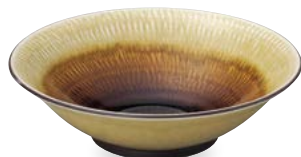
512 62 011 8.5平鉢 D-26.1 H-7.2 ¥2,800