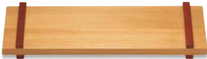
LP-204 プレート(中) 420×140×38(内330×140×10) ¥4,700