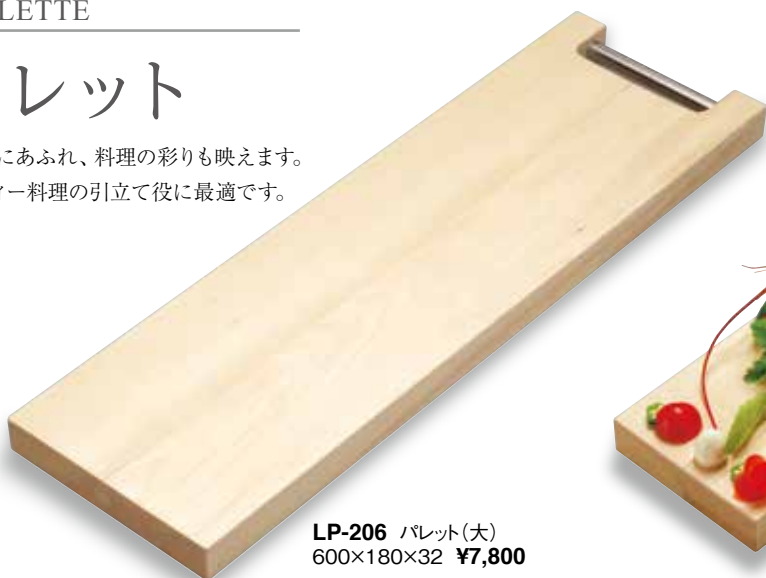
LP-206 パレット(大) 600×180×32 ¥7,800