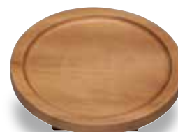
TD-504 丸型盛器(小) 145φ×45(内120φ×3) ¥3,900