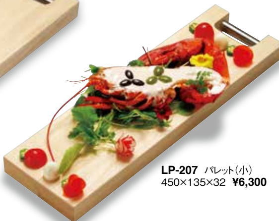
LP-207 パレット(小) 450×135×32 ¥6,300