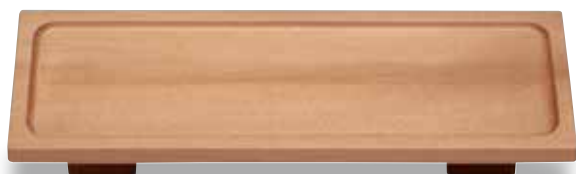
TD-501 長角盛器(大) 325×120×45(内305×100×3) ¥4,900