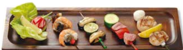
LP-201 プレート(大) 400×130×27(内380×110×8) ¥3,700