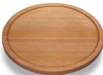
TD-503 丸型盛器(大) 205φ×45(内180φ×3) ¥4,600