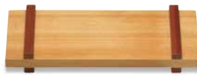
LP-205 プレート(小) 300×120×38 (内230×120×10) ¥4,000