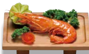
TD-502 長角盛器(小) 205×125×45(内180×105×3) ¥4,400