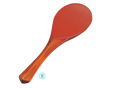
8-1089-9 困木製漆亀甲ベラ 22L 限定品 1-232-9 ¥1,050 (22.5L×7.1) 梱200