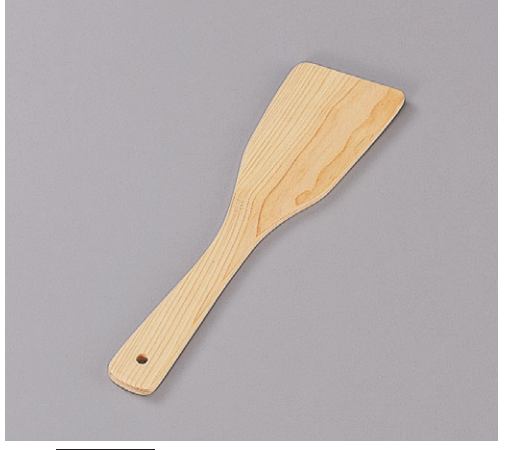
8-1089-15 困桧サーバー(大)30cm M-4-25 ¥900 (29) 梱100