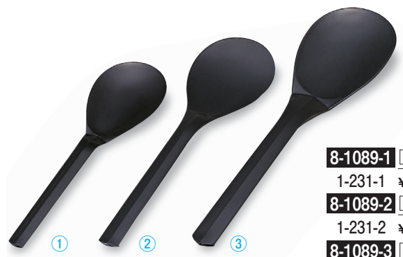
8-1089-1 P.P (小)ヘラ (1~2人用) 1-231-1 ¥220 (16.9×4.6) 梱300 8-1089-2 P.P (中)ヘラ (3人用) 1-231-2 ¥250 (19.5×5.5) 梱200 8-1089-3 P.P (大)ヘラ (5人~10人用) 1-231-3 ¥350 (22.3×6) 梱200