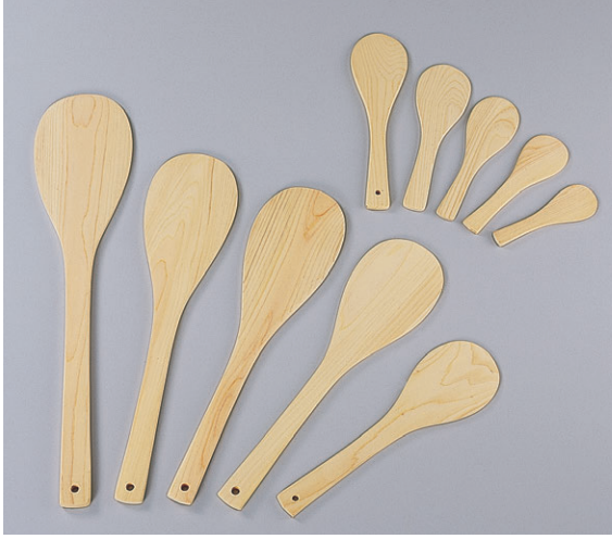
8-1089-16 困桧杓子 M-4-15 16cm ¥400 (16) 梱100 M-4-16 19cm ¥440 (19) 梱100 M-4-17 21cm ¥450 (21) 梱100 M-4-18 24cm ¥780 (24) 梱100 M-4-19 29cm ¥980 (29) 梱100 M-4-20 35cm ¥1,400 (35) 梱50 M-4-21 45cm ¥2,800 (45) 梱50 M-4-22 48cm ¥3,000 (48) 梱50 M-4-23 51cm ¥3,800 (51) 梱50 M-4-24 60cm ¥5,100 (61) 梱50

「18-0 ライラックシリーズ」は飽きのこないスタイリッシュなデザインの商品で構成されております。又、硬度が高く、非常に丈夫な仕上がりとなっております。