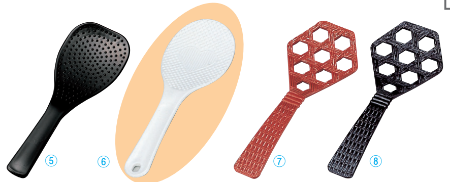
8-1089-5 P.P エンボスしゃもじ 黒 W-8-13 ¥230 (15.7×5.6×1) 梱300 8-1089-6 P.P エンボスしゃもじ 白 W-2-71 ¥280 (20.8×7×1.3) 梱200 8-1089-7 A 亀甲穴あきベラ 朱 W-2-72 ¥430 (20.3φ×7.7) 梱200 8-1089-8 A 亀甲穴あきベラ マロン W-2-73 ¥480 (20.3φ×7.7) 梱200