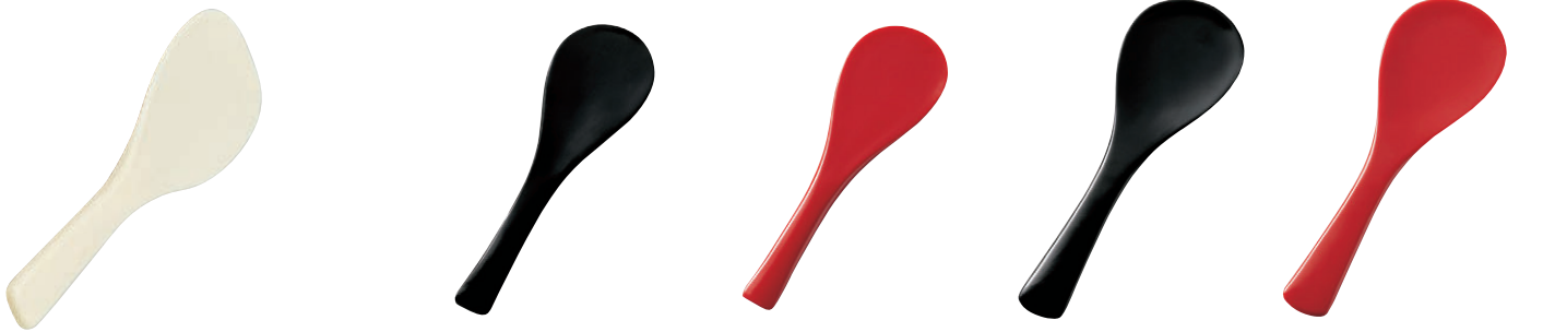
8-1089-10 1-848-30 P.P 杓子(釜飯用) ¥120 (16×5.5) 8-1089-11 H-19-43 M しゃもじ 黒 17cm ¥300 (17×5.1) 梱300 8-1089-12 H-38-1 M しゃもじ 朱 17cm ¥300 (17×5.1) 梱300 8-1089-13 H-38-2 M しゃもじ 黒 20cm ¥330 (19.7×6.3) 梱200 8-1089-14 H-38-3 M しゃもじ 朱 20cm ¥330 (19.7×6.3) 梱200