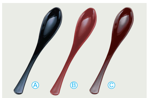
8-1082-4 (小) かゆスプーン (16×2.8) 梱500 A H-1-19 [AC] 黒 ¥220 B H-1-20 [AC] 朱 ¥220 C H-9-35 [A] 新溜 ¥370