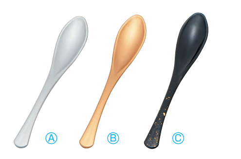
8-1082-5 (小) かゆスプーン (16×2.8) 梱500 A H-60-25 銀塗 ¥600 B H-60-26 金塗 ¥600 C H-60-27 黒色紙金箔 ¥900