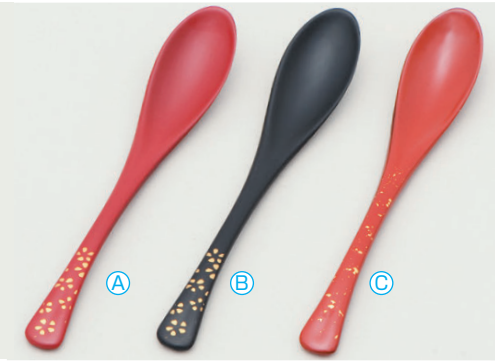
8-1082-2 [PBT] かゆスプーン (19.5×3.4) 梱500 A H-60-19 朱に金花 ¥900 B H-60-20 黒に金花 ¥900 C H-60-21 朱色紙金箔 ¥1,100