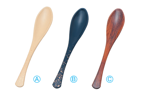
8-1082-6 (小) かゆスプーン (16×2.8) 梱500 A H-60-28 ベージュ金たたき ¥550 B H-60-29 紺金たたき ¥550 C H-60-30 紫檀木目 ¥1,050