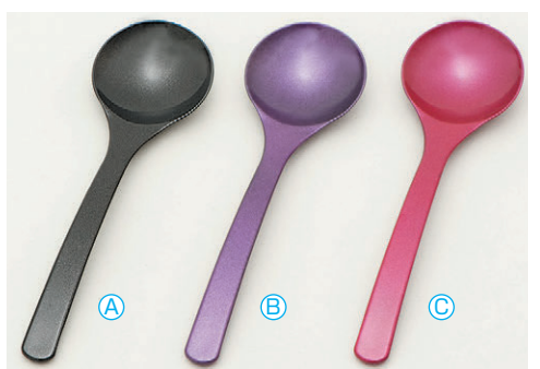
8-1082-10 [A] お玉スプーン (20×5.7) 梱500 A H-60-37 黒パール ¥800 B H-60-38 紫パール ¥800 C H-60-39 ワインパール ¥800