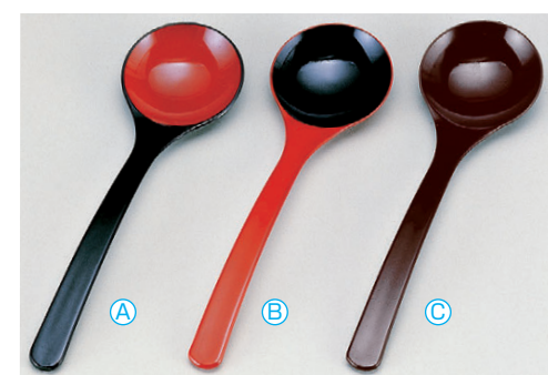
8-1082-9 [A] お玉スプーン (20×5.7) 梱500 A 1-772-26 黒内朱 ¥750 B 1-772-27 朱内黒 ¥750 C H-9-40 新溜 ¥750