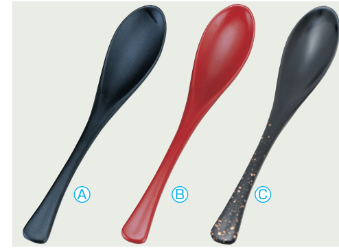
8-1082-1 [PBT] かゆスプーン (19.5×3.4) 梱500 A H-60-16 つや消黒 ¥650 B H-60-17 つや消朱 ¥650 C H-60-18 黒金たたき ¥800