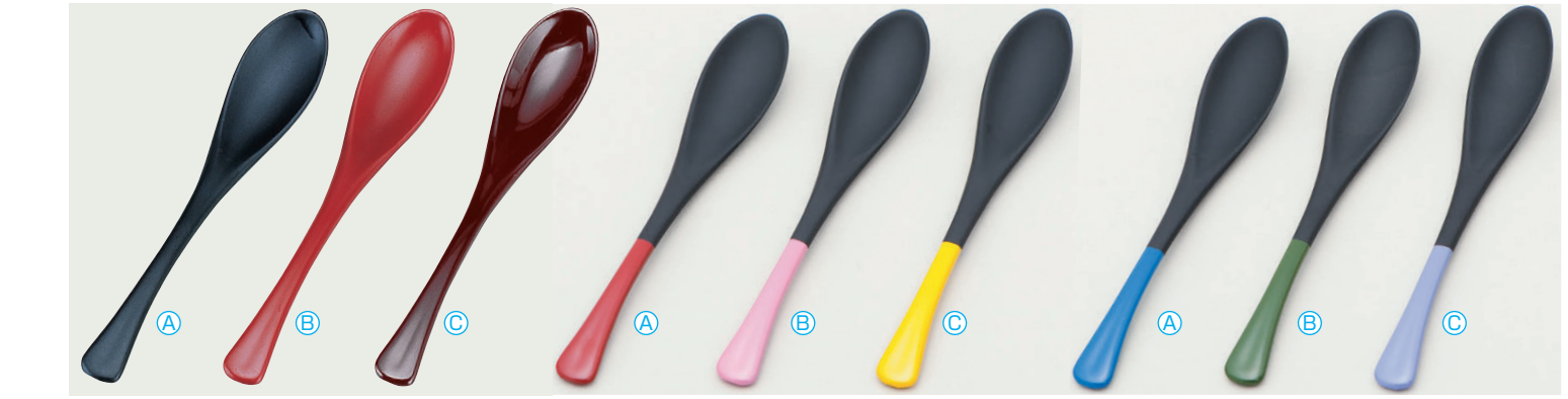
8-1081-2 [A] かゆスプーン (19.5×3.4) 梱500 A H-9-32 つや消黒 ¥550 B H-9-33 つや消朱 ¥550 C H-9-34 新溜 ¥550