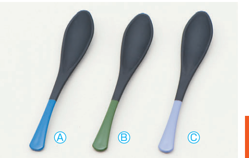
8-1082-8 (小) かゆスプーン (16×2.8) 梱500 A H-60-34 黒/青 ¥580 B H-60-35 黒/グリーン ¥580 C H-60-36 黒/紫 ¥580