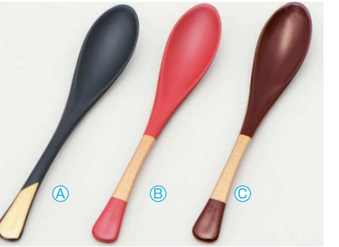
8-1082-3 [PBT] かゆスプーン (19.5×3.4) 梱500 A H-60-22 黒に柄金 ¥900 B H-60-23 朱/ゴールド塗分け ¥1,100 C H-60-24 新溜/ゴールド塗分け ¥1,100