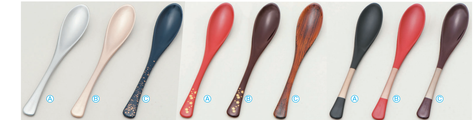
8-1081-8 [TA] かゆスプーン (19.5×3.4) 梱500 A H-60-7 銀塗 ¥800 B H-60-8 シャンパンゴールド ¥800 C H-60-9 紺金たたき ¥750