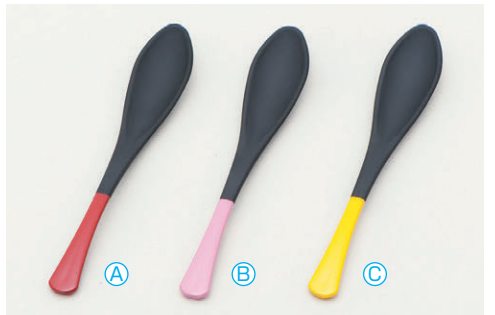
8-1082-7 (小) かゆスプーン (16×2.8) 梱500 A H-60-31 黒/赤 ¥580 B H-60-32 黒/ピンク ¥580 C H-60-33 黒/黄 ¥580