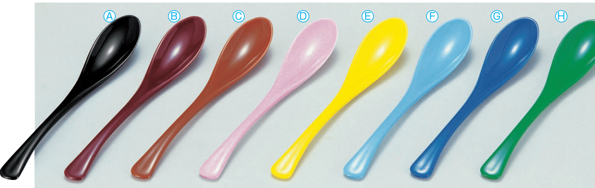
8-1081-1 [AC] かゆスプーン (19.5×3.4) 梱500 A 1-772-30 黒 ¥240 B 1-772-31 朱 ¥240 C 1-772-33 オレンジ ¥300 D 1-772-34 ピンク ¥300 E 1-772-35 イエロー ¥300 F 1-772-36 スカイブルー ¥300 G 1-772-37 ブルー ¥300 H 1-772-38 グリーン ¥300