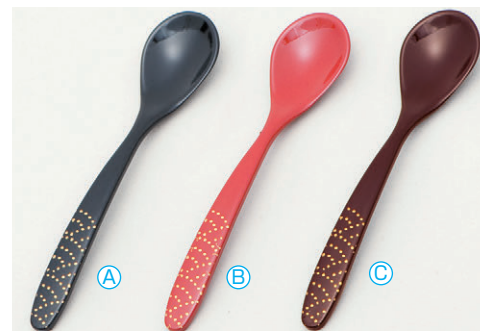
8-1080-7 A 新スプーン (13.6×3) 梱500 A H-59-79 黒に金波 ¥680 B H-59-80 朱に金波 ¥680 C H-59-81 新溜に金波 ¥680