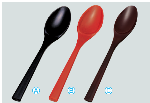
8-1079-3 AC デザートスプーン (11×2) 梱1000 A 1-772-5 黒 ¥250 B 1-772-6 朱 ¥250 C H-59-56 溜塗 ¥410