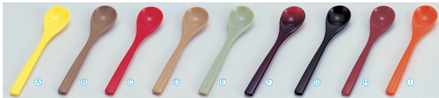
8-1079-6 茶碗蒸しスプーン (13.1×2.7) 梱1000 A 1-772-39 A イエロー ¥185 B 1-772-40 A グレー ¥185 C 1-772-41 A 赤 ¥130