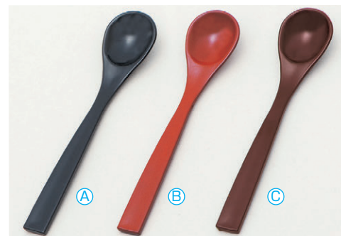
8-1080-1 A 新茶碗蒸しスプーン (13.1×2.7) 梱1000 A H-59-64 黒塗 ¥310 B H-59-65 朱塗 ¥310 C H-59-66 新溜 ¥310