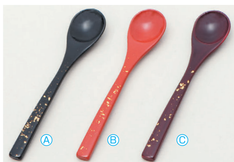
8-1079-9 A 茶碗蒸しスプーン (13.1×2.7) 梱1000 A H-59-61 黒色紙金箔 ¥650 B H-59-62 朱色紙金箔 ¥650 C H-59-63 溜色紙金箔 ¥670