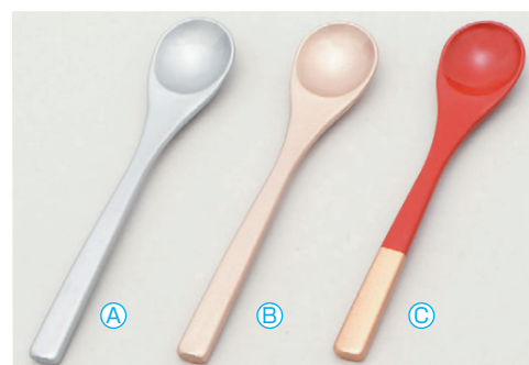
8-1079-8 A 茶碗蒸しスプーン (13.1×2.7) 梱1000 A H-59-58 銀塗 ¥400 B H-59-59 シャンパンゴールド ¥400 C H-59-60 朱/金塗分け ¥480