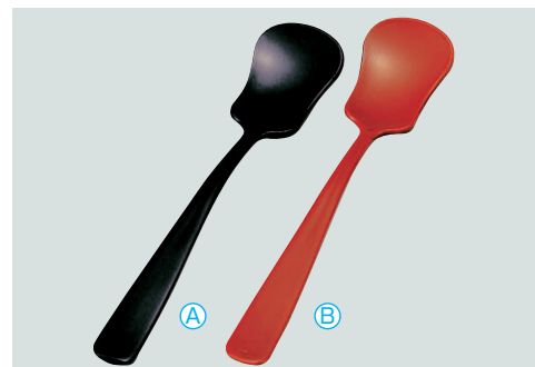
8-1079-5 AC アイスクリームスプーン (13.7×2.9) 梱1000 A 1-772-17 黒 ¥270 B 1-772-18 朱 ¥270