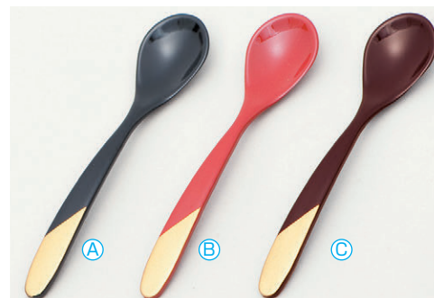
8-1080-8 A 新スプーン (13.6×3) 梱500 A H-59-82 黒に柄金 ¥680 B H-59-83 朱に柄金 ¥680 C H-59-84 新溜に柄金 ¥680