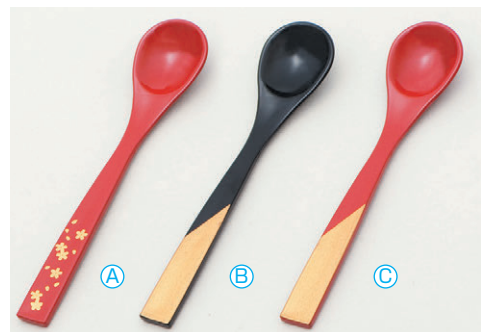
8-1080-3 A 新茶碗蒸しスプーン (13.1×2.7) 梱1000 A H-59-70 朱に金桜 ¥620 B H-59-71 黒に柄金 ¥620 C H-59-72 朱に柄金 ¥620