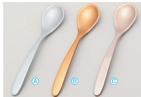
8-1080-5 A 新スプーン (13.6×3) 梱500 A H-59-73 銀塗 ¥470 B H-59-74 金塗 ¥470 C H-59-75 シャンパンゴールド ¥470