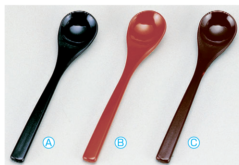
8-1079-7 A 茶碗蒸しスプーン (13.1×2.7) 梱1000 A 1-772-13 黒塗 ¥310 B 1-772-14 朱塗 ¥310 C H-9-37 溜塗 ¥325