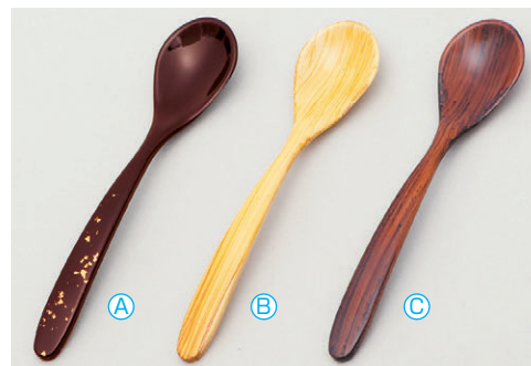
8-1080-9 A 新スプーン (13.6×3) 梱500 A H-59-85 新溜色紙金箔 ¥750 B H-59-86 白木 ¥860 C H-59-87 紫檀木目 ¥900