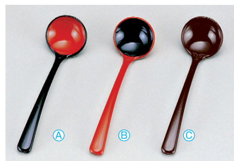
8-1080-10 A シュガースプーン (11×3) 梱1000 A 1-772-11 黒内朱 ¥450 B 1-772-12 朱内黒 ¥450 C H-9-36 新溜 ¥450