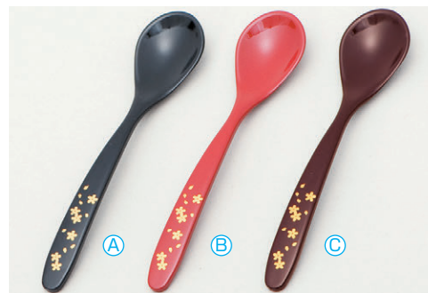
8-1080-6 A 新スプーン (13.6×3) 梱500 A H-59-76 黒に金桜 ¥680 B H-59-77 朱に金桜 ¥680 C H-59-78 新溜に金桜 ¥680