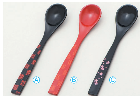
8-1080-2 A 新茶碗蒸しスプーン (13.1×2.7) 梱1000 A H-59-67 黒に布目市松 ¥450 B H-59-68 朱に布目市松 ¥450 C H-59-69 黒に桜 ¥450