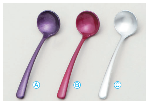
8-1080-11 A シュガースプーン (11×3) 梱1000 A H-59-88 紫パール ¥500 B H-59-89 ワインパール ¥500 C H-59-90 銀塗 ¥550