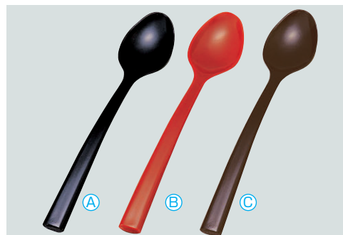
8-1079-4 AC コーヒースプーン (13.4×2.4) 梱1000 A 1-772-7 黒 ¥280 B 1-772-8 朱 ¥280 C H-59-57 溜塗 ¥430