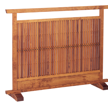
8-986-10 梅材 千本格子ケヤキ 直送 1-904-4 ¥60,000 (W120×D28×H90)