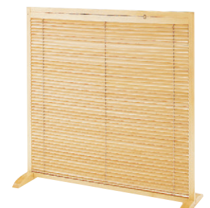
8-985-10 A-10-90B 木衝立 直送 ナチュラル ¥24,600 (W120×D40×H119) 天然木塗装