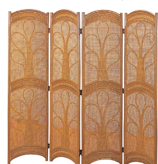
8-985-7 籐スクリーン4連 直送 A-10-88A G-150 ¥38,600 1枚あたり(40×H150) A-10-88B G-175 ¥43,600 1枚あたり(40×H175) ダークブラウン