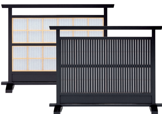
8-986-9 梅材 千本格子黒 直送 1-904-3 ¥60,000 (W120×D28×H90)