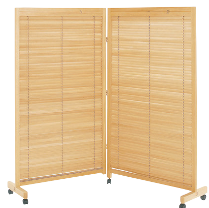
8-985-11 A-10-91B 木衝立2連 直送 ナチュラル ¥36,200 (W175×D37×H155) 天然木塗装