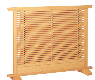
8-986-8 梅材 上高地白木スタイル型 直送 1-904-9 ¥68,000 (W120×D28×H90)