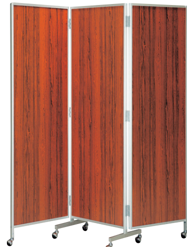
8-986-13 三ツ折衝立 ローズ 直送 A-2-93 低型 ¥115,000 (W180×D40×H172) A-2-94 高型 ¥130,000 (W180×D40×H200)