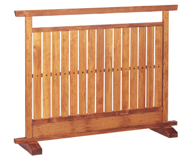
8-986-3 梅材 様名ケヤキ 直送 1-904-7 ¥67,000 (W120×D28×H90)