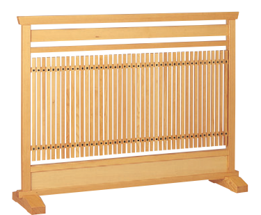
8-986-4 梅材 谷川白木 直送 1-904-8 ¥70,000 (W120×D28×H90)