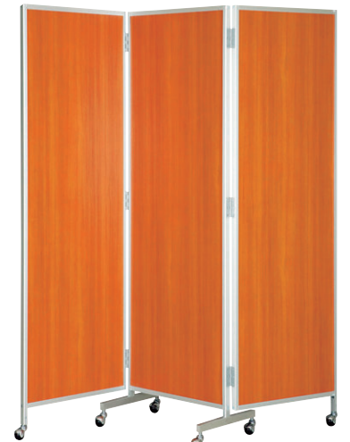
8-986-14 三ツ折衝立 チーク 直送 A-2-95 低型 ¥115,000 (W180×D40×H172) A-2-96 高型 ¥130,000 (W180×D40×H200)

直送商品はメーカーから直送のため、運賃は別途請求になります。 ※この頁の商品は、掛率が異なりますのでご注意ください。