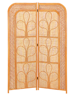
8-985-2 籐スクリーン 直送 A-10-83A B-140 ¥26,200 1枚あたり(60×H140) A-10-83B B-170 ¥29,900 1枚あたり(60×H170)