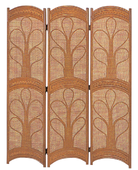
8-985-6 籐スクリーン3連 直送 A-10-87A F-150 ¥29,900 1枚あたり(40×H150)