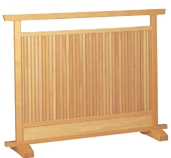
8-986-5 梅材 大山白木 直送 1-905-2 ¥60,000 (W120×D28×H90)