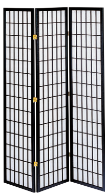
8-985-13 A-10-92B 木和風衝立3連ハイ 直送 ¥19,800 1枚あたり(45×2×H180)