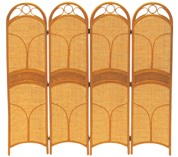
8-985-4 A-10-85 籐スクリーン4連 D-150 直送 ¥37,300 1枚あたり(40×H150)