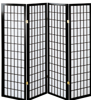
8-985-14 A-10-93A 木和風衝立4連 直送 ¥20,500 1枚あたり(45×2×H150)