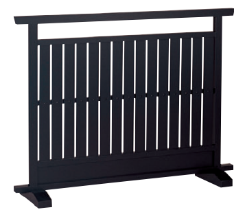
8-986-2 梅材 様名黒 直送 1-904-6 ¥67,000 (W120×D28×H90)