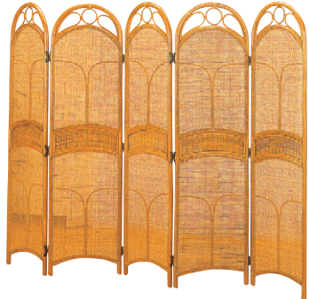
8-985-5 A-10-86 籐スクリーン5連 E-150 直送 ¥46,000 1枚あたり(40×H150)