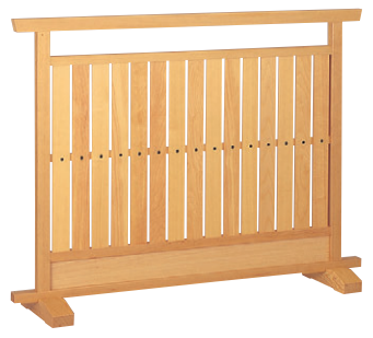
8-986-1 梅材 様名白木 直送 1-904-5 ¥67,000 (W120×D28×H90)