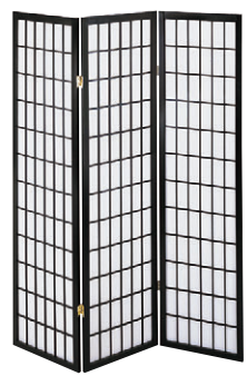
8-985-12 A-10-92A 木和風衝立3連 直送 ¥16,000 1枚あたり(45×2×H150)