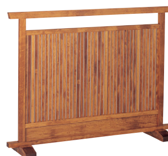
8-986-6 梅材 大山ケヤキ 直送 1-905-3 ¥60,000 (W120×D28×H90)