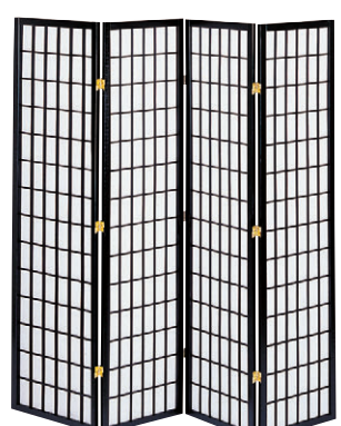
8-985-15 A-10-93B 木和風衝立4連ハイ 直送 ¥24,500 1枚あたり(45×2×H180)