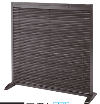
8-985-8 木衝立 直送 A-10-90A ブラウン ¥24,600 (W120×D40×H119) 天然木塗装