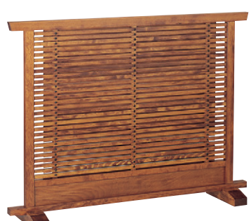
8-986-7 梅材 上高地ケヤキ 直送 1-905-6 ¥68,000 (W120×D28×H90)