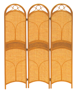
8-985-3 A-10-84 籐スクリーン3連 C-150 直送 ¥28,600 1枚あたり(40×H150)