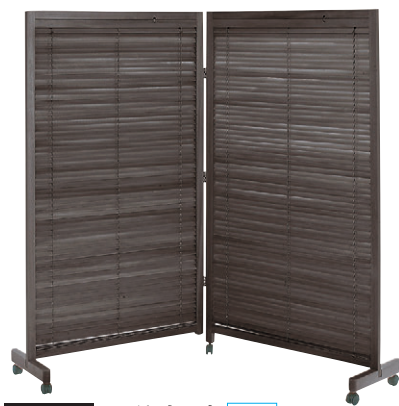
8-985-9 木衝立2連 直送 A-10-91A ブラウン ¥36,200 (W175×D37×H155) 天然木塗装