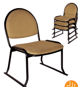
8-977-1 A-8-18 SP お寺用イス SZ 直送 ¥18,000 (46×42×H62×SH30) 座:ウレタンフォーム 上張り:布張り フレーム:スチール(塗装)