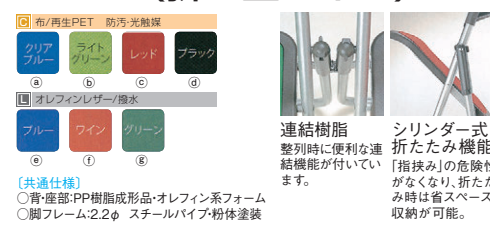
8-978-6 F-930C(布)スチール脚 直送 A-11-14 ¥17,000 (51×46×H75×SH43) 梱5 F-930L(レザー)スチール脚 直送 A-11-15 ¥17,000 (51×46×H75×SH43) 梱5