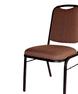
8-977-5 A-8-21 AL レセプションチェア KL 直送 ¥30,000 (47×52×H83×SH44) 黒塗装、ウレタンフォーム