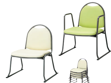
8-977-7 H-35-79 SP SCS-1190・AL ホワイト 直送 ¥20,500 (51.5×53.5×H62×SH31) ビニールレザー、スチール・グレー粉体塗装