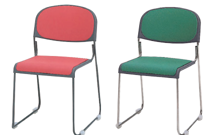
8-978-11 H-35-81 SP SCM-AL-W 直送 ¥19,700 (48.5×53×H76×SH43.5) レザー・ワイン、粉体塗装脚