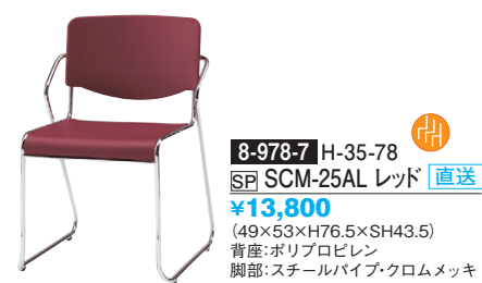
8-978-7 H-35-78 SP SCM-25AL レッド 直送 ¥13,800 (49×53×H76.5×SH43.5) 背座:ポリプロピレン 脚部:スチールパイプ・クロームメッキ