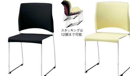
8-978-4 H-35-71 SP SCM-29 ブラック 直送 ¥15,400 (52×47×H82.5×SH43.5) 背座:PP樹脂、スチールロッド・クロームメッキ