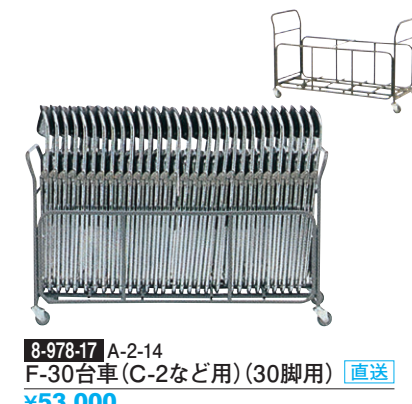
8-978-17 A-2-14 F-30台車(C-2など用) (30脚用) 直送 ¥53,000 (148×55×H83) 7.5φキャスター、スチールパイプ塗装 組立必要