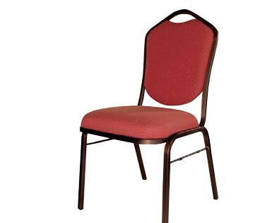
8-977-3 A-8-19 AL ブロンズチェア HI 直送 ¥33,000 (47×54×H89×SH45) アルマイト、ウレタンフォーム