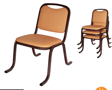
8-977-2 A-8-17 AL お寺用イス AZ 直送 ¥22,500 (41×58×H59×SH32) 座:ウレタンフォーム 上張り:ビニールレザー フレーム:アルミ(塗装)