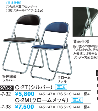
8-978-2 C-2T(シルバー) 直送 A-7-32 ¥5,800 (45×47×H76.5×SH44) 梱4 C-2M(クロームメッキ) 直送 A-7-33 ¥7,500 (45×47×H76.5×SH44) 梱4