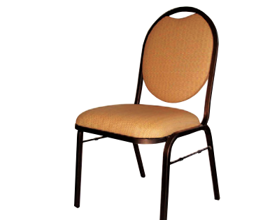
8-977-4 A-8-20 AL ブロンズチェア HT 直送 ¥33,000 (47×53×H86×SH45) アルマイト、ウレタンフォーム