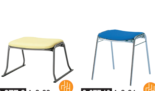
8-977-9 A-8-23 SP SCS-1190-ST クリームイエロー 直送 ¥16,600 (51.5×46.5×H31) ビニールレザー 脚部:1.9φスチール・グレー粉体塗装