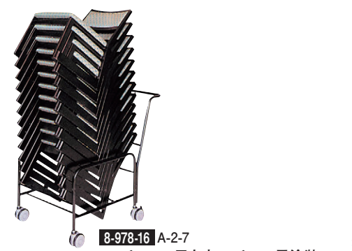
8-978-16 A-2-7 SP チェア用台車 スチール黒塗装 (10~12脚搭載) 直送 ¥99,800 (60×90×90) 梱4