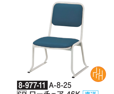
8-977-11 A-8-25 SP ローチェア 46K 直送 ¥21,800 (46.5×52×H62×SH30) 合成皮革、スチール脚