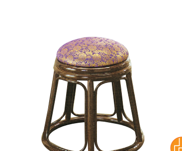
8-977-12 籐 籐スツール 74B 直送 A-8-27 ¥16,400 (上 32φ×下 44φ×H43) ※クッション取り外し不可