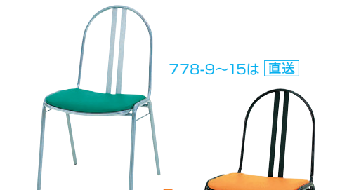
8-978-9 A-10-49 SP スチールチェア S-11 直送 ¥17,200 (46×55×H81×SH44) スチール脚・粉体塗装、ビニールレザー