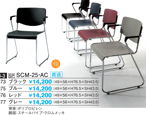
8-978-3 SP SCM-25-AC 直送 H-35-73 ブラック ¥14,200 (49×56×H76.5×SH43.5) H-35-75 ブルー ¥14,200 (49×56×H76.5×SH43.5) H-35-76 レッド ¥14,200 (49×56×H76.5×SH43.5) H-35-77 グレー ¥14,200 (49×56×H76.5×SH43.5) 背座:ポリプロピレン 脚部:スチールパイプ・クロームメッキ