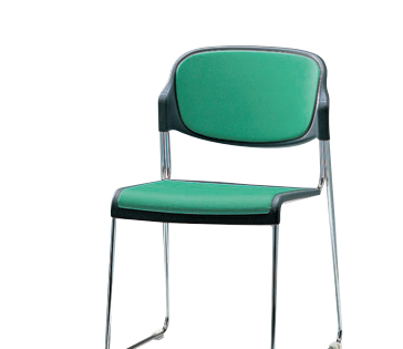
8-977-6 A-8-22 AL ミーティングチェア CM 直送 ¥21,800 (52×54×H77×SH43) スチール脚、ポリオレフィンクロス