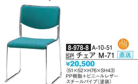
8-978-8 A-10-51 SP チェア M-71 直送 ¥20,500 (51×52×H76×SH43) PP樹脂+ビニールレザー スチールパイプ(塗装)