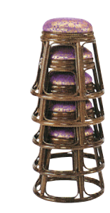
仏事など法事行事 におすすめ!