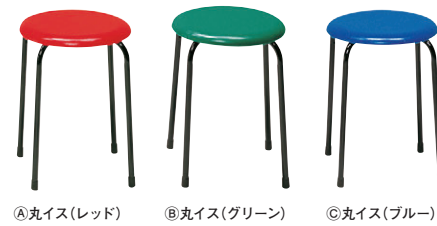
8-978-1 丸イス 直送 A-7-30A ①レッド ¥3,100 (33×33×H43) A-7-30B ②グリーン ¥3,100 (33×33×H43) A-7-30C ③ブルー ¥3,100 (33×33×H43) 合成皮革、スチール脚