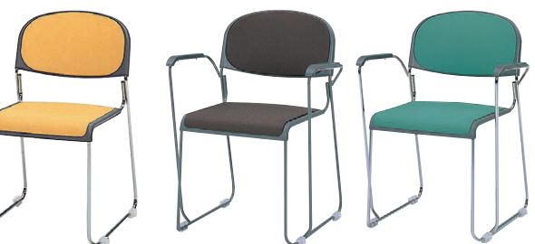
8-978-12 H-35-82 SP SCM-AL-G 直送 ¥21,200 (48.5×53×H76×SH43.5) レザー・グリーン、メッキ脚