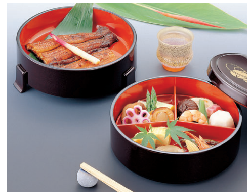
三ツ足弁当 8-917-19 1-437-9 A 三ツ足弁当用仕切 朱塗 ¥500 (16.6φ×2.8) 楕100