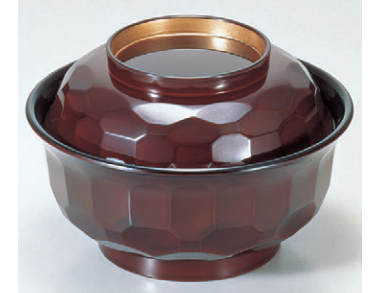
8-918-7 TA 真亀甲井 溜つば金 1-215-6 ¥2,700 (15.8φ×10.4) 楕50