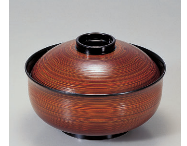
8-918-6 TA 5寸リリー椀 春慶刷毛目 1-202-10 ¥3,050 (14.8φ×9.6) 楕100