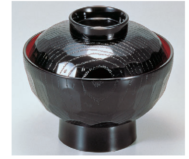
8-918-11 A (大) 亀甲井 黒内朱 1-219-11 ¥1,400 (15.6φ×13.8) 楕50