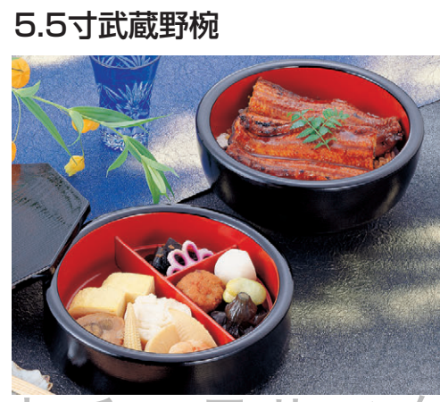
5.5寸武蔵野椀 8-917-16 A 5.5寸武蔵野椀 黒刷毛目内朱塗 1-543-19 蓋 ¥1,150 (17.7×17.7×2.2) 楕100 1-439-8 中段 ¥2,000 (16.7φ×4.7) 楕60 1-543-4 下段 ¥2,300 (16.6φ×7.3) 楕60 2段(仕切別) ¥5,450 (17.7φ×13) 楕18