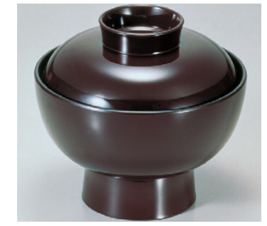
8-918-16 A 高仙上井 うるみ 1-218-2 ¥1,950 (15.3φ×14.5) 楕50