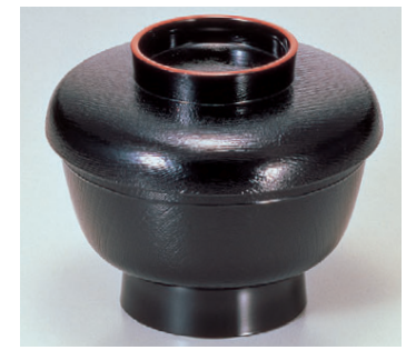
8-918-9 A 高台かぶせ木目椀 黒天朱内朱 1-216-5 ¥1,900 (15.2φ×12.5) 楕60