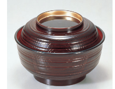
8-918-4 TA 5寸乱筋井 溜内朱つば金 1-215-3 ¥2,500 (15φ×10.3) 楕50