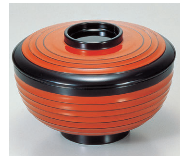
8-918-10 A (大) 駒筋カン目椀 朱筋目 1-216-4 ¥2,750 (16.4φ×10.5) 楕60