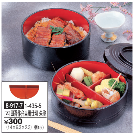
8-917-7 1-435-5 A 田吾作弁当用仕切 朱塗 ¥300 (14×6.3×2.3) 楕150