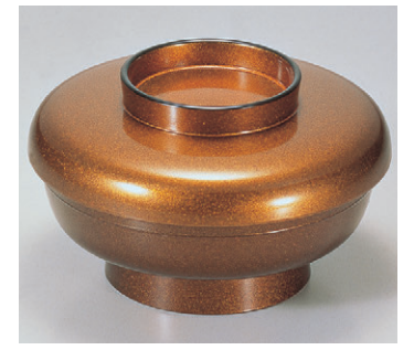
8-918-18 A かぶせ井 梨地内朱 1-218-5 ¥2,200 (17.5φ×10.5) 楕50