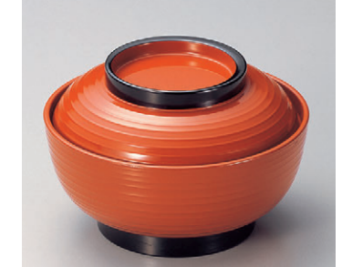
8-918-5 TA 5寸乱引三日井 朱内朱つば黒 W-3-75 ¥3,150 (15φ×9.9) 楕60