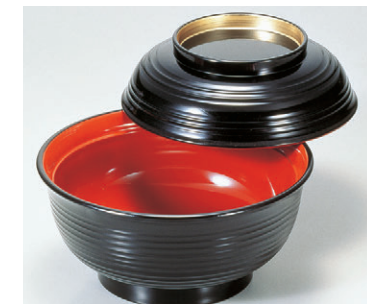
8-918-1 TA 美里千筋井 黒内朱つば金 1-214-1 ¥2,900 (15.8φ×10.4) 楕50