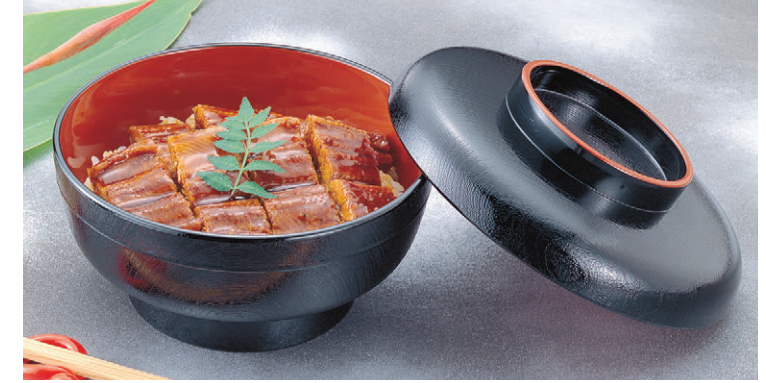
8-918-8 A かぶせ木目椀 黒天朱内朱 1-216-7 ¥2,100 (17.4φ×10.6) 楕60