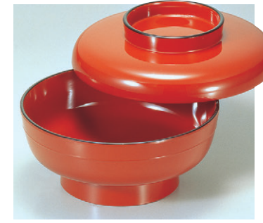
8-918-17 A かぶせ井 朱内朱 1-218-4 ¥1,850 (17.5φ×10.5) 楕50