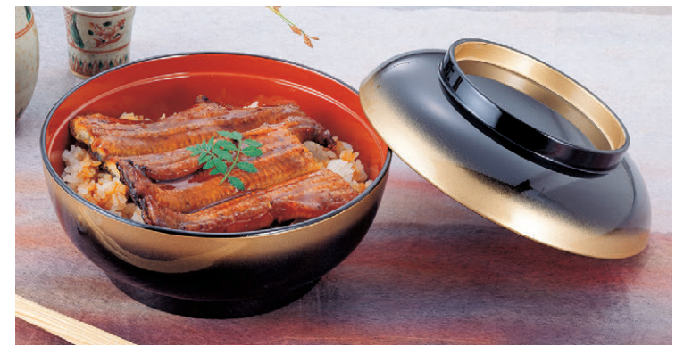
8-918-3 TA 5寸平煮物椀 黒金かすみつば金内朱 1-212-3 ¥2,650 (16.3φ×9.2) 楕60