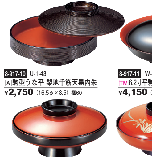
8-917-10 U-1-43 A 駒型うなぎ平 梨地千筋天黒内朱 ¥2,750 (16.5φ×8.5) 楕60 8-917-11 W-7-5 TM 6.2寸平駒煮物椀 黒内朱つば内金 ¥4,150 (18.8φ×8) 楕60 8-917-12 1-204-1 A 5.5寸風味椀 黒内朱つば天金 ¥1,800 (16.4φ×9) 楕60