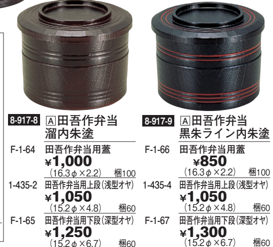
田吾作弁当 8-917-8 A 田吾作弁当 溜内朱塗 F-1-64 田吾作弁当用蓋 ¥1,000 (16.3φ×2.2) 楕100 1-435-2 田吾作弁当用上段(浅型オヤ) ¥1,050 (15.2φ×4.8) 楕60 F-1-65 田吾作弁当用下段(深型オヤ) ¥1,250 (15.2φ×6.7) 楕60 8-917-9 A 田吾作弁当 黒朱ライン内朱塗 F-1-66 田吾作弁当用蓋 ¥850 (16.3φ×2.2) 楕100 1-435-4 田吾作弁当用上段(浅型オヤ) ¥1,050 (15.2φ×4.8) 楕60 F-1-67 田吾作弁当用下段(深型オヤ) ¥1,300 (15.2φ×6.7) 楕60