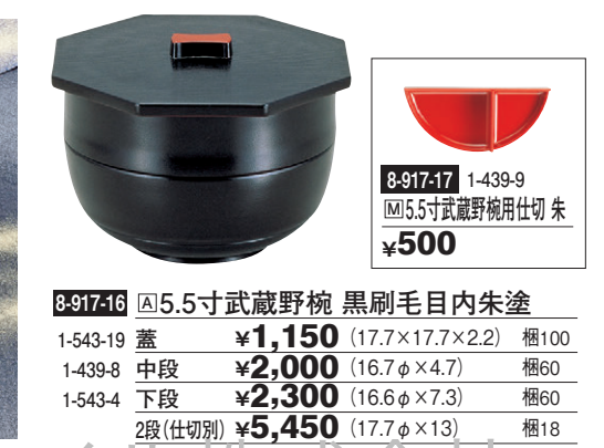
8-917-17 1-439-9 M 5.5寸武蔵野椀用仕切 朱 ¥500