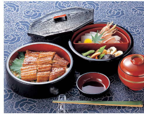
8-917-4 A 6寸ふる里弁当 黒刷毛目内朱塗 1-543-20 6寸ふる里弁当用蓋 黒木目天朱 ¥1,300 (19.5×19.5×2.2) 楕80 1-437-4 6寸ふる里弁当用本体 黒刷毛目内朱1ヶ ¥1,200 (18φ×5.5) 楕60