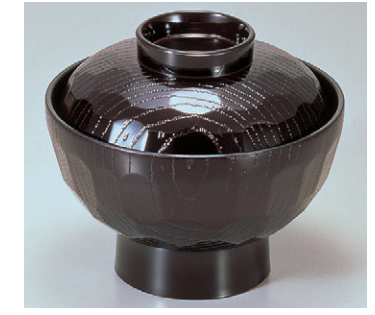
8-918-12 A (大) 亀甲井 溜 1-219-12 ¥1,600 (15.6φ×13.8) 楕50