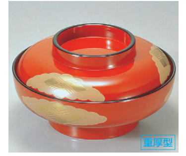
8-918-14 A 6寸大平煮物椀 白正方寺内朱 1-212-9 ¥2,800 (18.1φ×9.5) 楕60