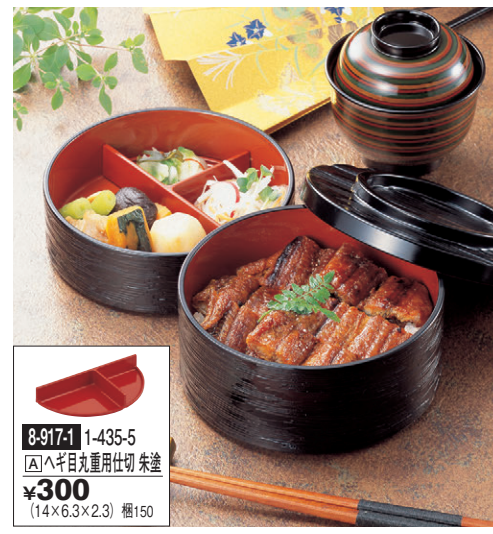
8-917-1 1-435-5 A 5.5寸ヘギ目丸重用仕切 朱塗 ¥300 (14×6.3×2.3) 楕150