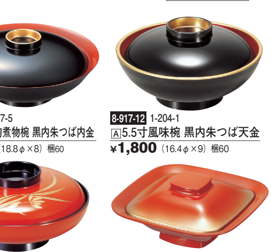
8-917-13 W-7-4 M 5.5寸駒型煮物椀 朱測黒 ¥2,800 (16φ×8.2) 楕60 8-917-14 1-204-3 M 5.5寸駒型煮物椀 ラン ¥3,050 (16.7φ×8.3) 楕60 8-917-15 1-209-1 M 7寸角煮物椀 朱金ぼかし内朱 ¥3,750 (20.7×20.7×9.2) 楕40