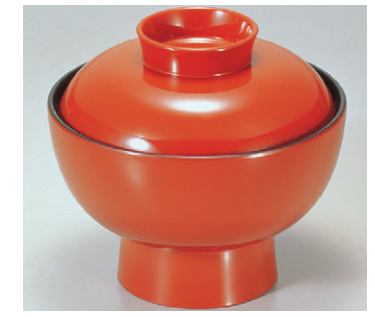
8-918-15 A 高仙上井 朱 1-218-1 ¥1,850 (15.3φ×14.5) 楕50