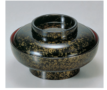
8-918-13 M 5.5寸大平椀 金津輕内朱 1-212-4 ¥2,500 (16.6φ×9.6) 楕60