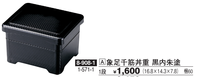
8-908-1 [A]象足千筋井重 黒内朱塗 1-571-1 1段 ¥1,600 (16.8×14.3×7.8) 幅60 2段 ¥2,450 (16.8×14.3×11.3) 幅30 1-571-1A 中段のみ ¥850 (15.4×13×4)