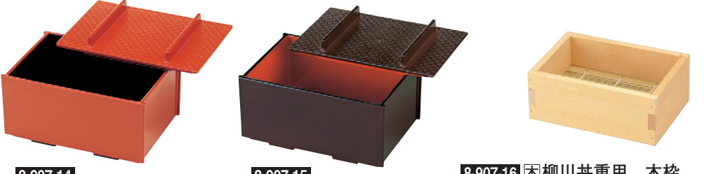
8-907-14 [TA]耐熱柳川井重(底板付) 朱内黒塗 1-565-1 身 ¥3,250 1-565-1A 蓋 ¥1,850 (19×13.2×10.8) 幅40 8-907-15 [TA]耐熱柳川井重(底板付) 溜内朱塗 1-565-2 身 ¥3,950 1-565-2A 蓋 ¥2,250 (19×13.2×10.8) 幅40 8-907-16 困柳川井重用 木枠 1-565-3 ¥2,300 (17×11.9×6.8) (内寸14.8×9.7×4.5) 8-907-17 笹竹ス 1-526-2A ¥700 (14.5×9.4)