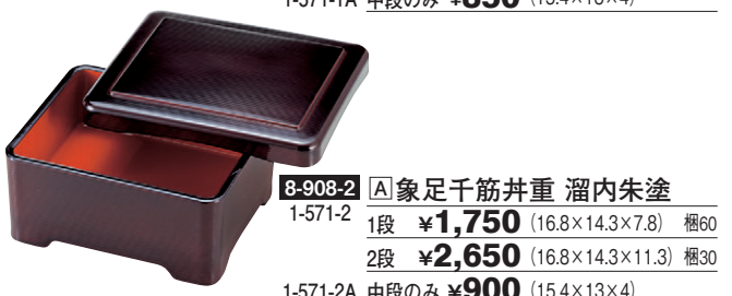
8-908-2 [A]象足千筋井重 溜内朱塗 1-571-2 1段 ¥1,750 (16.8×14.3×7.8) 幅60 2段 ¥2,650 (16.8×14.3×11.3) 幅30 1-571-2A 中段のみ ¥900 (15.4×13×4)