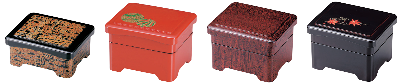
8-908-8 [A]若丸井重 銀格子内朱塗 U-1-51 ¥3,450 (16.6×14.2×7.5) 幅60 8-908-9 [A]若丸井重 古代ままり内朱塗 U-1-48 1段 ¥2,000 (16.6×14.2×7.5) 幅60 2段 ¥2,850 (16.6×14.2×11.3) 幅30 U-1-48A 中段のみ ¥850 (15.4×13×4) 8-908-10 [A]若丸井重 溜刷毛目内朱塗 U-1-47 1段 ¥2,750 (16.6×14.2×7.5) 幅60 2段 ¥3,750 (16.6×14.2×11.3) 幅30 U-1-47A 中段のみ ¥1,000 (15.4×13×4) 8-908-11 [A]若丸井重 溜春秋内朱塗 U-1-49 1段 ¥2,300 (16.6×14.2×7.5) 幅60 2段 ¥3,250 (16.6×14.2×11.3) 幅30 U-1-49A 中段のみ ¥950 (15.4×13×4)