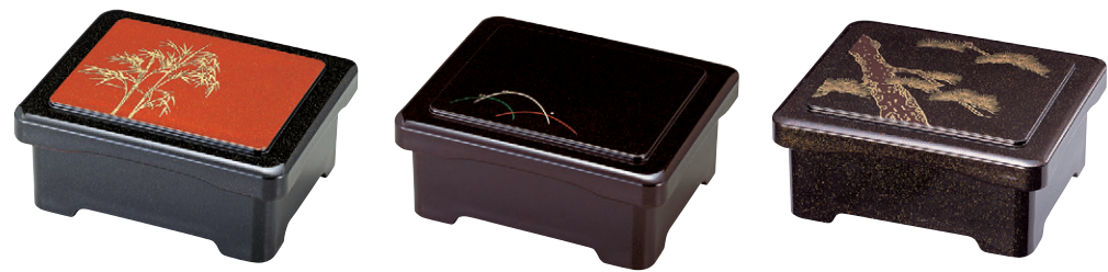
8-907-11 [TA]耐熱錦井重 1-564-4 朱パール若竹内朱塗 ¥3,600 (18.1×15.2×8.3) 幅50 8-907-12 [TA]耐熱錦井重 1-564-5 溜パール露草内朱塗 ¥3,700 (18.1×15.2×8.3) 幅50 8-907-13 [TA]耐熱錦井重 U-1-16 梨地二色松内朱塗 ¥3,800 (18.1×15.2×8.3) 幅50