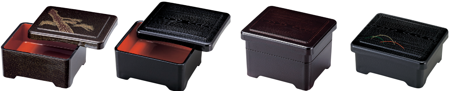
8-908-3 [A]象足千筋井重 U-1-17 梨地二色松内朱塗 ¥1,950 (16.8×14.3×7.8) 幅60 8-908-4 [TA]耐熱井重 新木目黒内朱塗 1-571-4 1段 ¥1,750 (16.8×14.3×7.8) 幅60 2段 ¥2,800 (16.8×14.3×11.3) 幅30 1-571-4A 中段のみ ¥1,050 (15.4×13×4) 8-908-5 [TA]耐熱井重 新木目溜内朱塗 1-571-5 1段 ¥1,850 (16.8×14.3×7.8) 幅60 2段 ¥2,950 (16.8×14.3×11.3) 幅30 1-571-5A 中段のみ ¥1,100 (15.4×13×4) 8-908-6 [TA]耐熱井重 新木目露草内朱塗 1-571-6 1段 ¥2,400 (16.8×14.3×7.8) 幅60 2段 ¥3,450 (16.8×14.3×11.3) 幅30 1-571-6A 中段のみ ¥1,050 (15.4×13×4)