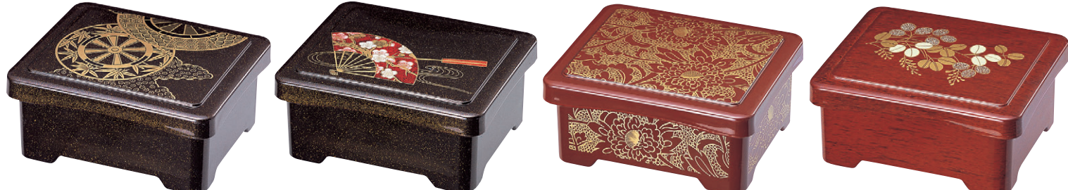
8-907-7 [TA]耐熱象足井重 U-1-12 梨地御所車内朱塗 ¥2,400 (16.8×14.3×7.6) 幅60 8-907-8 [TA]耐熱象足井重 U-1-13 梨地新扇面内朱塗 ¥2,600 (16.8×14.3×7.6) 幅60 8-907-9 [TA]耐熱象足井重 U-1-14 うるみ金牡丹内朱塗(親・柄入) ¥2,750 (16.8×14.3×7.6) 幅60 8-907-10 [TA]耐熱象足井重 U-1-15 後藤塗秋内朱塗 ¥3,200 (16.8×14.3×7.6) 幅60