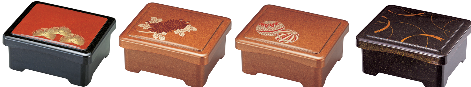
8-907-3 [TA]耐熱象足井重 1-564-1 朱パール若松内朱塗 ¥2,350 (16.8×14.3×7.6) 幅60 8-907-4 [TA]耐熱象足井重 1-564-2 梨地菊内朱塗 ¥2,400 (16.8×14.3×7.6) 幅60 8-907-5 [TA]耐熱象足井重 1-564-3 梨地まり内朱塗 ¥2,400 (16.8×14.3×7.6) 幅60 8-907-6 [TA]耐熱象足井重 U-1-11 黒梨地のし柄内朱塗 ¥2,350 (16.8×14.3×7.6) 幅60