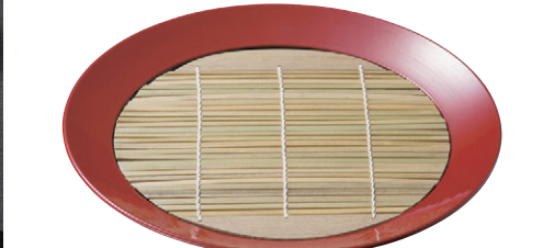
8-864-5 段付丸そば皿(大) 黒測朱 S-10-5 A 本体 ¥1,750 (25.5φ×3.8) 幅60 1-536-1B 竹竹ス(19.5φ)1枚 ¥380 (19.5φ) S-10-50 P.P.P.測付クリーム竹ス 19.6φ丸 ¥400 (19.6φ)