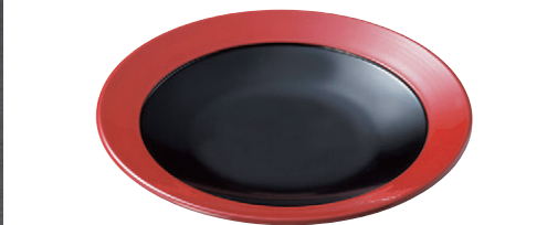
8-864-3 段付丸そば皿(小) 黒測朱 S-10-4 A 本体 ¥1,500 (21.7φ×2.9) 幅80 S-10-30 竹竹ス(16.5φ)1枚 ¥650 (16.5φ) S-10-19 P.P.P.測付クリーム竹ス 16.5φ丸 ¥400 (16.5φ)