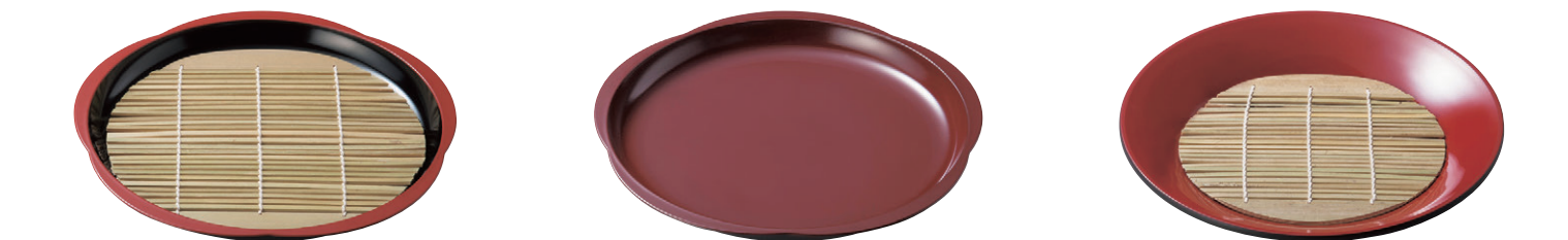
8-863-7 梅型そば皿 黒測朱 S-9-99 A 本体 ¥850 (23.3φ×2.3) 幅60 1-536-1B 竹竹ス(19.5φ)1枚 ¥380 (19.5φ) S-10-50 P.P.P.測付クリーム竹ス 19.6φ丸 ¥400 (19.6φ)