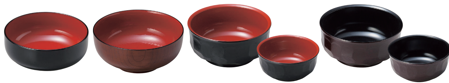
8-864-7 S-10-8 A 喜楽鉢 黒内朱 ¥1,100 (15.8φ×6.5) 幅80