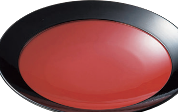
8-864-6 段付丸そば皿(大) 朱測黒 S-10-7 A 本体 ¥1,750 (25.5φ×3.8) 幅60 1-536-1B 竹竹ス(19.5φ)1枚 ¥380 (19.5φ) S-10-50 P.P.P.測付クリーム竹ス 19.6φ丸 ¥400 (19.6φ)