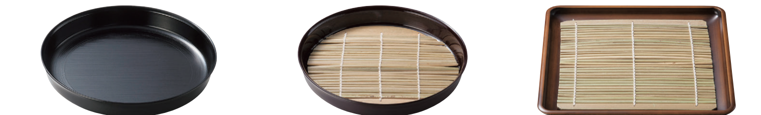
8-863-4 7寸刷毛目丸そば皿 総黒塗 S-9-97 A 本体 ¥1,000 (22φ×3.5) 幅80 1-536-1B 竹竹ス(19.5φ)1枚 ¥380 (19.5φ) S-10-50 P.P.P.測付クリーム竹ス 19.6φ丸 ¥400 (19.6φ)