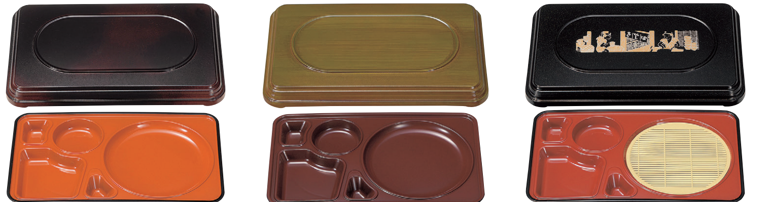
8-863-1 A 慶祥そば弁当 スス竹内柿朱 F-3-87 本体 ¥3,900 (32.2×20.3×5) 幅40