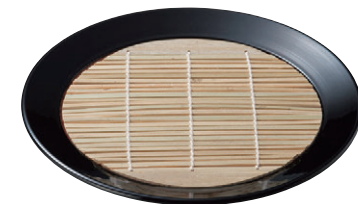
8-864-4 段付丸そば皿(小) 朱測黒 S-10-6 A 本体 ¥1,500 (21.7φ×2.9) 幅80 S-10-30 竹竹ス(16.5φ)1枚 ¥650 (16.5φ) S-10-19 P.P.P.測付クリーム竹ス 16.5φ丸 ¥400 (16.5φ)