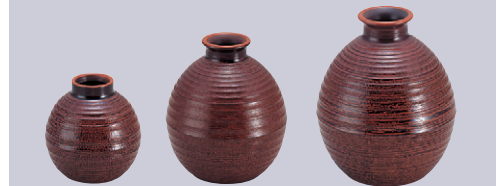
8-893-14 A新(大)角ゆとう 黒(重厚型)(700cc) S-9-30 ¥3,600(10.4×10.4×11.6) 梱40