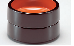
8-894-15 S-9-18 A/D.X4.5寸八重鉢 新溜内朱 1ヶ ¥900(13.4φ×4.3) 梱100