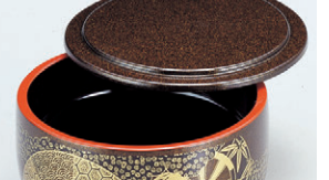
8-894-18 TA/D.X4寸タイコミニ桶 梨地御所車内黒塗 1-466-5 浅型本体 ¥850(11.7φ×5.8) 梱100 1-466-5A 蓋 ¥600(11.7φ×1.2) 梱150