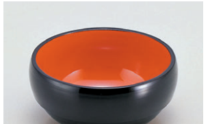
8-894-1 1-338-16 A3.3寸そばボール(段付) 黒内朱 ¥470(9.7φ×3.8) 梱200