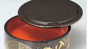
8-894-19 TA/D.X4寸タイコミニ桶 梨地御所車内朱 0-2-53 浅型本体 ¥850(11.7φ×5.8) 梱100 1-466-5A 蓋 ¥600(11.7φ×1.2) 梱150