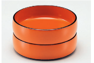
8-894-6 1-557-5 Aタイコ割子そば 朱天黒 1ヶ ¥600(13φ×3.5) 梱200