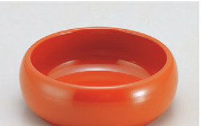
8-894-4 1-557-3 M太閤鉢 朱 ¥900(11φ×4) 梱100