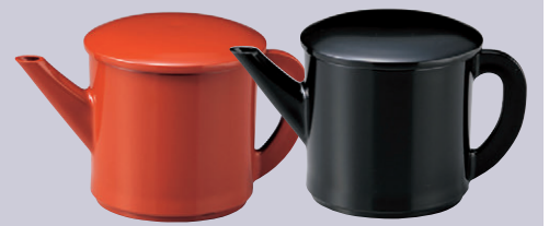
8-893-6 1-556-9 A(大)ゆとう 黒(500cc) ¥2,300(10.6φ×10.1) 梱80