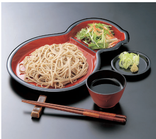
8-893-17 S-9-53 Mひさご仕切皿 朱天黒 ¥1,500(27.6×19.1×2.4) 梱80