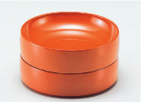
8-894-8 S-9-15 A一口そば 朱(内底丸) 1ヶ ¥680(12φ×3.3) 梱200