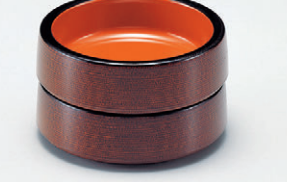
8-894-12 S-9-16 A/D.X4寸八重鉢 溜刷毛目内朱 1ヶ ¥850(11.4φ×3.6) 梱120