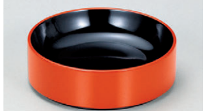
8-894-16 S-7-81 M/LM-52 割子そば(大) 朱内黒 ¥1,350(12φ×3.8) 梱100