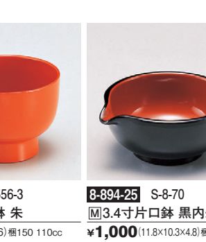
8-894-24 1-556-3 M(小)片口鉢 朱 ¥990(10×8×6) 梱150 110cc