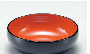
8-894-3 S-9-14 Aデリシャスボール 黒内朱 ¥700(13.2φ×4.5) 梱200