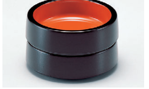
8-894-11 1-515-16 A/D.X4寸八重鉢 黒刷毛目内朱 1ヶ ¥850(11.4φ×3.6) 梱120