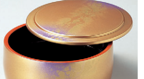
8-894-20 TA/D.X4寸タイコミニ桶 金王八雲内梨地 0-2-56 浅型本体 ¥1,250(11.7φ×5.8) 梱100 0-2-57 蓋 ¥900(11.7φ×1.2) 梱150