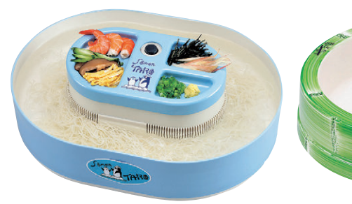
8-893-28 S-10-28 流しそめん太郎 ペンギン ¥12,400(実寸310×410×120・箱寸326×425×130) 梱12 単1乾電池2本使用(別売)。 家庭用流しそめん器。