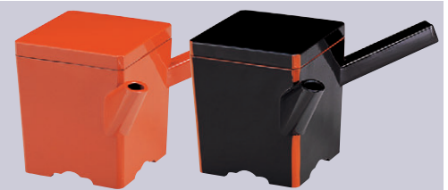
8-893-10 1-556-11 A(小)角ゆとう 黒朱(350cc) ¥3,400(9×9×10) 梱60