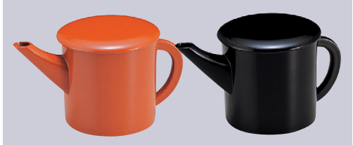
8-893-5 1-556-8 A(大)ゆとう 朱(500cc) ¥2,300(10.6φ×10.1) 梱80