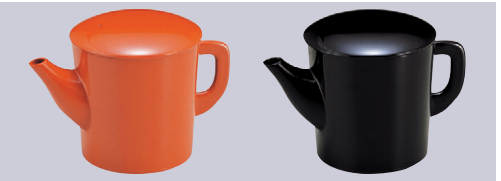
8-893-2 1-556-2 Aミニゆとう 黒朱(150cc) ¥1,430(7.5φ×8) 梱100