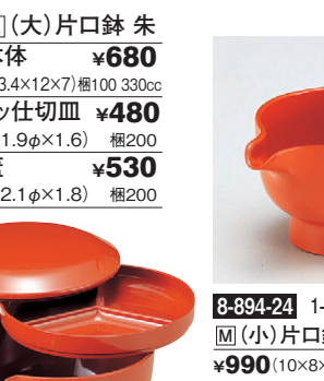
8-894-21 A(大)片口鉢 朱 1-556-4 本体 ¥680(13.4×12×7) 梱100 330cc 1-556-4A 3ツ仕切皿 ¥480(11.9φ×1.6) 梱200 1-556-4B 蓋 ¥530(12.1φ×1.8) 梱200