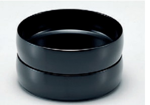
8-894-7 1-557-6 Aタイコ割子そば 黒 1ヶ ¥600(13φ×3.5) 梱200