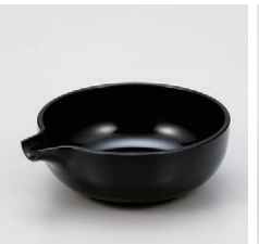
8-894-27 S-10-21 A4寸片口鉢 黒 ¥650(12.7×11.4×4.2) 梱00 210cc