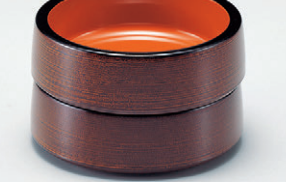
8-894-14 S-9-17 A/D.X4.5寸八重鉢 溜刷毛目内朱 1ヶ ¥900(13.4φ×4.3) 梱100