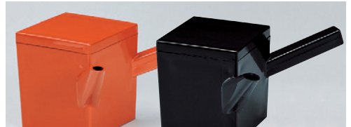
8-893-3 1-556-6 A(小)ゆとう 朱(300cc) ¥1,450(9φ×9.5) 梱100