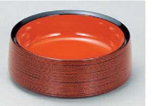
8-894-10 S-7-82 A/D.X5寸割子そば 溜刷毛目内朱 ¥980(15φ×5.4) 梱80