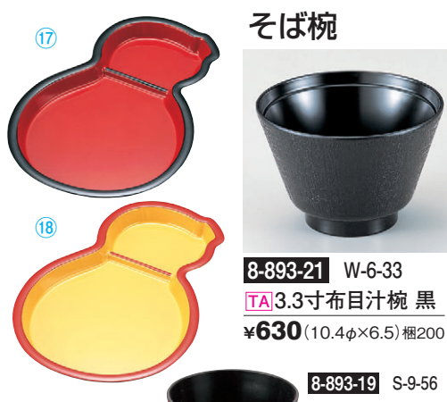
8-893-18 S-9-54 Mひさご仕切皿 クリーム天朱 ¥1,500(27.6×19.1×2.4) 梱80