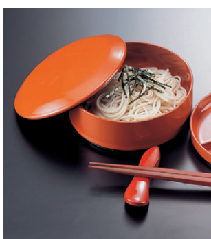
8-894-22 A割子そば 朱 1-557-8 本体 ¥580(11.8φ×4) 1-556-4A 3ツ仕切皿 ¥480(11.9φ×1.6) 1-556-4B 蓋 ¥530(12.1φ×1.8)