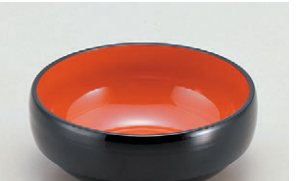
8-894-2 1-328-9 A4寸そばボール(段付) 黒内朱 ¥500(11.5φ×4.2) 梱200