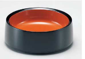
8-894-9 S-9-19 A/D.X5寸割子そば 黒刷毛目内朱 ¥930(15φ×5.4) 梱80