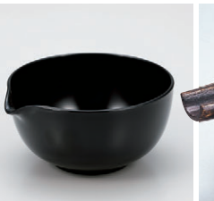
8-894-28 S-10-22 A4寸片口鉢 黒 ¥700(12.5×11.5×6) 梱100 310cc