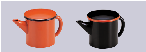
8-893-1 1-556-1 Aミニゆとう 朱黒(150cc) ¥1,430(7.5φ×8) 梱100