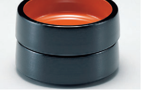
8-894-13 1-515-17 A/D.X4.5寸八重鉢 黒刷毛目内朱 1ヶ ¥900(13.4φ×4.3) 梱100