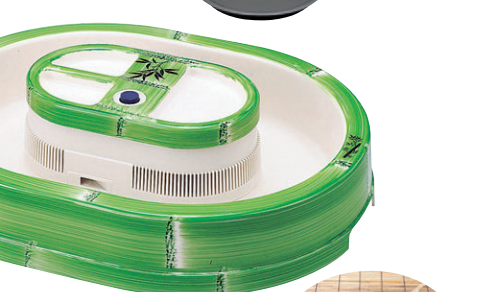
8-893-29 S-10-29 竹取流しそめん太郎 ¥14,250(実寸375×475×120・箱寸391×492×130) 梱12 単1乾電池2本使用(別売)。 家庭用流しそめん器。