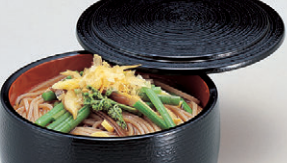
8-894-17 TA/D.X4寸タイコミニ桶 黒刷毛目内朱 1-466-2 浅型本体 ¥800(11.7φ×5.8) 梱100 1-466-2A 蓋 ¥600(11.7φ×1.2) 梱150