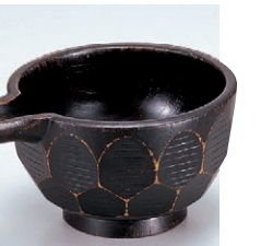
8-894-29 1-556-5 困片口鉢 黒木紋 限定品 ¥1,400(14×11×6.7) 梱150 210cc