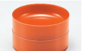
8-894-5 1-557-7 M割子そば 1ヶ ¥700(12φ×3.8) 梱150