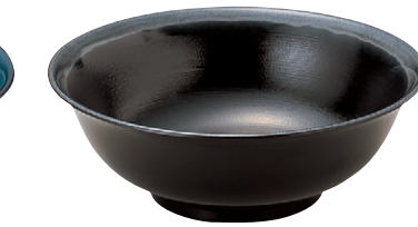
8-890-10 S-9-5 M羽反ラーメン丼(大) 黒刷毛目天目 ¥3,000 (21φ×7.5・1,200cc) 梱80