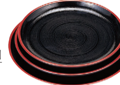
8-890-23 A丸盆 黒刷毛目天朱 フンスリップ加工 1-86-1 7.5寸 ¥1,300 (22.4φ×1.9) 梱80 1-86-2 8寸 ¥1,450 (24φ×1.9) 梱60 1-86-3 9寸 ¥1,700 (27φ×1.9) 梱60