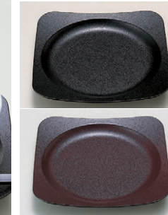
8-890-21 M-5-54 A浏丸角皿 黒石目 ¥1,400 (22×22×3)