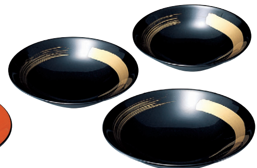
8-889-7 M平羽反そば鉢 黒一筆 S-9-24 5寸 ¥1,300 (15φ×3.5) 梱80 S-9-25 5.5寸 ¥1,500 (16.6φ×3.8) 梱80 S-9-26 6.5寸 ¥1,900 (19.7φ×4.1) 梱60