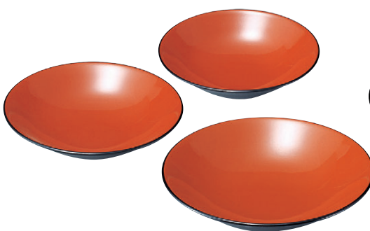
8-889-6 M平羽反そば鉢 朱天黒 S-7-53 5寸 ¥1,250 (15φ×3.5) 梱80 S-7-54 5.5寸 ¥1,400 (16.6φ×3.8) 梱80 S-7-55 6.5寸 ¥1,750 (19.7φ×4.1) 梱60