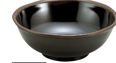
8-890-17 1-547-5 M7寸麺井(天目) W-83BL ¥1,470 (20.4φ×7.6・1,220cc) 梱60