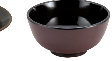
8-890-19 1-547-8 Mうどん井 溜 ST-1-2 ¥1,900 (16.3φ×7.9・900cc) 梱80