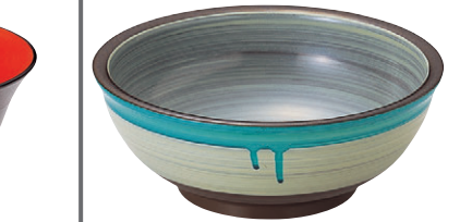
8-890-12 S-7-71 M乱筋ラーメン鉢 三色ライン塗 ¥2,600 (21.3φ×8.3・1,000cc) 梱50