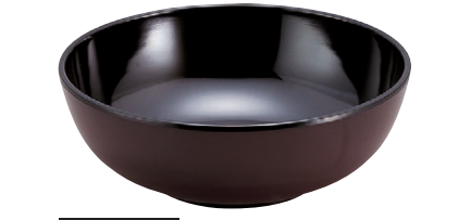
8-890-20 1-547-10 M多用井 溜 ST-2-2 ¥2,130 (20φ×7.2・1,200cc) 梱60