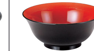
8-890-11 1-546-26 A浏布目ラーメン鉢 黒内朱 ¥950 (19.9φ×8.4・1,050cc) 梱100