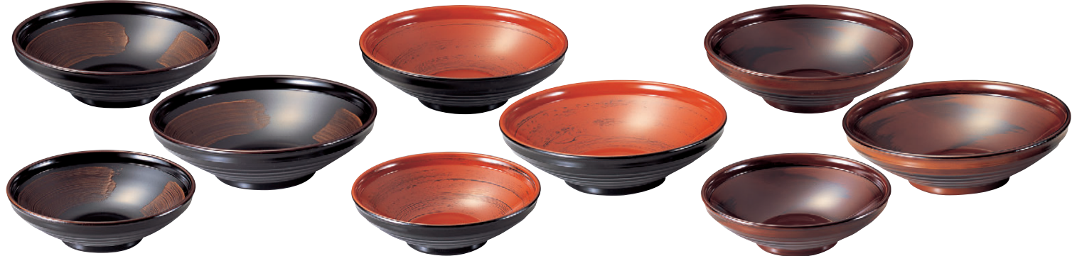
8-889-3 A越前鉢 ハケ目一筆 S-8-60 6.5寸 ¥2,100 (19.5φ×5.8) 梱80 S-8-61 7.5寸 ¥2,800 (23φ×6.8) 梱60 S-8-62 8.5寸 ¥3,350 (26.5φ×7.8) 梱60