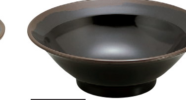
8-890-18 1-547-6 M8寸麺井(天目) W-179BL ¥1,680 (21.7φ×7.3・1,200cc) 梱60