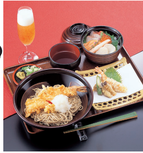
8-889-2 A越前鉢 黒石目 S-8-57 6.5寸 ¥1,800 (19.5φ×5.8) 梱80 S-8-58 7.5寸 ¥2,300 (23φ×6.8) 梱60 S-8-59 8.5寸 ¥2,900 (26.5φ×7.8) 梱60