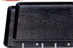
8-890-24 A厚口木目盆 黒 フンスリップ加工 1-74-41 8寸 ¥1,150 (23.9×23.9×1.5) 梱60 1-74-42 9寸 ¥1,400 (27×27×1.7) 梱60