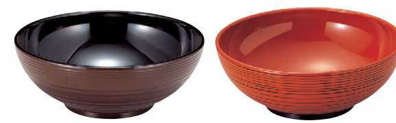
8-890-4 1-546-31 A四季ラーメン鉢 うるみ千筋内黒 ¥1,050 (18.4φ×6.8・980cc) 梱100