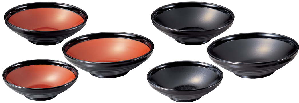
8-889-1 A越前鉢 黒内朱天黒 S-8-54 6.5寸 ¥1,650 (19.5φ×5.8) 梱80 S-8-55 7.5寸 ¥2,100 (23φ×6.8) 梱60 S-8-56 8.5寸 ¥2,650 (26.5φ×7.8) 梱60