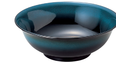
8-890-9 S-9-4 M羽反ラーメン丼(大) ブルーレーザーぼかし ¥2,250 (21φ×7.5・1,200cc) 梱80