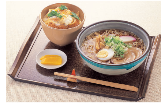
8-890-1 S-8-98 A羽反ラーメン丼(小) 溜曙 ¥1,350 (15φ×6.5・400cc) 梱120