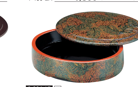
8-824-15 A D.X小判特上すし桶 木ノ葉 1-489-4 オヤ ¥2,950 (26×21×6.8) 櫃40 1-489-4A フタ ¥2,150 (26×21×2.2) 櫃80