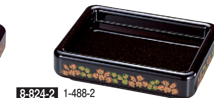
8-824-2 1-488-2 A D.X長角桶 茶パールあざみ ¥3,450 (27×21×6.6) 櫃40