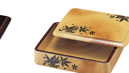
8-824-10 A D.X長手特上桶 花梨春秋 1-488-8 オヤ ¥3,900 (27×21.2×7.5) 櫃40 1-488-8A フタ ¥2,350 (27×21.2×1.5) 櫃80