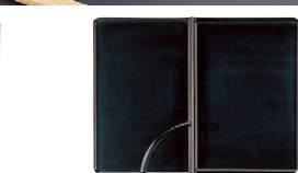
8-824-8 1-488-10 M D.X長手特上桶用 黒1枚仕切 ¥2,200 (23.7×18×3.3) 櫃40