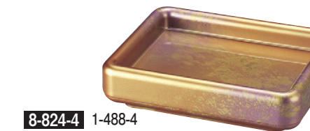
8-824-4 1-488-4 A D.X長角桶 金王八雲 ¥4,550 (27×21×6.6) 櫃40