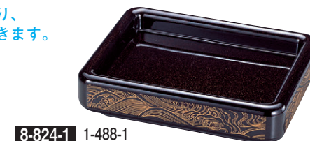
8-824-1 1-488-1 A D.X長角桶 茶パール波 ¥3,200 (27×21×6.6) 櫃40