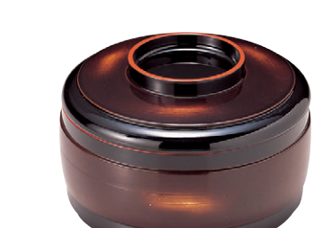
8-823-19 A糸巻丸重 タメ別甲 O-3-43 ¥2,300 (14.5φ×9.1) 櫃60