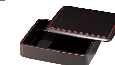
8-824-9 A D.X長手特上桶 溜内漆調黒天溜底黒塗 S・S塗 O-3-50 オヤ ¥3,200 (27×21.2×7.5) 櫃40 O-3-51 フタ ¥2,100 (27×21.2×1.5) 櫃80