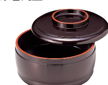
8-823-18 A糸巻丸重 タメパール天朱 O-3-42 ¥1,950 (14.5φ×9.1) 櫃60