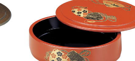
8-824-12 A D.X小判特上すし桶 朱はまぐり 1-489-2 オヤ ¥2,700 (26×21×6.8) 櫃40 1-489-2A フタ ¥1,800 (26×21×2.2) 櫃80