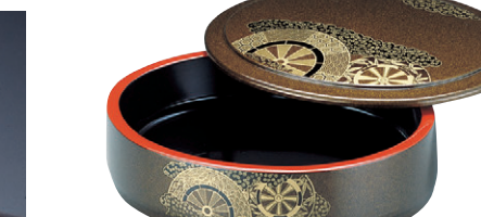
8-824-11 A D.X小判特上すし桶 梨地御所車 1-489-1 オヤ ¥2,700 (26×21×6.8) 櫃40 1-489-1A フタ ¥1,800 (26×21×2.2) 櫃80