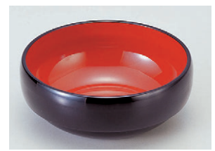
8-857-7 1-328-9 A 4寸丸鉢 朱天黒 (段付) ¥500 (11.5φ×4.2) 梱200