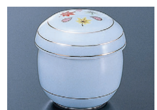
8-857-17 H-6-42 陶かぶせ蒸し碗 春秋 限定品 ¥800 (7.5φ×7.7)