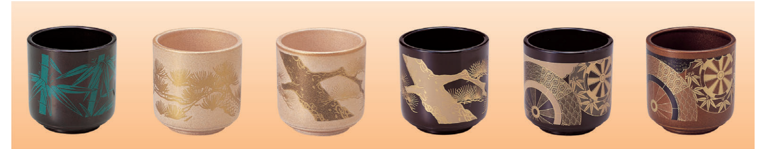
8-858-19 O-89-5 TA 切立湯呑 茶にグリーン竹 ¥650 (7.6φ×7.8) 梱100 8-858-20 O-89-6 TA 切立湯呑 金パール老松 ¥700 (7.6φ×7.8) 梱100 8-858-21 O-89-7 TA 切立湯呑 金パール黒松 ¥840 (7.6φ×7.8) 梱100 8-858-22 O-89-8 TA 切立湯呑 茶に白松 ¥840 (7.6φ×7.8) 梱100 8-858-23 O-89-9 TA 切立湯呑 茶に御所車 ¥840 (7.6φ×7.8) 梱100 8-858-24 O-89-10 TA 切立湯呑 梨地御所車 ¥880 (7.6φ×7.8) 梱100