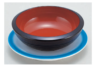
8-857-9 A 千筋鉄鉢 外黒塗内朱天黒 1-548-1 4寸 ¥700 (11.4φ×4) 梱200 1-548-2 4.5寸 ¥800 (13.3φ×4.2) 梱160