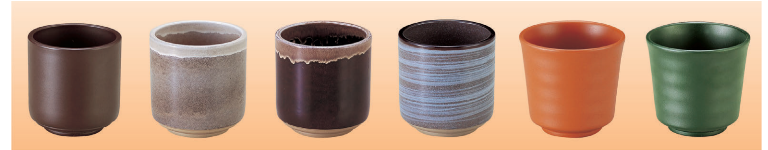
8-858-1 1-513-1 TA 切立湯呑 茶乾漆 ¥780 (7.6φ×7.8) 梱100 8-858-2 1-513-2 TA 切立湯呑 灰釉 ¥1,140 (7.6φ×7.8) 梱100 8-858-3 1-513-3 TA 切立湯呑 天目 ¥1,140 (7.6φ×7.8) 梱100 8-858-4 1-513-4 TA 切立湯呑 白河 ¥1,140 (7.6φ×7.8) 梱100 8-858-5 1-513-5 TA 筋入湯呑 益子 ¥800 (8.3φ×7.7) 梱100 8-858-6 1-513-6 TA 筋入湯呑 グリーン乾漆 ¥800 (8.3φ×7.7) 梱100