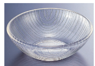
8-857-14 1-512-23 AC (小) サラダボール 透明 ¥900 (13φ×4.2) 梱160