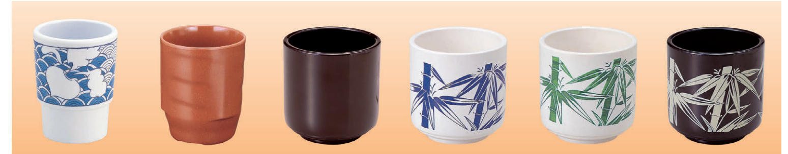
8-858-13 1-513-13 M 湯のみ 青海波 ¥690 (7.2φ×9.4) 梱100 8-858-14 M-15-4-2 M 長湯呑 益子 ¥430 (6.7φ×7.9) 梱100 8-858-15 O-89-1 TA 切立湯呑 茶 ¥600 (7.6φ×7.8) 梱100 8-858-16 O-89-2 TA 切立湯呑 白にブルー竹 ¥600 (7.6φ×7.8) 梱100 8-858-17 O-89-3 TA 切立湯呑 白にグリーン竹 ¥600 (7.6φ×7.8) 梱100 8-858-18 O-89-4 TA 切立湯呑 茶に白竹 ¥650 (7.6φ×7.8) 梱100