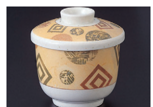
8-857-18 1-872-5 陶茶碗蒸し 升ちらし 限定品 ¥850 (8.4φ×8.6)