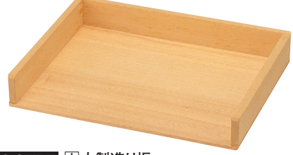
8-857-5 困木製作り板 1-745-30 (小) ¥5,000 (36×27×6) 梱10 1-745-31 (大) ¥6,350 (39×30×6) 梱10