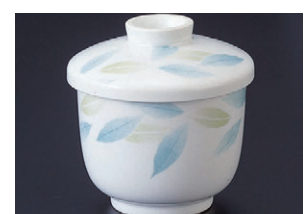
8-857-19 1-872-4 陶茶碗蒸し 舞葉 限定品 ¥850 (8.4φ×8.6)