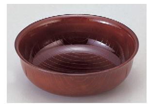
8-857-8 A ケヤキサラダ鉢 溜 1-512-26 4.5寸 ¥810 (13.4φ×4.6) 梱160 1-771-2 5寸 ¥950 (14.9φ×4.6) 梱160