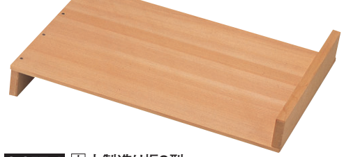
8-857-4 困木製作り板S型 1-745-28 (小) ¥4,400 (42×21×5.5) 梱20 1-745-29 (大) ¥5,500 (45×30×5.5) 梱20