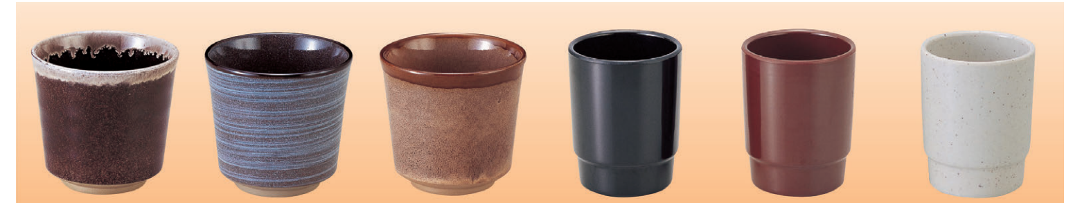
8-858-7 1-513-7 TA 筋入湯呑 天目 ¥1,180 (8.3φ×7.7) 梱100 8-858-8 1-513-8 TA 筋入湯呑 白河 ¥1,180 (8.3φ×7.7) 梱100 8-858-9 1-513-9 TA 筋入湯呑 茶時雨 ¥1,180 (8.3φ×7.7) 梱100 8-858-10 1-513-10 M 湯のみ ブラック ¥820 (7.3φ×9.5) 梱100 8-858-11 1-513-11 M 湯のみ マロン ¥820 (7.3φ×9.5) 梱100 8-858-12 1-513-12 M 湯のみ ホワイトゴマ ¥820 (7.3φ×9.5) 梱100