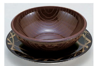
8-857-13 1-512-22 A (小) サラダボール 溜 ¥650 (13φ×4.2) 梱160