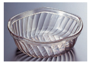
8-857-6 1-512-1 AC 鉢 ¥950 (12.7φ×4.4) 梱200