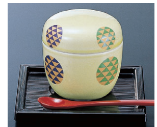
8-857-23 陶ナツメ蒸し碗 H-6-43 クリーム金菱 限定品 ¥800 (7.8φ×8.5)