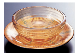
8-857-15 AC 千筋鉄鉢 ブラウン 1-550-2 4寸 ¥1,100 (11.4φ×4) 梱200 1-550-3 4.5寸 ¥1,200 (13.3φ×4.2) 梱160