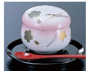
8-857-21 陶茶碗蒸し (小) H-6-44 ピンク春秋 限定品 ¥730 (8.2φ×6.5)