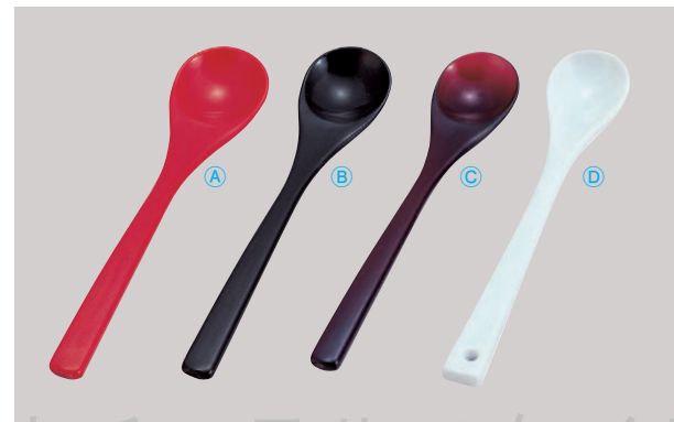
8-857-20 A 1-772-41 A 茶碗蒸しスプーン 赤 ¥130 (13.1×2.7) 梱1,000 B H-1-37 A 茶碗蒸しスプーン 黒 ¥190 (13.1×2.7) 梱1,000 C 1-772-44 AC 茶碗蒸しスプーン 別甲 ¥240 (13.1×2.7) 梱1,000 D H-1-40 陶茶碗蒸しスプーン 白磁 限定品 ¥200 (13.1×2.7) 梱1,000