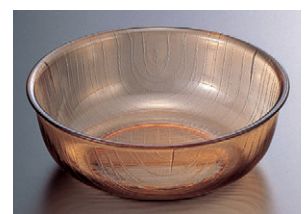
8-857-12 1-512-29 AC 4.5寸ケヤキサラダ鉢 ブラウン ¥1,290 (13.4φ×4.6) 梱160