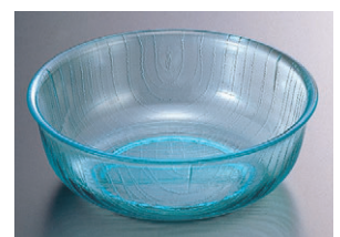
8-857-11 1-512-28 AC 4.5寸ケヤキサラダ鉢 ブルー ¥1,290 (13.4φ×4.6) 梱160