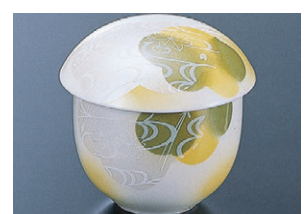
8-857-16 H-10-54 陶茶碗蒸し 竜田川 限定品 ¥850 (9.1φ×9)