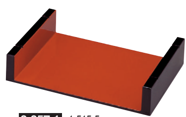
8-857-1 1-515-5 A (小) 又基板 朱 ¥2,100 (30×21×6.9) 梱50