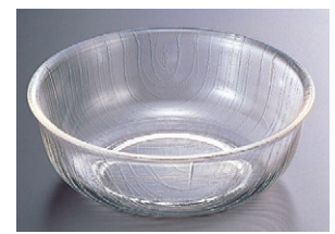
8-857-10 1-512-27 AC 4.5寸ケヤキサラダ鉢 透明 ¥890 (13.4φ×4.6) 梱160