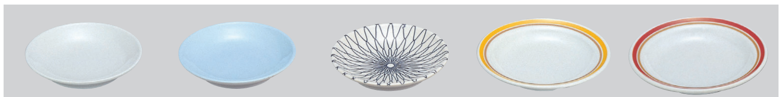
8-855-13 1-510-32 [M] しょうゆ皿(中) 白 ¥490 (9.2φ×1.7) 櫃300 8-855-14 1-510-33 [M] しょうゆ皿(中) ブルー ¥520 (9.2φ×1.7) 櫃300 8-855-15 1-510-34 [M] しょうゆ皿(中) 網目 ¥550 (9.2φ×1.7) 櫃300 8-855-16 1-510-36 [M] しょうゆ皿(大) イエローライン ¥550 (10.3φ×1.8) 櫃300 8-855-17 1-510-37 [M] しょうゆ皿(大) ワインライン ¥550 (10.3φ×1.8) 櫃300