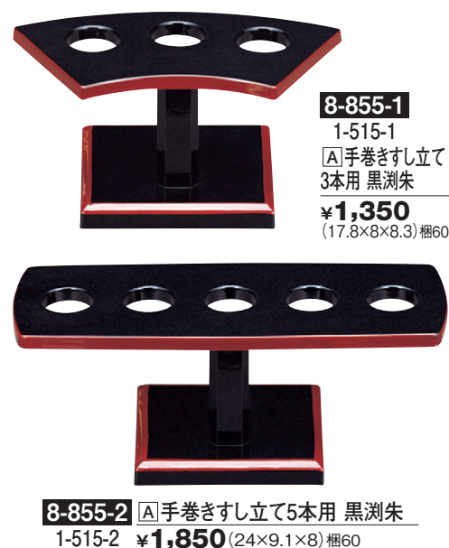
8-855-1 1-515-1 [A]手巻きすし立て 3本用 黒測朱 ¥1,350 (17.8×8×8.3) 櫃60