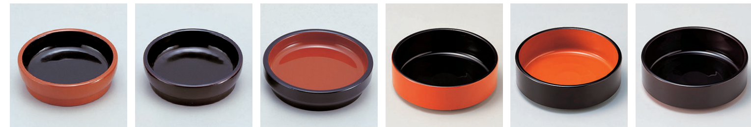
8-856-9 1-559-21 [A]D.X竹型タレ入れ 朱内黒 ¥450 (8φ×2.5) 櫃200 8-856-10 1-559-23 [A]D.X竹型タレ入れ 溜 ¥500 (8φ×2.5) 櫃200 8-856-11 1-510-3 [A]D.Xタレ入れ 朱天黒 ¥480 (9.4φ×2.4) 櫃200 8-856-12 O-3-87 [A]3寸ロク口目タレ入れ 朱内黒 ¥400 (9φ×2.7) 櫃300 8-856-13 O-3-88 [A]3寸ロク口目タレ入れ 黒内朱天黒 ¥400 (9φ×2.7) 櫃300 8-856-14 O-3-89 [A]3寸ロク口目タレ入れ 溜 ¥450 (9φ×2.7) 櫃300