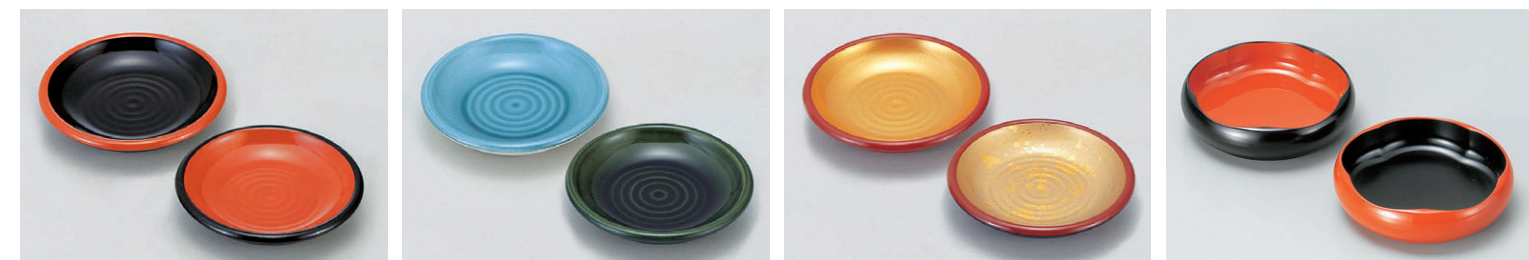
8-856-1 1-511-21 [A]錦のぞき皿 黒天朱 ¥400 (8φ×1.6) 櫃300 8-856-2 1-511-22 [A]錦のぞき皿 朱天黒 ¥400 (8φ×1.6) 櫃300 8-856-3 1-511-19 [A]錦のぞき皿 青磁 ¥500 (8φ×1.6) 櫃300 8-856-4 1-511-20 [A]錦のぞき皿 織部 ¥500 (8φ×1.6) 櫃300 8-856-5 1-511-17 [A]錦のぞき皿 金雅外朱 ¥900 (8φ×1.6) 櫃300 8-856-6 1-511-18 [A]錦のぞき皿 色紙金箔天朱 ¥900 (8φ×1.6) 櫃300 8-856-7 O-6-19 [A]梅型タイコ のぞき皿 黒内洗朱 ¥500 (8.6φ×2.2) 櫃200 8-856-8 O-6-20 [A]梅型タイコ のぞき皿 洗朱内黒 ¥500 (8.6φ×2.2) 櫃200