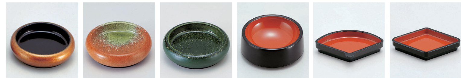
8-856-27 1-510-6 [A]D.Xタイコ型のぞき 梨地内黒 ¥600 (9.5φ×2.5) 櫃200 8-856-28 1-510-8 [A]D.Xタイコ型のぞき 若草織部 ¥800 (9.5φ×2.5) 櫃200 8-856-29 1-510-9 [A]D.Xタイコ型のぞき 織部 ¥800 (9.5φ×2.5) 櫃200 8-856-30 1-510-17 [A]D.Xのぞき 黒刷毛目内朱 ¥900 (9.7φ×3.7) 櫃150 8-856-31 1-510-13 [A]扇面タレ入れ 朱天黒 ¥650 (11.3×8.7×2.5) 櫃200 8-856-32 1-510-15 [A]菱型タレ入れ 朱天黒 ¥650 (14×8.7×2.5) 櫃200