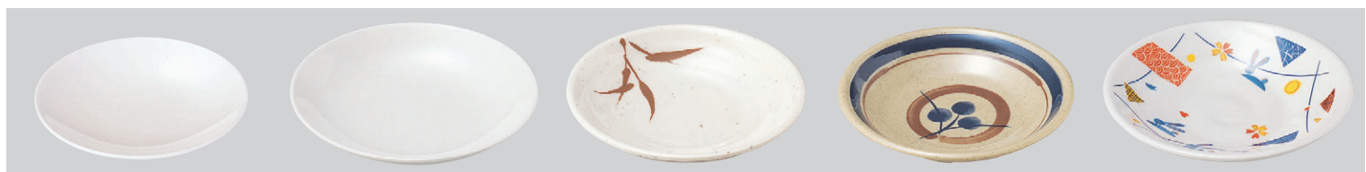
8-855-3 J-4-60 [M] (M-46) 9cm小皿(浅) アイボリー ¥190 (9φ×1.7) 櫃240 8-855-4 J-4-59 [M] (M-91) 10.5cm小皿 アイボリー ¥230 (10.5φ×1.8) 櫃240 8-855-5 W-61-5-0 [M] (Y-SW-61) 10cm小皿 芳野 ¥350 (10φ×2.2) 櫃240 8-855-6 W-61-1-9 [M] (S-PW-61) 10cm小皿 セビア ¥350 (10φ×2.2) 櫃240 8-855-7 J-1-8 [M] (U-RM-1) 小皿 ウサギ ¥400 (10.7φ×2.1) 櫃200