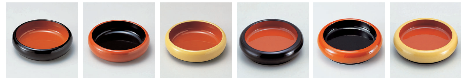
8-856-21 O-3-90 [A]タイコ型のぞき(小) 黒内朱 ¥480 (8.8φ×2.4) 櫃200 8-856-22 O-3-91 [A]タイコ型のぞき(小) 朱内黒 ¥480 (8.8φ×2.4) 櫃200 8-856-23 O-3-92 [A]タイコ型のぞき(小) クリーム内朱 ¥530 (8.8φ×2.4) 櫃200 8-856-24 1-510-4 [A]D.Xタイコ型のぞき 黒内朱 ¥490 (9.5φ×2.5) 櫃200 8-856-25 O-3-93 [A]D.Xタイコ型のぞき 朱内黒 ¥490 (9.5φ×2.5) 櫃200 8-856-26 1-510-5 [A]D.Xタイコ型のぞき クリーム内朱 ¥550 (9.5φ×2.5) 櫃200