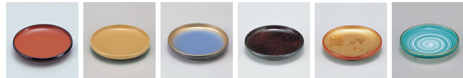
8-856-15 1-464-8 [A]一休タレ入れ 黒内朱 ¥400 (9φ×1.6) 櫃200 8-856-16 1-464-24 [A]一休タレ入れ 白木 ¥500 (9φ×1.6) 櫃200 8-856-17 1-464-16 [A]一休タレ入れ ブルー真珠測金 ¥700 (9φ×1.6) 櫃200 8-856-18 1-464-32 [A]一休タレ入れ 樺木目 ¥700 (9φ×1.6) 櫃200 8-856-19 1-464-40 [A]一休タレ入れ 色紙金箔測朱 [S-H塗] ¥950 (9φ×1.6) 櫃200 8-856-20 1-464-48 [A]一休タレ入れ 清流天金 ¥950 (9φ×1.6) 櫃200