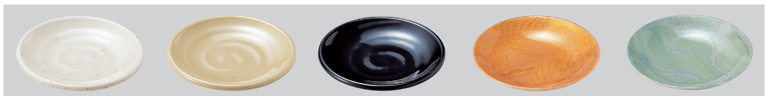
8-855-8 K-6-4-3 [M] (K-JW-6) 小皿 粉引 ¥300 (9.6φ×1.3) 櫃250 8-855-9 G-6-4-3 [M] (G-JW-6) 小皿 萌黄 ¥300 (9.6φ×1.3) 櫃250 8-855-10 W-6-4-2 [M] (N-JW-6) 小皿 那智 ¥300 (9.6φ×1.3) 櫃250 8-855-11 J-5-38 [M] (M-91T) 10.5cm小皿 西陣金の鶴 ¥550 (10.5φ×1.8) 櫃240 8-855-12 J-5-39 [M] (M-91N) 10.5cm小皿 西陣能登 ¥550 (10.5φ×1.8) 櫃240