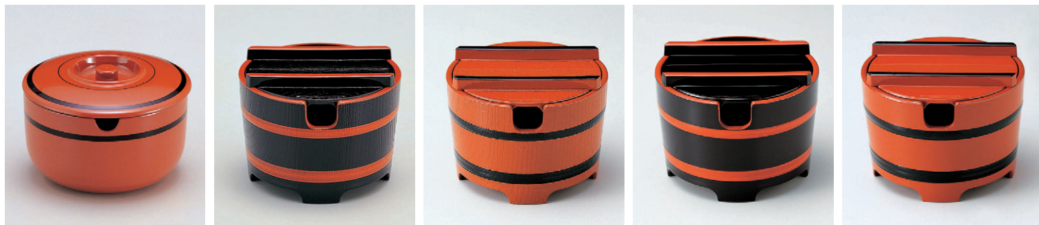
8-853-10 1-511-8 [A] ガリ入れ 朱に帯黒(切込有) ¥1,600 (11.8φ×7.8) 幅80 8-853-11 1-511-6 [A] 桶型ガリ入れ 黒木目天朱(切込有) ¥1,400 (10.8φ×8.3) 幅80 8-853-12 O-3-79 [A] 桶型ガリ入れ 朱木目天黒(切込有) ¥1,400 (10.8φ×8.3) 幅80 8-853-13 O-3-80 [A] 桶型ガリ入れ 黒帯朱(切込有) ¥1,400 (10.8φ×8.3) 幅80 8-853-14 1-511-7 [A] 桶型ガリ入れ 朱帯黒(切込有) ¥1,400 (10.8φ×8.3) 幅80