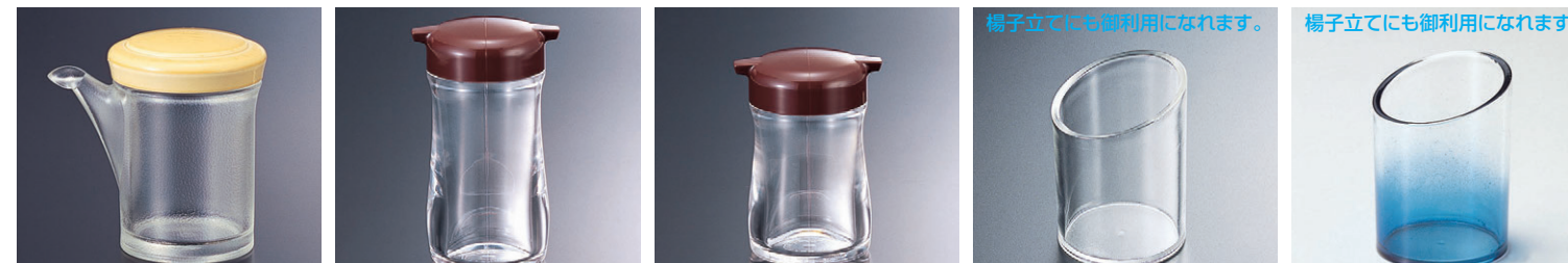
8-854-16 1-774-4 [AC] (Y-1W) しょう油差し ウッディ ¥1,000 (7φ×10.5×10.7) 幅100 8-854-17 1-774-8 [AC] ソース入れ ブラウン ¥830 (6.4φ×13.5) 幅100 8-854-18 1-774-9 [AC] しょう油入れ ブラウン ¥800 (6.4φ×11) 幅100 8-854-19 H-1-47 [AC] 伝票立て 透明(底面付) ¥500 (4.7φ×7) 幅300 8-854-20 H-9-74 [AC] 伝票立て ブルー(底面付) ¥560 (4.7φ×7) 幅300