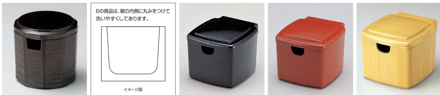
6の商品は、親の内側に丸みをつけて洗いやすくしてあります。 イメージ図 8-853-6 O-6-2 [A] 木彫ガリ入れ 枺 ¥2,700 (10.5φ×10.5) 幅100 8-853-7 1-511-1 [A] 隅丸ガリ入れ 黒刷毛目(切込有) ¥2,100 (10×11.1×8.8) 幅80 8-853-8 1-511-2 [A] 隅丸ガリ入れ 朱刷毛目(切込有) ¥2,100 (10×11.1×8.8) 幅80 8-853-9 1-511-3 [A] 隅丸ガリ入れ 白木塗(切込有) ¥2,100 (10×11.1×8.8) 幅80