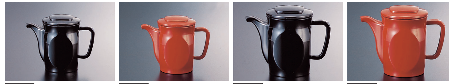
8-854-7 1-774-1 [AC] ショーユ差し 黒 ¥2,200 (11.5×6.2×9) 幅100 8-854-8 1-774-2 [AC] ショーユ差し 朱 ¥2,200 (11.5×6.2×9) 幅100 8-854-9 O-2-1 [AC] (大) ショーユ差し 黒 ¥3,200 (15×8.4×12) 幅60 8-854-10 O-2-2 [AC] (大) ショーユ差し 朱 ¥3,200 (15×8.4×12) 幅60