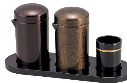
8-854-21 1-511-12 [M] ショーユ/ソース差し 溜パール ¥1,700 (6.3×5.5×9.5) 幅100 1-511-13 [M] ショーユ/ソース差し 梨地 ¥1,700 (6.3×5.5×9.5) 幅100 1-511-14 [M] 楊子入れ 黒金ライン ¥800 (4φ×5) 幅200 1-511-15 [M] カスタートレー 黒 ¥1,100 (21×8×11) 幅100