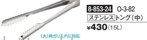
8-853-24 O-3-82 [ステンレス] トング(中) ¥430 (15L) (大)角ガリ入れに対応