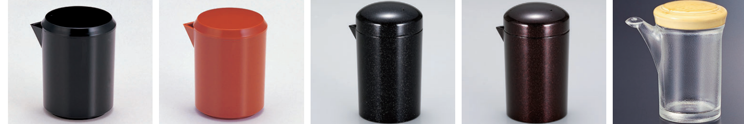
8-854-11 O-1-98 [AC] 筒型ショーユ差 黒 ¥800 (7.6×6.6×8.8) 幅100 8-854-12 O-1-99 [AC] 筒型ショーユ差 朱 ¥800 (7.6×6.6×8.8) 幅100 8-854-13 O-7-23 [M] ショーユ/ソース差 黒パール ¥1,700 (6.3×5.5×9.5) 幅100 8-854-14 1-511-12 [M] ショーユ/ソース差 溜パール ¥1,700 (6.3×5.5×9.5) 幅100 8-854-15 1-774-3 [AC] (Y-2W) ソース差し ウッディ ¥1,100 (7φ×10.5×12.3) 幅80