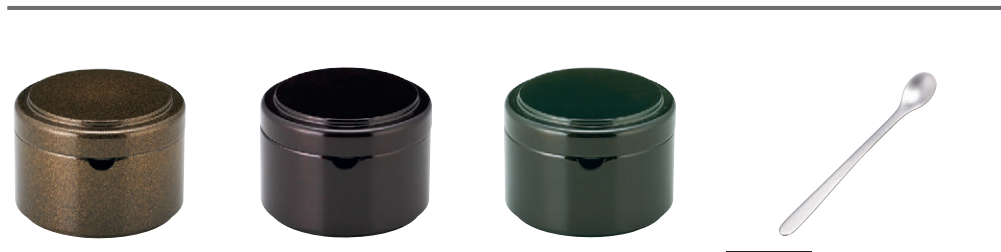
8-853-20 O-6-68 [M] 粉茶入れ 梨地 ¥1,300 (7.8φ×5.7) 8-853-21 O-6-69 [M] 粉茶入れ タメパール ¥1,300 (7.8φ×5.7) 8-853-22 O-7-1 [M] 粉茶入れ グリーンパール ¥1,300 (7.8φ×5.7) 8-853-23 O-7-2 [ステンレス] (小) スプーン ¥180 (8.6L) 粉茶入れ用