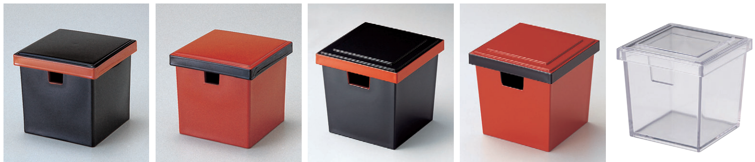
8-853-1 O-1-93 [A] (小)角ガリ入れ 黒淵朱(切込有) ¥1,750 (11×11×10.9) 幅80 8-853-2 O-1-95 [A] (小)角ガリ入れ 朱淵黒(切込有) ¥1,750 (11×11×10.9) 幅80 8-853-3 O-1-94 [A] (大)角ガリ入れ 黒淵朱(切込有) ¥2,050 (12×12×11.6) 幅80 8-853-4 O-1-96 [A] (大)角ガリ入れ 朱淵黒(切込有) ¥2,050 (12×12×11.6) 幅80 8-853-5 O-6-67 [AC] (大)角ガリ入れ 透明(切込有) ¥3,300 (12×12×11.6) 幅80