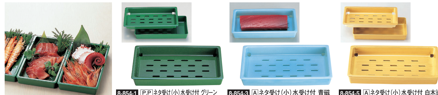
8-854-1 [P.P] ネット受け(小)水受け付 グリーン O-2-28 ¥950 (20.2×11.1×3.2) 幅120 8-854-2 [P.P] ネット受け(大)水受け付 グリーン O-2-29 ¥1,050 (22.9×12.9×3.2) 幅100 8-854-3 [A] ネット受け(小)水受け付 青磁 O-2-30 ¥1,800 (20.2×11.1×3.2) 幅120 8-854-4 [A] ネット受け(大)水受け付 青磁 O-2-31 ¥1,950 (22.9×12.9×3.2) 幅100 8-854-5 [A] ネット受け(小)水受け付 白木塗 O-3-76 ¥1,800 (20.2×11.1×3.2) 幅120 8-854-6 [A] ネット受け(大)水受け付 白木塗 O-3-77 ¥1,950 (22.9×12.9×3.2) 幅100