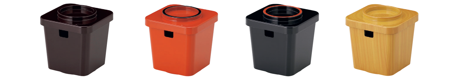
8-853-15 O-6-61 [TA] 隅丸角ガリ入れ 新溜(切込有) ¥1,300 (11.1×11.1×11.4) 8-853-16 O-6-64 [TA] 隅丸角ガリ入れ 朱天黒(切込有) ¥1,500 (11.1×11.1×11.4) 8-853-17 O-6-65 [TA] 隅丸角ガリ入れ 黒天朱(切込有) ¥1,500 (11.1×11.1×11.4) 8-853-18 O-6-66 [TA] 隅丸角ガリ入れ 白木(切込有) ¥2,100 (11.1×11.1×11.4)