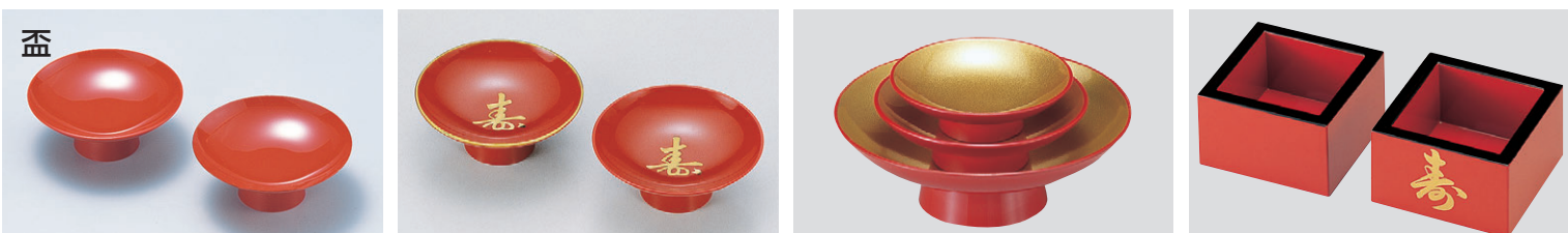
盃 8-805-9 [A]2.6寸盃 朱塗 M-10-7 ¥300 (7.7φ×2.6) 櫃300 8-805-10 [A]3寸盃 朱塗 M-10-8 ¥315 (9φ×2.9) 櫃300 8-805-11 [A]3寸盃 朱寿天金 1-458-16 ¥340 (9.1φ×3.6) 櫃300 8-805-12 [A]3寸盃 朱寿 1-458-15 ¥330 (9.1φ×3.6) 櫃300 8-805-13 [M]2.6寸盃 朱内金雅 1-674-13 ¥1,500 (7.7φ×2.7) 櫃200 8-805-14 [M]3寸盃 朱内金雅 1-674-14 ¥1,850 (9φ×3.2) 櫃200 8-805-15 [M]4寸盃 朱内金雅 1-674-15 ¥2,100 (12.7φ×4.1) 櫃150 8-805-16 [A]D.X一合マス 朱天黒 1-458-7 ¥500 (8×8×5) 櫃200 8-805-17 [A]D.X一合マス 朱天黒寿 1-458-8 ¥580 (8×8×5) 櫃200