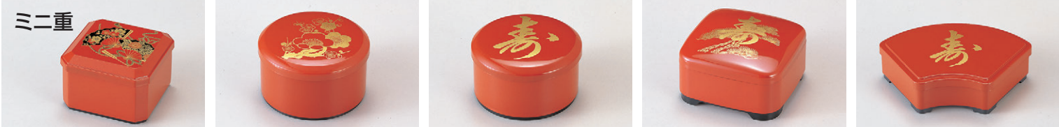
三二重 8-805-18 1-459-1 [A]3.8寸隅切重 朱に扇面 ¥495 (11.5×11.5×7.2) 櫃300 8-805-19 1-459-2 [A]丸重 朱に梅 ¥480 (12.6φ×7) 櫃300 8-805-20 1-459-3 [A]丸重 朱に寿 ¥480 (12.6φ×7) 櫃300 8-805-21 1-459-4 [A]みどり重 朱に寿松 ¥500 (13.3×13.6×7.3) 櫃300 8-805-22 1-459-5 [A]扇面重 朱に寿 ¥1,300 (21.7×14.2×5.6) 櫃50