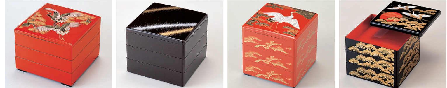
8-806-5 [A]6.5寸千筋重 朱に二羽鶴 1-459-35 3段 ¥2,550 (19.5×19.5×16.5) 櫃20 1-459-36 2段 ¥1,950 (19.5×19.5×11.3) 櫃30 8-806-6 [A]6.5寸重 茶パール銀河 1-459-37 3段 ¥2,300 (19.6×19.6×16.5) 櫃20 1-459-38 2段 ¥1,800 (19.6×19.6×11.3) 櫃30 8-806-7 [A]6.5寸重 朱に松鶴 1-459-39 3段 ¥2,650 (19.6×19.6×16.5) 櫃20 1-459-40 2段 ¥2,000 (19.6×19.6×11.3) 櫃30 8-806-8 [A]6.5寸重 黒内朱塗日の出鶴 1-459-41 3段 ¥3,300 (19.6×19.6×16.5) 櫃20 1-459-42 2段 ¥2,500 (19.6×19.6×11.3) 櫃30