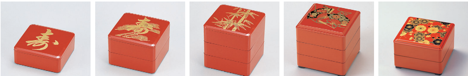
8-805-23 [A]3.8寸重 朱に寿 1-459-6 1段 ¥460 (11.4×11.4×4.7) 櫃300 2段 ¥660 (11.4×11.4×8.1) 櫃150 3段 ¥860 (11.4×11.4×11.5) 櫃100 8-805-24 [A]3.8寸重 朱に寿松 1-459-9 1段 ¥460 (11.4×11.4×4.7) 櫃300 2段 ¥660 (11.4×11.4×8.1) 櫃150 3段 ¥860 (11.4×11.4×11.5) 櫃100 8-805-25 [A]3.8寸重 朱に竹 1-459-12 1段 ¥460 (11.4×11.4×4.7) 櫃300 2段 ¥660 (11.4×11.4×8.1) 櫃150 3段 ¥860 (11.4×11.4×11.5) 櫃100 8-805-26 [A]4.5寸重 朱に扇面 1-459-15 1段 ¥650 (13.4×13.4×5.6) 櫃200 2段 ¥980 (13.4×13.4×9.6) 櫃100 3段 ¥1,310 (13.4×13.4×13.7) 櫃70 8-805-27 [A]4.5寸重 朱に梅 1-459-18 1段 ¥650 (13.4×13.4×5.6) 櫃200 2段 ¥980 (13.4×13.4×9.6) 櫃100 3段 ¥1,310 (13.4×13.4×13.7) 櫃70