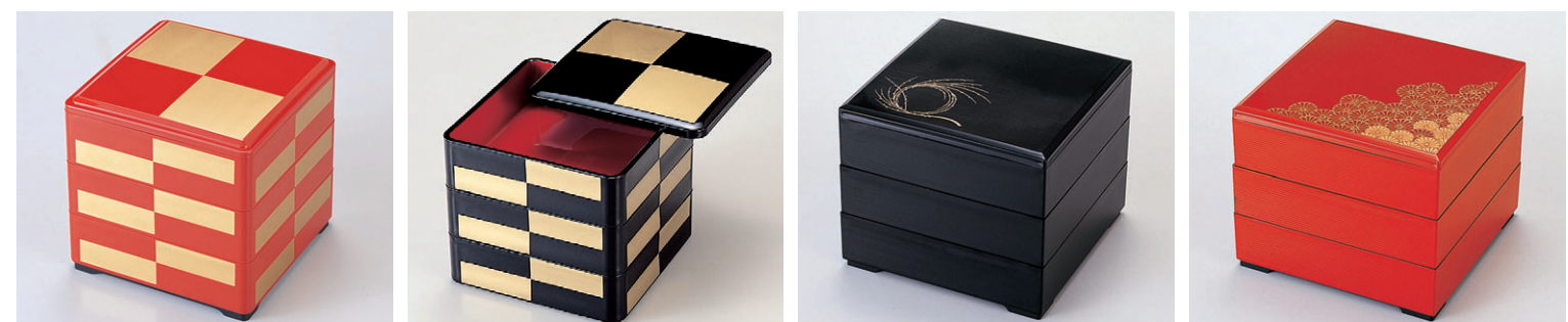
8-806-9 [A]6.5寸重 朱に金市松(深型) 1-460-9 3段 ¥3,000 (19.8×19.8×19.2) 櫃20 1-460-10 2段 ¥2,300 (19.8×19.8×13.5) 櫃30 8-806-10 [A]D.X6.5寸重 黒内朱塗金市松(厚型) 1-460-19 3段 ¥6,900 (19.5×19.5×18) 櫃18 1-460-20 2段 ¥5,200 (19.5×19.5×12) 櫃24 8-806-11 [A]7寸千筋重 黒柳結び 1-460-24 3段 ¥2,650 (21.2×21.2×16.5) 櫃20 1-460-25 2段 ¥2,050 (21.2×21.2×11.4) 櫃30 8-806-12 [A]7寸千筋重 朱に野菊 1-460-26 3段 ¥2,650 (21.2×21.2×16.5) 櫃20 1-460-27 2段 ¥2,050 (21.2×21.2×11.4) 櫃30