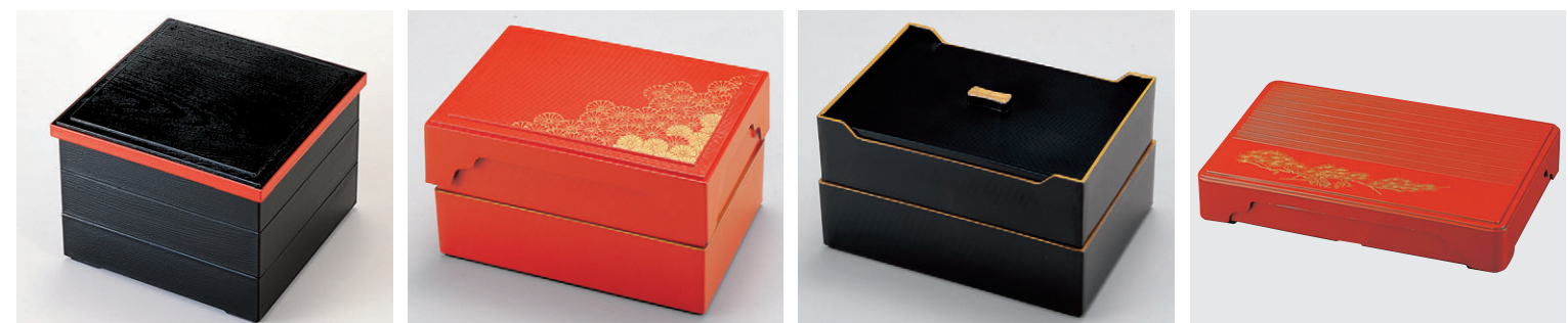
8-806-13 [A]7寸木目重 黒瀾朱 1-460-22 3段 ¥3,800 (22.4×22.4×16) 櫃20 1-460-23 2段 ¥2,700 (22.4×22.4×11) 櫃30 8-806-14 [A]お好み箱膳重 朱天金に菊 1-458-22 2段 ¥3,100 (24.6×17.3×12.7) 櫃20 1-458-23 1段 ¥2,050 (24.6×17.3×7) 櫃40 8-806-15 [A]お好み重 黒天金 1-458-24 2段 ¥2,450 (23.7×16.1×12.1) 櫃20 1-458-25 1段 ¥1,500 (23.7×16.1×6.3) 櫃40 8-806-16 [A]9寸長手御膳重 朱に松 F-272 ¥1,500 (26.9×17.7×5) 櫃40