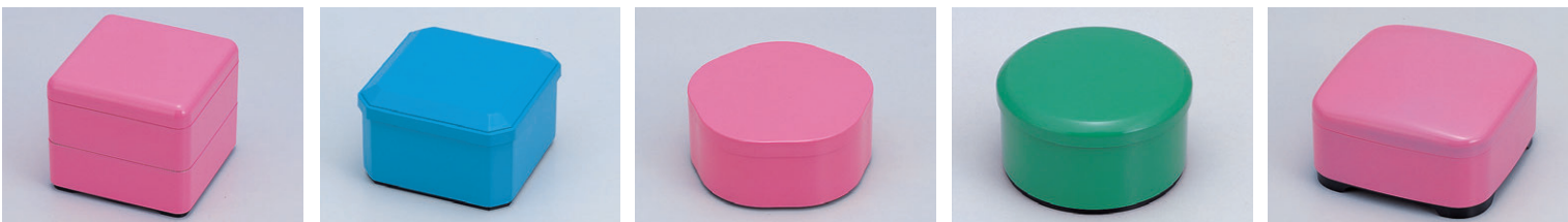
8-805-33 H-148-27 [A]3.5寸重 ピンク(内黒) 1段 ¥600 (10.5×10.5×5.6) 櫃200 2段 ¥900 (10.5×10.5×9.6) 櫃100 8-805-34 [A]3.8寸隅切重 ピンク(内黒) H-148-21 ¥470 (11.5×11.5×7.2) 櫃300 8-805-35 [A]3.8寸隅切重 グリーン(内黒) H-148-22 ¥470 (11.5×11.5×7.2) 櫃300 8-805-36 [A]3.8寸隅切重 ブルー(内黒) H-148-23 ¥470 (11.5×11.5×7.2) 櫃300 8-805-37 [A]梅重 ピンク(内黒) H-148-31 ¥610 (12×11.8×5.7) 櫃300 8-805-38 [A]丸重 ピンク(内黒) H-148-24 ¥490 (12.6φ×7) 櫃300 8-805-39 [A]丸重 グリーン(内黒) H-148-25 ¥490 (12.6φ×7) 櫃300 8-805-40 [A]丸重 ブルー(内黒) H-148-26 ¥490 (12.6φ×7) 櫃300 8-805-41 [A]みどり重 ピンク(内黒) H-148-28 ¥520 (13.6×13.6×7.3) 櫃300 8-805-42 [A]みどり重 グリーン(内黒) H-148-29 ¥520 (13.6×13.6×7.3) 櫃300 8-805-43 [A]みどり重 ブルー(内黒) H-148-30 ¥520 (13.6×13.6×7.3) 櫃300