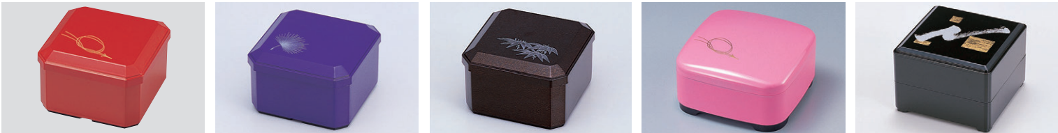
8-805-28 F-270 [A]3.8寸隅切重 朱柳結び(内黒) ¥470 (11.5×11.5×7.2) 櫃300 8-805-29 H-148-4 [A]3.8寸隅切重 紫松葉(内黒) ¥470 (11.5×11.5×7.2) 櫃300 8-805-30 H-148-2 [A]3.8寸隅切重 梨地笹(内黒) ¥470 (11.5×11.5×7.2) 櫃300 8-805-31 F-271 [A]みどり重 ピンク柳結び(内黒) ¥550 (12×11.8×5.7) 櫃300 8-805-32 H-148-20 [A]4.5寸重 黒一筆(内黒) 1段 ¥650 (13.4×13.4×5.6) 櫃200 2段 ¥980 (13.4×13.4×9.6) 櫃100 3段 ¥1,310 (13.4×13.4×13.7) 櫃70