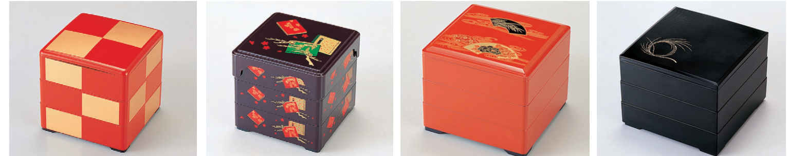
8-806-1 [A]5.5寸重 朱に金市松 1-459-23 3段 ¥2,200 (16.5×16.5×16) 櫃30 1-459-24 2段 ¥1,650 (16.5×16.5×11.5) 櫃40 8-806-2 [A]5.5寸重 マルーン万葉(箱籠型) 1-459-27 3段 ¥2,600 (17.2×17.2×15.6) 櫃30 1-459-28 2段 ¥1,950 (17.2×17.2×11.9) 櫃40 8-806-3 [A]6寸重 朱に扇面 1-459-29 3段 ¥2,050 (18.1×18.1×15) 櫃30 1-459-30 2段 ¥1,650 (18.1×18.1×10.8) 櫃40 8-806-4 [A]6.5寸千筋重 黒に柳結び 1-459-31 3段 ¥2,350 (19.5×19.5×16.5) 櫃20 1-459-32 2段 ¥1,750 (19.5×19.5×11.3) 櫃30