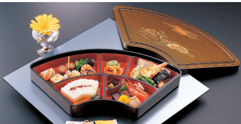
8-783-26 A(大)扇型弁当 梨地扇面天黒 (仕切付) 1-425-1 ¥8,000 (47.5×23.5×5.5) 幅10