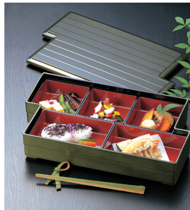
8-784-8 A筏弁当 グリーン F-2-77 蓋 ¥2,050 (37.2×22.8×1.6) 幅80 F-2-78 親 ¥2,150 (37.2×22.5×6.5) 幅40