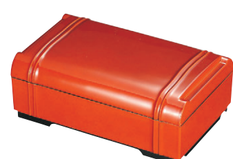
8-783-28 A竹型弁当 春慶 (仕切別) F-3-45 ¥2,350 (25×15.8×10) 幅40