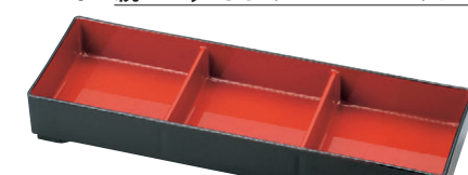
8-784-12 F-2-84 A筏弁当用大仕切三ツ仕切 内朱天黒 1ヶ ¥1,200 (32.8×10.8×4.6)