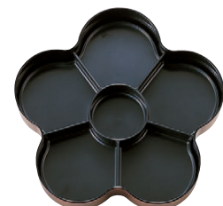
8-783-6 1-423-4 A光梅弁当用仕切 黒 ¥1,100 (30.8×27.6×3.4) 幅20