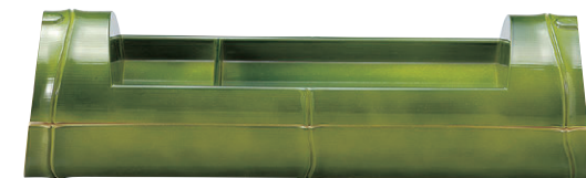
8-784-1 A竹姫弁当 グリーン 上段 1-519-1 ¥2,700 (36.1×10.3×5.9)