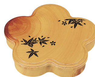
8-783-5 1-423-3 A光梅弁当 花梨春秋内黒塗 (仕切別) ¥8,000 (33×30×5.9) 幅20