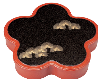
8-783-4 1-423-2 A光梅弁当 朱パール若松 (仕切別) ¥4,900 (33×30×5.9) 幅20