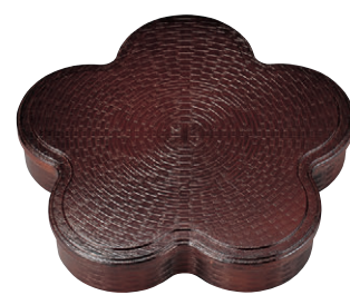
8-783-2 A竹目光梅弁当 溜 F-3-11A 蓋 ¥2,100 (33×30×2) 幅60 F-3-11 身 ¥2,700 (32×28.8×5.5) 幅30