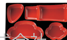
8-783-29 A竹型弁当用D.X仕切 朱天黒 F-3-16 ¥1,100 (24×14.7×3.6) 幅80