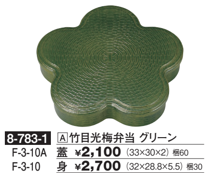
8-783-1 A竹目光梅弁当 グリーン F-3-10A 蓋 ¥2,100 (33×30×2) 幅60 F-3-10 身 ¥2,700 (32×28.8×5.5) 幅30