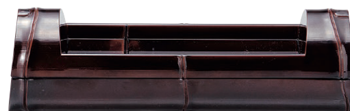
8-784-5 A竹姫弁当 溜内溜塗 上段 S-7-94 ¥2,700 (36.1×10.3×5.9)