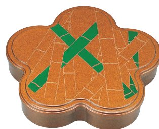
8-783-3 1-423-1 A光梅弁当 金梨地竹林 (仕切別) ¥4,700 (33×30×5.9) 幅20