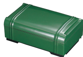
8-783-27 A竹型弁当 グリーン (仕切別) F-3-44 ¥2,000 (25×15.8×10) 幅40