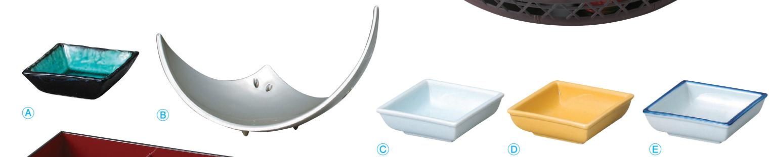
8-668-2 A C-5-75 陶 正角皿 ブルー ¥950 (8.8×8.8×2.8) 梱70 B M-14-14 A 三日月盛器 総銀塗 ¥3,400 (23.4×9.8×13.2) 梱80 C 1-338-24 陶 3寸角鉢 青磁 ¥1,100 (9.1×9.1×3) 梱100 D 1-338-26 陶 3寸角鉢 黄 ¥1,300 (9.1×9.1×3) 梱100 E 1-338-25 陶 3寸角鉢 濁紺 ¥1,150 (9.1×9.1×3) 梱100 F 1-302-10 A 泉寿弁当用3ツ仕切 溜パール内朱 ¥1,300 (31.5×10.9×5.5) 梱60 G C-5-76 陶 青磁ラスター舟型向上がり ¥2,500 (21.5×7.5×6) 梱50 H W-14-18 TA いぶし椀 漆調春慶(小) ¥1,500 (7.9φ×9.4) 梱100