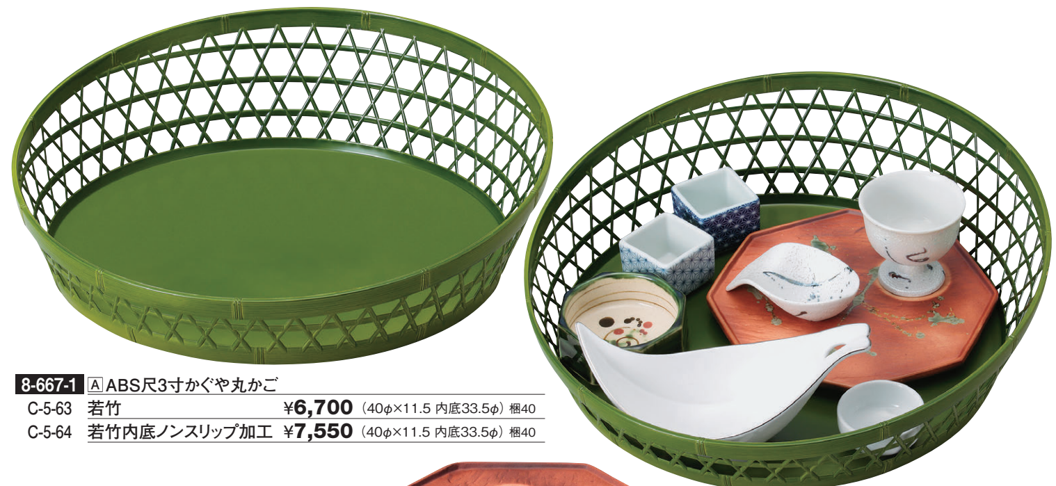
8-667-1 A ABS尺3寸かぐや丸かご C-5-63 若竹 ¥6,700 (40φ×11.5 内底33.5φ) 梱40 C-5-64 若竹内底ノンスリップ加工 ¥7,550 (40φ×11.5 内底33.5φ) 梱40