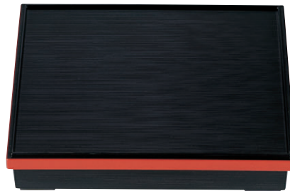
8-754-9 尺1寸長手千筋松花堂 1-369-3 黒瀾朱 (仕切別) ¥2,550 (31.3×26×6.6) 櫃20