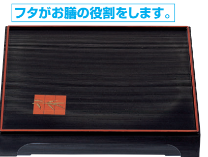
8-754-2 尺1寸長手御膳千筋松花堂 1-368-2 若竹 (仕切別) ¥3,200 (31.3×26×7) 櫃20