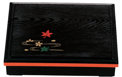
8-753-4 尺1寸長手木目松花堂 1-240-6 黒瀾朱春秋 (仕切別) ¥3,150 (31.5×26×7) 櫃20