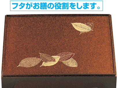
8-754-3 尺1寸長手御膳弁当 1-368-3 梨地木の葉 (仕切別) ¥3,700 (31×25.6×6.2) 櫃20