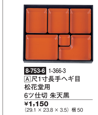
8-753-6 1-366-3 尺1寸長手へぎ目 松花堂用 6ツ仕切 朱天黒 ¥1,150 (29.1×23.8×3.5) 櫃50