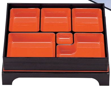
8-754-1 1-241-6 尺1寸長手御膳千筋松花堂 黒天朱 (仕切別) ¥2,850 (31.3×26×7) 櫃20