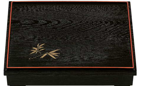
8-753-3 尺1寸長手松花堂 1-367-1 黒天朱笹 (仕切別) ¥2,900 (31.3×26×6.8) 櫃20