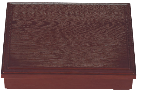
8-753-5 尺1寸長手木目松花堂 1-367-3 溜 (仕切別) ¥3,250 (31.5×26×7) 櫃20