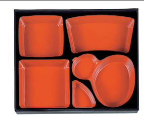
8-754-6 1-366-5 尺1寸長手御膳松花堂用 ひさご仕切 朱天黒 ¥1,350 (29.1×23.6×3.9) 櫃50