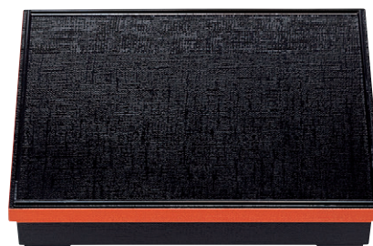
8-754-7 尺1寸長手布目松花堂 1-369-1 黒瀾朱 (仕切別) ¥2,650 (31.5×26×6.7) 櫃20