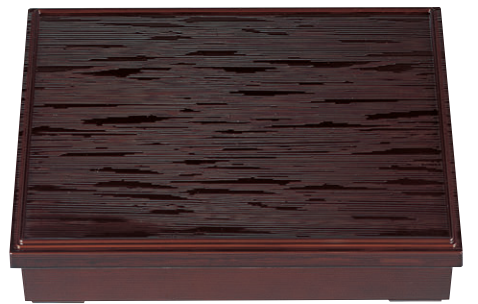
8-753-2 尺1寸長手へぎ目松花堂 1-241-5 溜 (仕切別) ¥2,850 (31.3×26×6.8) 櫃20