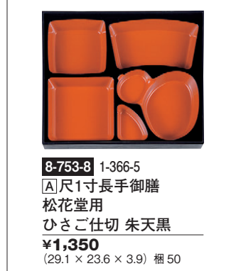
8-753-8 1-366-5 尺1寸長手御膳 松花堂用 ひさご仕切 朱天黒 ¥1,350 (29.1×23.6×3.9) 櫃50