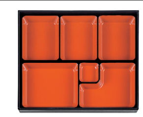
8-754-5 1-366-3 尺1寸長手へぎ目松花堂用 6ツ仕切 朱天黒 ¥1,150 (29.1×23.8×3.5) 櫃50