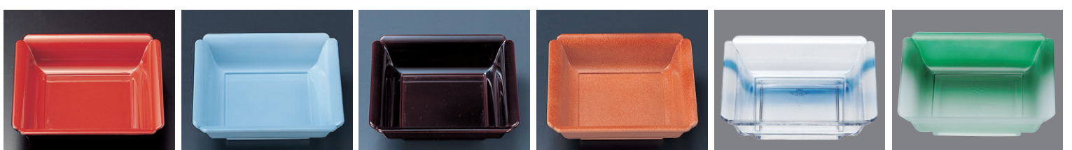
8-730-31 C-2-81 [TA]若狭角鉢 黒内朱 ¥800 (11.5×11.5×3.4) 櫃200 8-730-32 C-2-82 [TA]若狭角鉢 青磁 ¥900 (11.5×11.5×3.4) 櫃200 8-730-33 C-2-83 [TA]若狭角鉢 溜 ¥950 (11.5×11.5×3.4) 櫃200 8-730-34 C-2-84 [TA]若狭角鉢 茶しぶき ¥1,000 (11.5×11.5×3.4) 櫃200 8-730-35 C-3-94 [AC]若狭角鉢 涼一筆 ¥1,200 (11.5×11.5×3.4) 櫃200 8-730-36 C-3-95 [AC]若狭角鉢 淡雪吹グリーン ¥1,200 (11.5×11.5×3.4) 櫃200