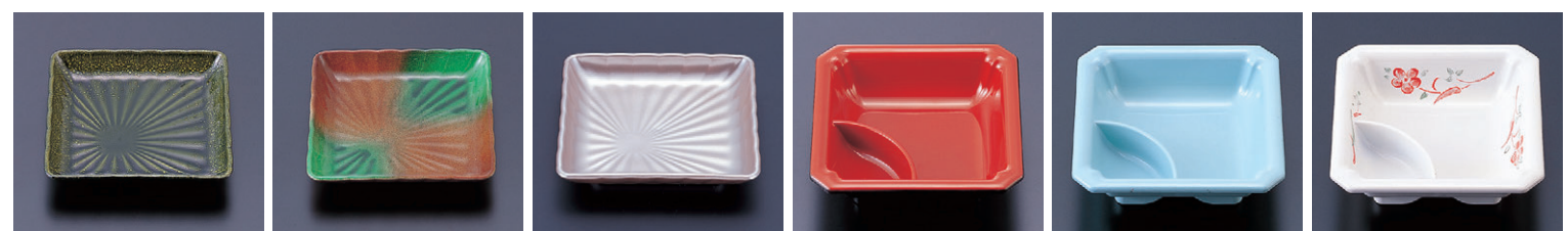
8-729-13 1-325-19 [A]菊角皿 織部 ¥950 (11.3×11.3×2) 櫃200 8-729-14 1-325-20 [A]菊角皿 若草織部 ¥1,100 (11.3×11.3×2) 櫃200 8-729-15 C-1-40 [A]菊角皿 銀塗 ¥1,450 (11.3×11.3×2) 櫃200 9-729-16 1-326-1 [TA]隅切タレ付角鉢 黒内朱 ¥800 (11.3×11.3×3.5) 櫃200 8-729-17 1-326-2 [TA]隅切タレ付角鉢 青磁 ¥850 (11.3×11.3×3.5) 櫃200 8-729-18 1-326-3 [TA]隅切タレ付角鉢 赤絵 ¥1,150 (11.3×11.3×3.5) 櫃200