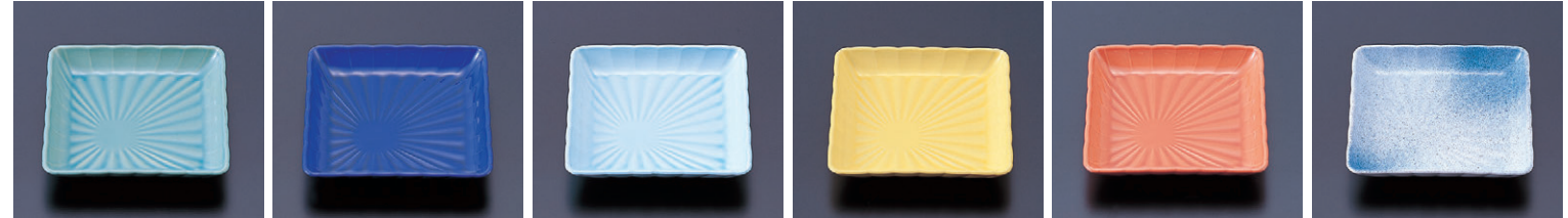
8-729-7 1-325-13 [A]菊角皿 ドイツ青磁 ¥800 (11.3×11.3×2) 櫃200 8-729-8 1-325-14 [A]菊角皿 瑠璃 ¥800 (11.3×11.3×2) 櫃200 8-729-9 1-325-15 [A]菊角皿 青磁 ¥800 (11.3×11.3×2) 櫃200 8-729-10 1-325-16 [A]菊角皿 淡黄 ¥800 (11.3×11.3×2) 櫃200 8-729-11 1-325-17 [A]菊角皿 柿釉 ¥800 (11.3×11.3×2) 櫃200 8-729-12 1-325-18 [A]菊角皿 吹墨 ¥950 (11.3×11.3×2) 櫃200