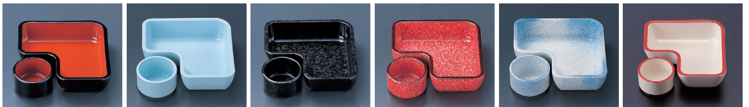
8-730-1 C-2-57 [TA]ABS鉢・千代久朱天黒セット ¥1,250 (11×11×3) 櫃100 8-730-2 C-2-58 千代久のみ 黒内朱天黒 ¥450 (4.8φ×2.9) 櫃200 8-730-3 C-2-59 [TA]ABS鉢・千代久青磁セット ¥1,230 (11×11×3) 櫃100 8-730-4 C-2-60 千代久のみ 青磁 ¥420 (4.8φ×2.9) 櫃200 8-730-5 C-2-61 [TA]ABS鉢・千代久油滴天目セット ¥1,800 (11×11×3) 櫃100 8-730-6 C-2-62 千代久のみ 油滴天目 ¥650 (4.8φ×2.9) 櫃200 8-730-7 C-2-63 [TA]ABS鉢・千代久赤染セット ¥1,800 (11×11×3) 櫃100 8-730-8 C-2-64 千代久のみ 赤染 ¥650 (4.8φ×2.9) 櫃200 8-730-9 C-2-65 [TA]ABS鉢・千代久吹墨セット ¥1,800 (11×11×3) 櫃100 8-730-10 C-2-66 千代久のみ 吹墨 ¥650 (4.8φ×2.9) 櫃200 8-730-11 1-331-1 [M]アイボリー天朱鉢・千代久付セット ¥1,650 (11×11×3.2) 櫃100 8-730-12 1-331-1A 千代久のみ アイボリー天朱 ¥500 (4.8φ×2.9) 櫃200