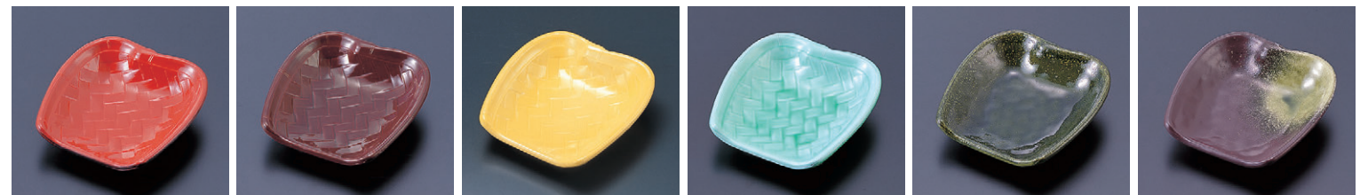
8-729-1 1-325-7 [A]ザル型鉢 朱 ¥950 (11×11.1×3.3) 櫃200 8-729-2 1-325-8 [A]ザル型鉢 溜 ¥1,050 (11×11.1×3.3) 櫃200 8-729-3 C-2-55 [A]ザル型鉢 黄 ¥1,150 (11×11.1×3.3) 櫃200 8-729-4 1-325-10 [A]ザル型鉢 ヒワグリーン ¥1,150 (11×11.1×3.3) 櫃200 8-729-5 1-325-11 [A]ザル型鉢 織部 ¥1,200 (11×11.1×3.3) 櫃200 8-729-6 1-325-12 [A]ザル型鉢 岩織部 ¥1,200 (11×11.1×3.3) 櫃200