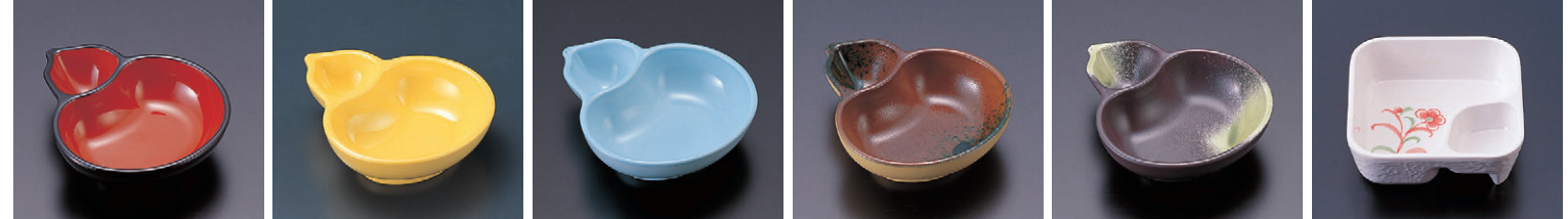
8-729-31 1-326-16 [TA]ひさごタレ付鉢 黒内朱天黒 ¥350 (12.8×10.8×3.5) 櫃200 8-729-32 C-2-56 [TA]ひさごタレ付鉢 黄 ¥900 (12.8×10.8×3.5) 櫃200 8-729-33 1-326-18 [TA]ひさごタレ付鉢 青磁 ¥900 (12.8×10.8×3.5) 櫃200 8-729-34 1-326-19 [TA]ひさごタレ付鉢 茶グリーン吹 ¥1,000 (12.8×10.8×3.5) 櫃200 8-729-35 1-326-20 [TA]ひさごタレ付鉢 岩織部 ¥1,000 (12.8×10.8×3.5) 櫃200 8-729-36 1-331-9 [M]タレ付角鉢 赤絵 ¥2,200 (11.1×11.1×3.5) 櫃200