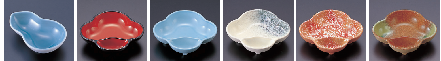
8-729-25 1-326-10 [M]ひさご鉢 青磁 ¥900 (12.8×8.7×3.3) 櫃200 8-729-26 1-326-11 [TA]タレ付梅型鉢 黒内朱天黒 ¥850 (13.3×11.8×3.5) 櫃200 8-729-27 1-326-12 [TA]タレ付梅型鉢 青磁 ¥900 (13.3×11.8×3.5) 櫃200 8-729-28 1-326-13 [TA]タレ付梅型鉢 志野 ¥1,050 (13.3×11.8×3.5) 櫃200 8-729-29 1-326-14 [TA]タレ付梅型鉢 赤志野 ¥1,050 (13.3×11.8×3.5) 櫃200 8-729-30 1-326-15 [TA]タレ付梅型鉢 若草織部 ¥1,150 (13.3×11.8×3.5) 櫃200