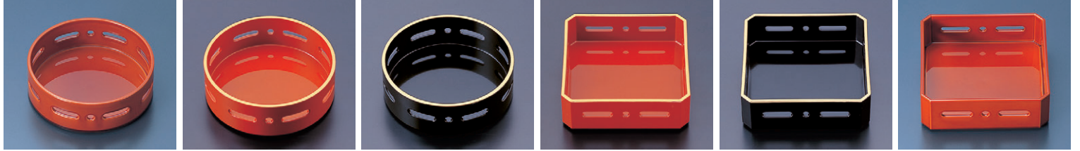
8-730-13 C-2-67 [A]丸透かし鉢 春慶 ¥1,300 (11.4φ×3.9) 櫃100 8-730-14 1-327-1 [A]丸透かし鉢 朱天金 ¥1,150 (11.4φ×3.9) 櫃100 8-730-15 1-327-2 [A]丸透かし鉢 黒天金 ¥1,150 (11.4φ×3.9) 櫃100 8-730-16 1-327-3 [A]隅切透かし鉢 朱天金 ¥1,200 (11.3×11.3×4) 櫃100 8-730-17 1-327-4 [A]隅切透かし鉢 黒天金 ¥1,200 (11.3×11.3×4) 櫃100 8-730-18 C-2-68 [A]隅切透かし鉢 春慶 ¥1,400 (11.3×11.3×4) 櫃100