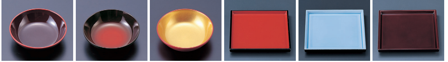
8-730-19 1-327-5 [M]丸鉢 溜天朱 ¥850 (11.2φ×3) 櫃200 8-730-20 1-327-6 [M]丸鉢 曙 ¥1,100 (11.2φ×3) 櫃200 8-730-21 1-327-7 [M]丸鉢 金雅 ¥1,950 (11.2φ×3) 櫃200 8-730-22 C-2-69 [A]正角皿 朱淵黒 ¥650 (11×11×1.2) 櫃200 8-730-23 C-2-71 [A]正角皿 青磁 ¥700 (11×11×1.2) 櫃200 8-730-24 C-2-70 [A]正角皿 溜 ¥900 (11×11×1.2) 櫃200