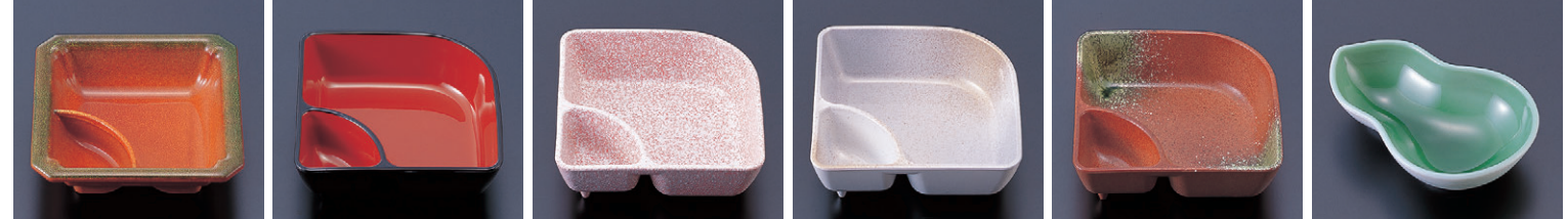
8-729-19 1-326-4 [TA]隅切タレ付角鉢 柿釉 ¥1,150 (11.3×11.3×3.5) 櫃200 8-729-20 1-326-5 [A]扇型タレ付鉢 黒内朱天黒 ¥800 (11.1×11.1×3.7) 櫃200 8-729-21 1-326-6 [A]扇型タレ付鉢 桜志野 ¥950 (11.1×11.1×3.7) 櫃200 8-729-22 1-326-7 [A]扇型タレ付鉢 金銀パール ¥950 (11.1×11.1×3.7) 櫃200 8-729-23 1-326-8 [A]扇型タレ付鉢 若草織部 ¥1,100 (11.1×11.1×3.7) 櫃200 8-729-24 1-326-9 [M]ひさご鉢 グリーン ¥900 (12.8×8.7×3.3) 櫃200