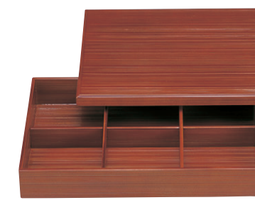
8-725-16 1-319-8 困尺3寸千筋松花堂 春慶 六ツ仕切付 ¥12,500 (37.9×26.5×6) 櫃10