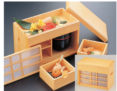
8-725-5 1-318-4 困石山弁当 ¥19,250 (24.7×13.6×18) 櫃10