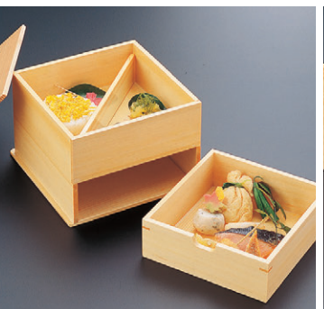
8-725-2 1-318-2 困花見弁当 ¥16,600 (18×17.8×12.7) 櫃20