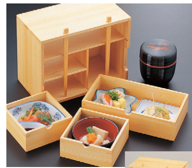
8-725-1 1-318-1 困野立弁当 ¥29,400 (26.1×14.8×2.17)