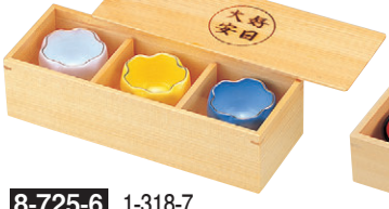
8-725-6 1-318-7 困白木3点珍味 (蓋付) 大安好日 ¥6,600 (25×9×6) 櫃40