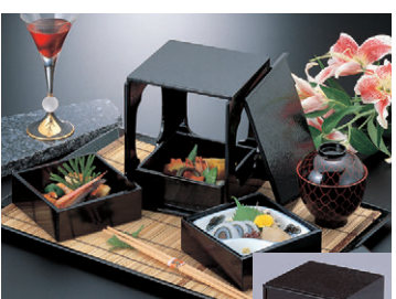
8-726-8 1-320-16 困野立て重箱 (オプション別) ¥11,500 (15×15×18) 櫃20