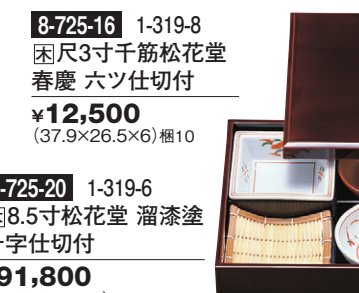
8-725-20 1-319-6 困8.5寸松花堂 溜漆塗 十字仕切付 ¥91,800 (26.5×26.5×6) 櫃20