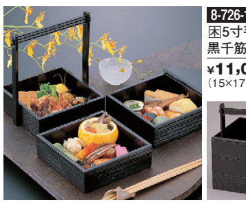
8-726-13 1-320-4 困5寸手提3段重 黒千筋 ¥11,000 (15×17.9×19.6) 櫃20