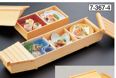
8-725-4 1-318-5 困屋形舟弁当 ¥28,800 (52×18.3×16.5) 櫃5