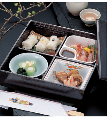
8-726-3 1-320-3 困8.5寸松花堂 外溜布目内千筋 オヤフタ 十字仕切付 ¥10,000 (26.5×26.5×6.3) 櫃20