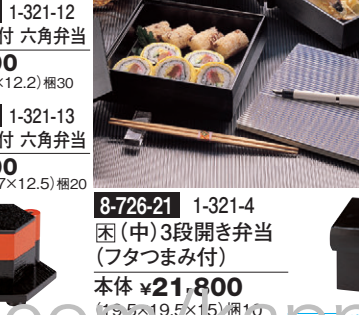
8-726-16 1-321-13 困(大)台付 六角弁当 ¥17,000 (23.8×20.7×12.5) 櫃20