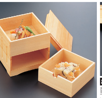
8-725-3 1-318-3 困一休弁当 ¥16,600 (15.3×15.3×15.5) 櫃20