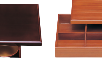
8-725-18 1-319-9 困8.5寸千筋松花堂 春慶 十字仕切付 ¥8,500 (26.5×26.5×6) 櫃20