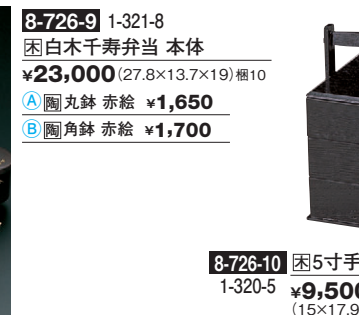
8-726-10 困5寸手提3段重 黒木目 1-320-5 ¥9,500 (15×17.9×19.6) 櫃20