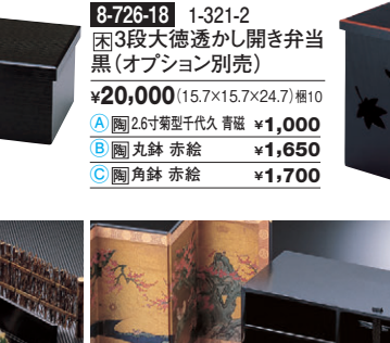
8-726-18 1-321-2 困3段大徳透かし開き弁当 黒 (オプション別売) ¥20,000 (15.7×15.7×24.7) 櫃10