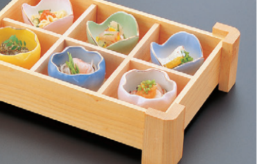
8-725-8 1-318-6 困白木6点珍味 ¥8,250 (28×20×7) 櫃30