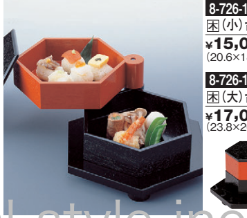
8-726-15 1-321-12 困(小)台付 六角弁当 ¥15,000 (20.6×18×12.2) 櫃30