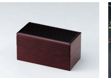
8-726-2 C-4-71 困長手カンナ目弁当 溜内朱2段 ¥7,100 (17×8.8×9)