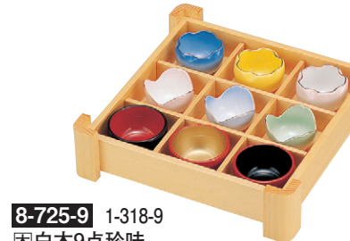
8-725-9 1-318-9 困白木9点珍味 ¥11,000 (28×28×7) 櫃20