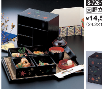
8-726-14 1-321-7 困野立て弁当 春秋 (中箱朱2ヶ・小仕切朱1ヶ) 本体 ¥14,500 (24.2×14.7×21.1) 櫃20