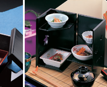
8-726-17 1-321-1 困(大)2段開き弁当 黒 (中箱朱2ヶ・小仕切朱1ヶ) 本体 ¥15,800 (18.5×18.5×14.5) 櫃20