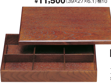
8-725-17 H-150-1 限定品 困尺3寸ケヤキ木目松花堂 六ツ仕切付 ¥4,300 (38.1×26.5×6) 櫃10