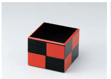
8-726-1 C-4-70 困4寸2段黒木松内朱弁当 T字仕切付 ¥6,750 (11.6×11.6×9)