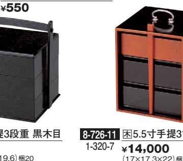
8-726-11 困5.5寸手提3色弁当 1-320-7 ¥14,000 (17×17.3×22) 櫃20