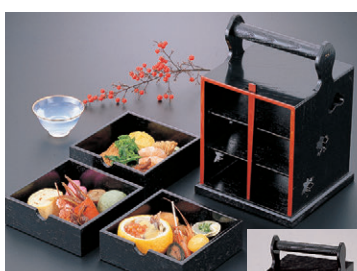
8-726-6 1-320-11 困(小)手提3ツ引野立弁当 ¥13,300 (15×16×24.5) 櫃20