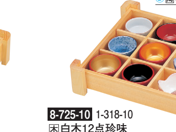
8-725-10 1-318-10 困白木12点珍味 ¥14,000 (36×28×7) 櫃10