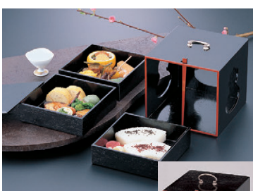
8-726-7 1-320-15 困手提野立3段重 (金具付) ¥11,900 (18.5×19×17) 櫃20