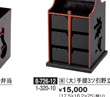
8-726-12 困(大)手提3ツ引野立弁当 1-320-10 ¥15,000 (17.5×16.2×25) 櫃10