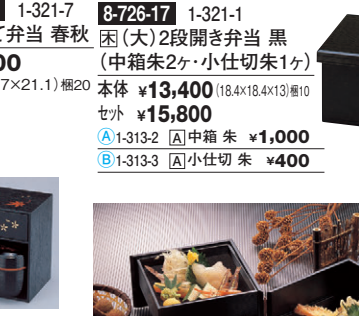
8-726-17 1-321-1 困(大)2段開き弁当 黒 (中箱朱2ヶ・小仕切朱1ヶ) 本体 ¥15,800 (18.4×18.4×13) 櫃10