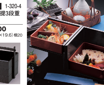
8-726-14 1-321-7 困野立て弁当 春秋 (中箱朱2ヶ・小仕切朱1ヶ) 本体 ¥13,400 (18.4×18.4×13) 櫃10