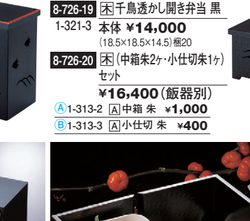
8-726-20 困(中箱朱2ヶ・小仕切朱1ヶ) セト ¥16,400 (飯器別)