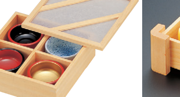
8-725-7 1-318-8 困白木5寸角珍味 (蓋付) ¥4,800 (15.5×15.5×5.5) 櫃40