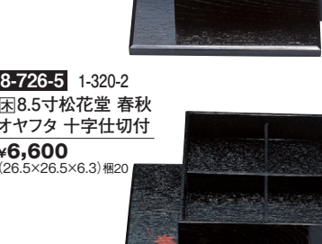
8-726-5 1-320-2 困8.5寸松花堂 春秋 オヤフタ 十字仕切付 ¥6,600 (26.5×26.5×6.3) 櫃20