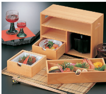
8-726-9 1-321-8 困白木千寿弁当 本体 ¥23,000 (27.8×13.7×19) 櫃10