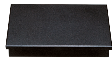
8-725-15 困尺3寸松花堂 黒石目 1-319-7 六ツ仕切付 ¥11,500 (39×27×6.1) 櫃10