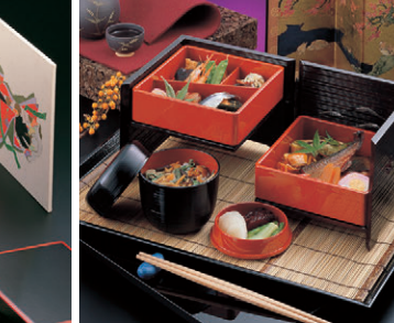
8-726-19 困千鳥透かし開き弁当 黒 1-321-3 本体 ¥14,000 (18.5×18.5×14.5) 櫃20