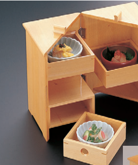
8-724-15 C-2-34 困白木9ツ仕切珍珠入 ¥16,500 (30×30×4.3) A 困2.6寸菊型鉢 吹墨 ¥650 B 困2.6寸菊型鉢 黄 ¥500 C 困2.6寸菊型鉢 ヒワグリーン ¥500 D 困チューリップ珍珠 グリーン ¥550 E 困チューリップ珍珠 ピンク ¥550 F 困チューリップ珍珠 ブルー ¥550 G 困ミニ丸鉢 朱内金 ¥630 H 困ミニ丸鉢 朱内黒 ¥500 I 困ミニ丸鉢 朱内朱 ¥500 J 困ミニ丸鉢 朱内朱 ¥500