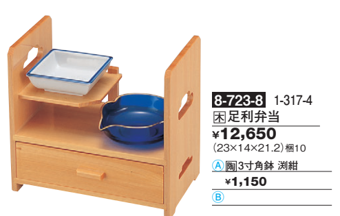
8-723-8 1-317-4 困足利弁当 ¥12,650 (23×14×21.2) 横10 A 困3寸角鉢 測紺 ¥1,150 B 困3寸角鉢 測紺 ¥1,150