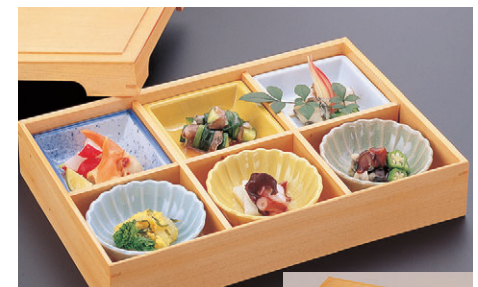
8-723-3 困山海弁当(小) 1-317-9 ¥15,000 (32.2×22×6) 横20 A 困3寸角鉢 吹墨 ¥1,400 B 困3寸角鉢 黄 ¥1,300 C 困3寸角鉢 青磁 ¥1,100 D 困3寸菊型千代久 青磁 ¥1,000 E 困3寸菊型千代久 黄 ¥1,000 F 困3寸菊型千代久 ヒワ ¥1,000