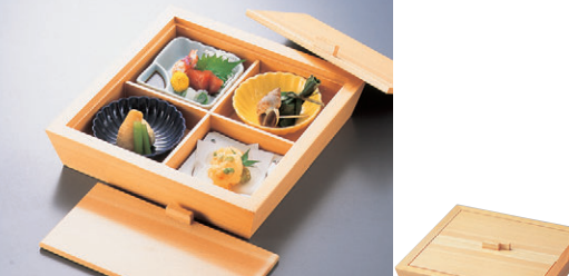
8-724-6 困白木舟型4ツ仕切松花堂 C-2-25 ¥15,000 (28.5×28.5×7.3) A 困ABS3.8寸菊鉢 黄 ¥630 B 困ABS3.8寸菊鉢 黄 ¥630 C 困ABS3.8寸菊鉢 瑠璃 ¥630 D 困陶甲皿 春秋 黄 ¥2,000