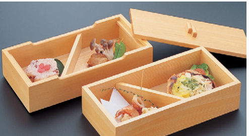
8-723-7 1-317-8 困石切弁当 2段 ¥13,900 (26.3×13×13.5) 横20