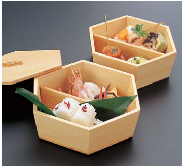
8-724-14 C-2-35 困白木 12ヶ仕切珍珠入 ¥18,500 (38.5×29.8×4.3) A 困2.3寸丸鉢 黒内朱 ¥400 B 困2.3寸丸鉢 朱内金雅 ¥950 C 困2.3寸丸鉢 朱内黒 ¥400 D 困2.3寸丸鉢 朱内金 ¥600 E 困2.6寸菊型鉢 瑠璃 ¥500 F 困2.6寸菊型鉢 青磁 ¥500 G 困2.6寸菊型鉢 溜 ¥500 H 困2.6寸菊型鉢 金雅 ¥1,100 I 困桜型陶器 ブルー ¥1,250 J 困桜型陶器 黄 ¥1,250 K 困桜型陶器 黄 ¥1,250 L 困桜型陶器 黄 ¥1,250