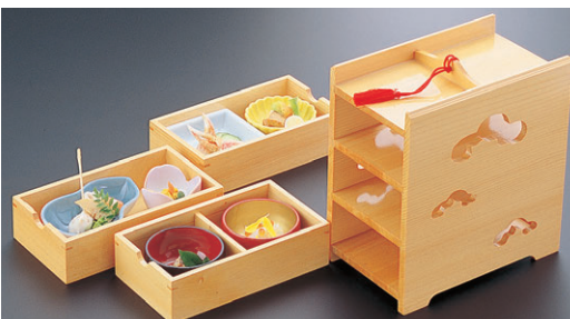
8-723-2 困3段引き出し弁当 1-316-2 ¥19,800 (21×12.5×20.5) 横20 A 困3寸角鉢 青磁 ¥1,100 B 困2.6寸菊型千代久 黄 ¥1,000 C 困ひさご鉢 青磁 ¥900 D 困チューリップ珍珠 ピンク ¥1,100 E 困2.6寸丸鉢 黒内朱 ¥450 F 困2.6寸丸鉢 朱内金 ¥800