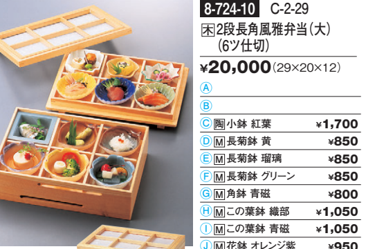
8-724-10 C-2-29 困2段長角風雅弁当(大) (6ツ仕切) ¥20,000 (29×20×12) A 困小鉢 紅葉 ¥1,700 B 困長菊鉢 黄 ¥850 C 困長菊鉢 瑠璃 ¥850 D 困長菊鉢 青磁 ¥850 E 困長菊鉢 青磁 ¥850 F 困長菊鉢 青磁 ¥850 G 困長菊鉢 青磁 ¥850 H 困この葉鉢 織部 ¥1,050 I 困この葉鉢 青磁 ¥1,050 J 困この葉鉢 青磁 ¥1,050 K 困この葉鉢 青磁 ¥1,050 L 困この葉鉢 青磁 ¥1,050