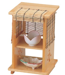
8-723-6 困近江路すだれ付 1-317-7 ¥14,000 (15×15×23) 横20 A 困チューリップ珍珠 ピンク ¥1,250 B 困小鉢 紅葉 ¥1,700