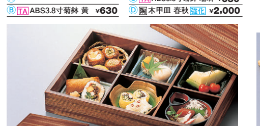
8-724-9 困杉茶色尺3寸長手松花堂 セットでつみ重ね C-2-28 ¥18,500 (40×28×6.8) A 困丸かご(底板付) ¥550 B 困竹割り皿 清流 ¥1,450 C 困隅切角鉢 織部 ¥1,050 D 困竹彫角皿 青磁 ¥1,000 E 困四ツ山小鉢 若草端 ¥1,100 F 困ひさご付鉢 黒内朱天黒 ¥850