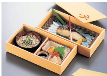
8-724-1 C-2-20 困白木長手松花堂 松 2段 ¥12,000 (25.5×13.6×11.1) A 困菊型長角皿 清流 ¥1,950 B 困タイコ丸鉢 黒内朱天黒 ¥900 C 困アイボリー天来L鉢・千代久付セット ¥1,650