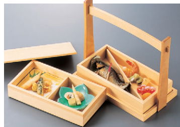
8-724-3 困白木手提 C-2-22 2段長手松花堂 ¥21,000 (31.5×15.7×26.2) A 困菊角皿 淡黄 ¥800 B 困新もじ皿 ヒワグリーン ¥1,150