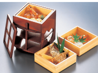
8-724-2 困3段弁当 C-2-21 ひさご障子蓋 ¥18,500 (16×15.5×19.7)