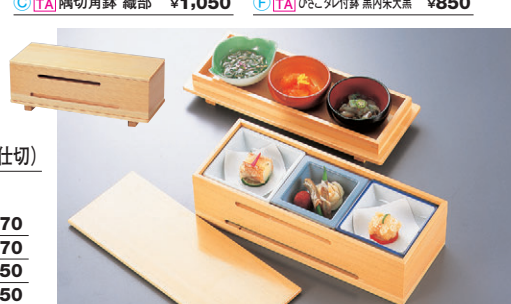
8-724-12 C-2-32 困2段長角風雅弁当(小) ¥15,000 (29×11.3×11.5) A 困この葉鉢 グリーン ¥750 B 困2.6寸丸鉢 朱内金雅 ¥1,100 C 困2.6寸丸鉢 黒内朱 ¥450 D 困3寸角鉢 青磁 ¥1,100 E 困角鉢 青磁 ¥800 F 困3寸角鉢 測紺 ¥1,150