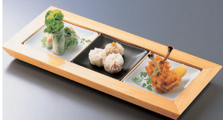
8-724-5 困白木舟型盛器(陶器3ヶ付セット) C-2-24 ¥17,000 (43.7×19×3.6)