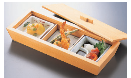
8-724-4 C-2-23 困白木舟型 3ツ仕切松花堂 ¥13,500 (40.5×16.2×7.5) A 困竹彫角皿 青磁 ¥1,000 C 困ゴースト仕切付鉢 ¥1,600