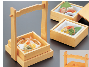
8-723-4 困手付正角弁当 1-316-4 ¥15,400 (20×16×26) 横10 A 困ゴースト仕切付鉢 ¥1,600 B 困丸かご ¥480