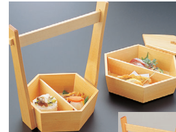
8-723-5 1-316-5 困手桶2段弁当 ¥17,100 (25.2×20.7×26) 横10