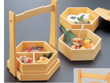
8-723-9 1-316-3 困六角手提げ弁当 ¥16,500 (20.1×20×26) 横10