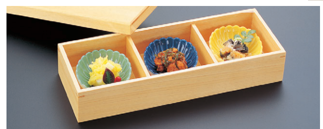
8-723-13 困3ツ仕切弁当 1-316-9 ¥9,450 (32.6×12.5×6) 横30 A 困長菊鉢 グリーン ¥850 B 困長菊鉢 瑠璃 ¥850 C 困長菊鉢 黄 ¥850