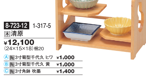
8-723-12 1-317-5 困清原 ¥12,100 (24×15×18) 横20 A 困3寸菊型千代久 ヒワ ¥1,000 B 困3寸菊型千代久 黄 ¥1,000 C 困3寸角鉢 吹墨 ¥1,400