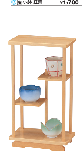
8-723-11 困白木とまり木 1-317-6 ¥6,600 (17×10×30) 横20 A 困(大)ぼんぼり ¥1,400 B 困桜型陶器 ブルー ¥1,250 C 困チューリップ珍珠 グリーン ¥1,250