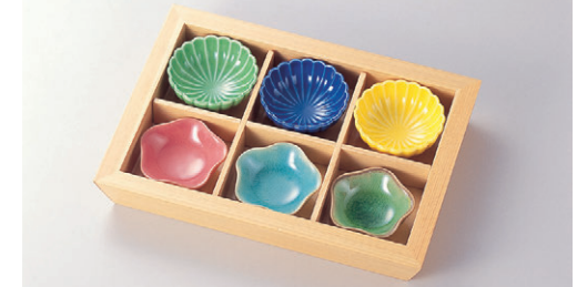
8-724-13 困白木6ツ仕切珍珠入 C-2-33 ¥13,750 (28.8×21×4.3) A 困2.6寸菊型千代久 グリーン ¥850 B 困2.6寸菊型千代久 瑠璃 ¥1,000 C 困2.6寸菊型千代久 黄 ¥1,000 D 困2.6寸菊型千代久 黄 ¥1,000 E 困2.6寸菊型千代久 黄 ¥1,000 F 困2.6寸菊型千代久 黄 ¥1,000