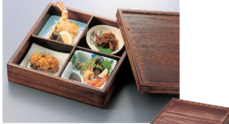
8-724-8 困杉茶色8.5寸松花堂 C-2-27 ¥15,000 (28.2×28.2×6.8) A 困菊角皿 青磁 ¥800 B 困はまぐり鉢 赤絵 藍化 ¥2,150 C 困四方上り皿 グリーン吹調金 ¥2,250 D 困仕切鉢 錦紅葉 ¥2,000