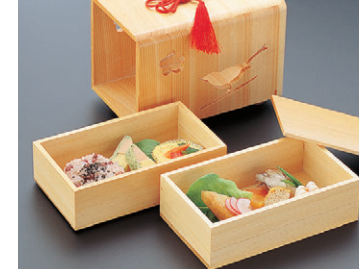
8-723-10 1-316-6 困弥生弁当 ウグイス ¥15,000 (18×11.2×12.8) 横20