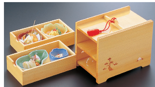
8-723-1 困2段引き出し弁当 1-316-1 ¥18,150 (21×12.5×18) 横20 A 困この葉鉢 織部 ¥1,050 B 困花鉢 オレンジグリーン ¥950 C 困ひさご鉢 グリーン ¥900 D 困桜型陶器 ブルー ¥1,100