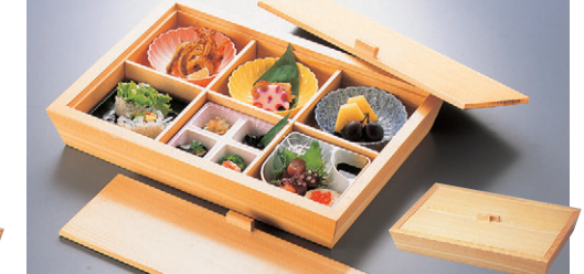
8-724-7 困白木舟型6ツ仕切松花堂 C-2-26 ¥21,000 (40×28.5×7.2) A 困ABS3.8寸菊鉢 ピンク ¥700 B 困ABS3.8寸菊鉢 黄 ¥630 C 困3.8寸菊型鉢 吹墨 ¥1,350 D 困菊角皿 織部 ¥950 E 困D.X四ツ仕切角鉢 桜志野 ¥950 F 困ABS3.8寸菊鉢 黄 ¥630 G 困ABS3.8寸菊鉢 黄 ¥630 H 困ABS3.8寸菊鉢 黄 ¥630 I 困ABS3.8寸菊鉢 黄 ¥630 J 困ABS3.8寸菊鉢 黄 ¥630 K 困ABS3.8寸菊鉢 黄 ¥630 L 困ABS3.8寸菊鉢 黄 ¥630