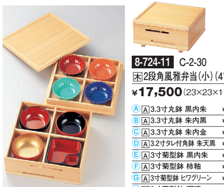
8-724-11 C-2-30 困2段角風雅弁当(小) (4ツ仕切) ¥17,500 (23×23×11) A 困3.3寸丸鉢 黒内朱 ¥470 B 困3.3寸丸鉢 朱内黒 ¥470 C 困3.3寸丸鉢 朱内金 ¥850 D 困3.2寸丸付角鉢 朱天黒 ¥650 E 困3寸菊型鉢 黒内朱 ¥600 F 困3寸菊型鉢 柿釉 ¥600 G 困3寸菊型鉢 ヒワグリーン ¥600 H 困3寸菊型鉢 瑠璃 ¥600