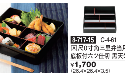
8-717-15 C-4-61 尺0寸角三里弁当用底板付六ツ仕切 黒天朱 ¥1,700 (26.4×26.4×3.5)