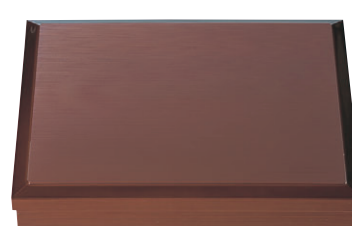
8-717-4 1-306-2 尺1寸長手松花堂用 十字仕切 黒 ¥600