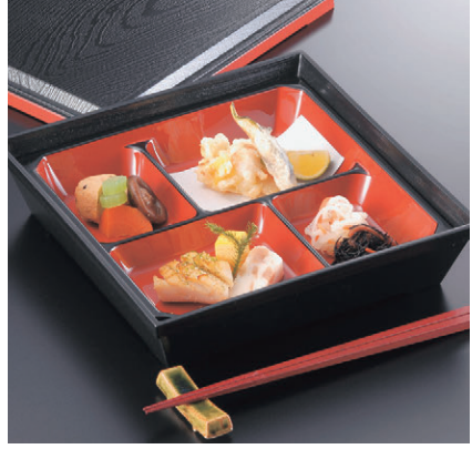
8-718-9 C-3-50 尺7.5寸泉重松花堂用 十字仕切 ¥340