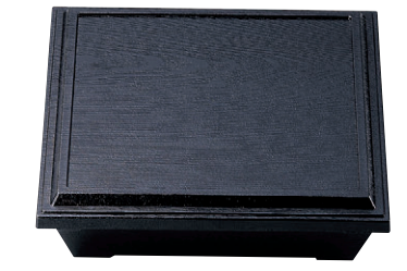
8-718-5 尺7.5寸泉重松花堂 C-3-42 新黒石目(仕切別) ¥2,100 (23.4×23.4×6.4) 横40