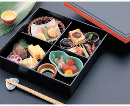
V 1-307-1J 丸竹かご染 限定品 ¥1,600 (12.7φ×2.5) W 1-339-28 尺1寸長手松花堂用朱内金 ¥630 (6.3φ×3.1) X 1-326-9 尺1寸長手松花堂用ヒワグリーン ¥900 (12.8×8.7×3.3)