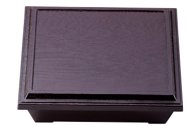
8-718-3 尺7.5寸泉重松花堂 C-3-40 新溜(仕切別) ¥2,050 (23.4×23.4×6.4) 横40