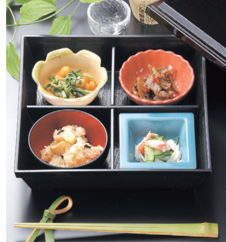
7.5寸松花堂 オプション