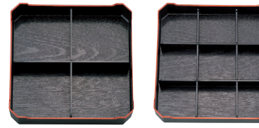
8-717-11 1-307-3 尺0寸角松花堂用十字仕切 ¥600