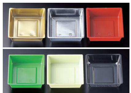
ワンウェーブブロック仕切 (御注文は100入単位でお願いします)