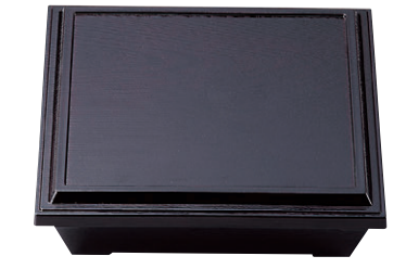
8-718-7 尺7.5寸泉重松花堂 C-3-44 溜(仕切別) ¥2,500 (23.4×23.4×6.4) 横40