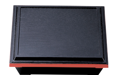
8-718-1 尺7.5寸泉重松花堂 C-3-38 黒淵朱(仕切別) ¥2,050 (23.4×23.4×6.4) 横40