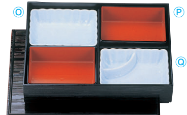
8-717-7 尺9寸長手松花堂 1-238-5 黒ヘギ目淵朱(仕切別) ¥1,400 (27.2×21.1×6) 横40