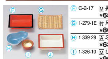
F C-2-17 長角鉢 朱天黒 ¥650 (13.9×10.8×3.3) G 1-279-1E 尺1寸長手松花堂用長竹皿 ¥800 (14×11×2.5) H 1-339-28 尺1寸長手松花堂用朱内金 ¥630 (6.3φ×3.1) I 1-326-10 ひさご鉢 青磁 ¥900 (12.8×8.7×3.3) J C-2-18 長角鉢 白天朱 ¥700 (13.9×10.8×3.3)