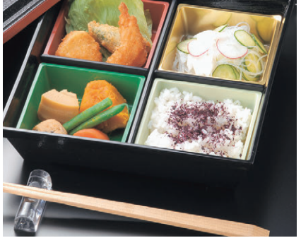
8-718-14 C-3-49 尺7.5寸超耐熱泉重松花堂用 4ツ仕切 黒天朱 ¥1,700 (20.5×20.5×3.4) 横100