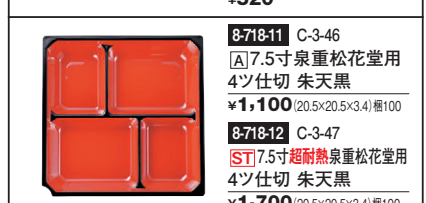
8-718-11 C-3-46 尺7.5寸泉重松花堂用 4ツ仕切 朱天黒 ¥1,100 (20.5×20.5×3.4) 横100