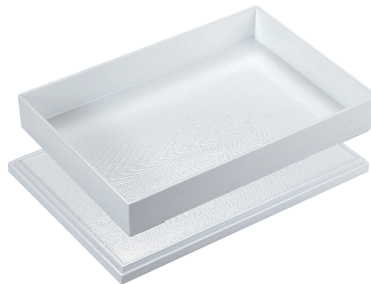
8-678-3 A ニュー尺3寸長手木目松花堂 総白塗 蓋 C-4-82 ¥1,800 (38.5×26.5×2.2) 櫃50 C-4-83 A ニュー尺3寸長手木目松花堂 総白塗 身 ¥3,550 (37×25.2×5.7) 櫃24