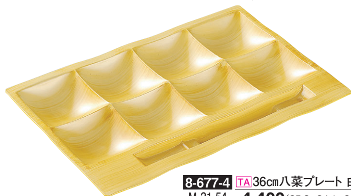
8-677-4 TA 36cm 八菜プレート 白木(箸置付) M-21-54 ¥4,400 (35.8×24.1×3.4) 櫃40