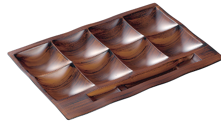
8-678-1 TA 36cm 八菜プレート 紫檀(箸置付) M-21-55 ¥4,800 (35.8×24.1×3.4) 櫃40