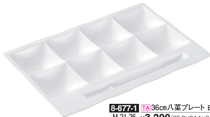
8-677-1 TA 36cm 八菜プレート 白(箸置付) M-21-26 ¥3,200 (35.8×24.1×3.4) 櫃40