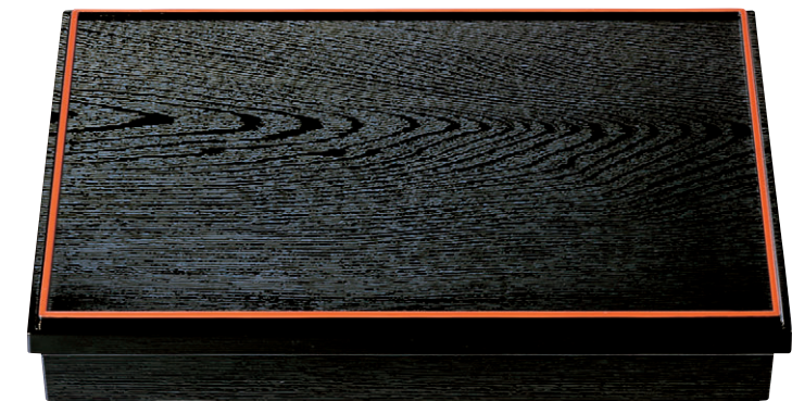
8-678-4 A ニュー尺3寸長手木目松花堂 黒天朱 蓋 C-4-84 ¥1,300 (38.5×26.5×2.2) 櫃50 C-1-2 A ニュー尺3寸長手木目松花堂 黒 身 ¥1,600 (37×25.2×5.7) 櫃24