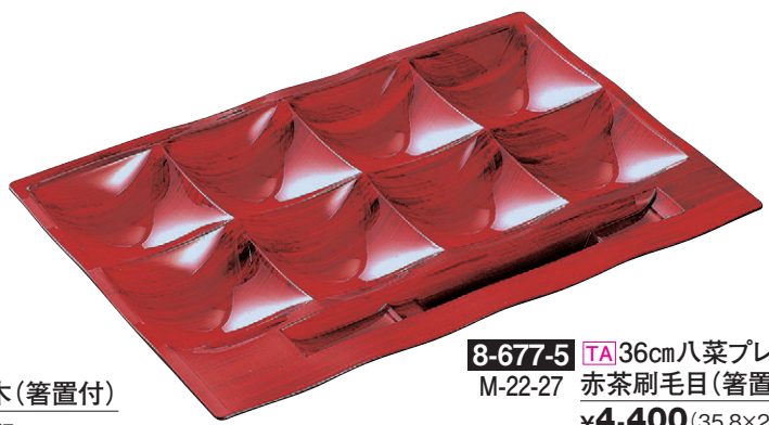
8-677-5 TA 36cm 八菜プレート 赤茶刷毛目(箸置付) M-22-27 ¥4,400 (35.8×24.1×3.4) 櫃40