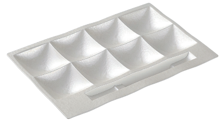
8-678-2 TA 36cm 八菜プレート 白アクリル(箸置付) M-22-28 ¥4,800 (35.8×24.1×3.4) 櫃40