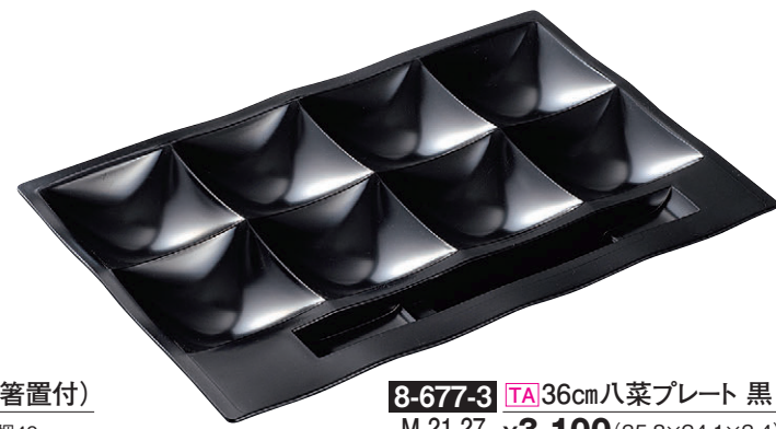
8-677-3 TA 36cm 八菜プレート 黒(箸置付) M-21-27 ¥3,100 (35.8×24.1×3.4) 櫃40