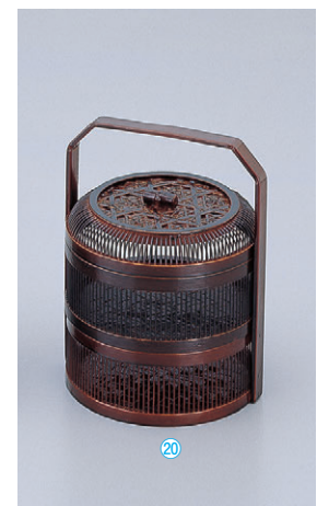
8-656-20 1-750-19 困ミニ二段重 直送 ¥6,300 (14φ×19) 梱30