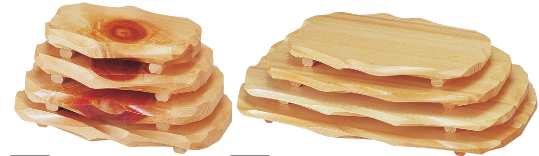
8-656-7 困節付日野盛台 1-743-19 7寸 ¥4,550 (21.3×12.5×3) 梱20 1-743-20 8寸 ¥5,600 (24.3×15.2×3) 梱15 1-743-21 9寸 ¥7,200 (27×18.3×3) 梱10 1-743-22 尺0寸 ¥9,100 (29.9×18.3×3) 梱8