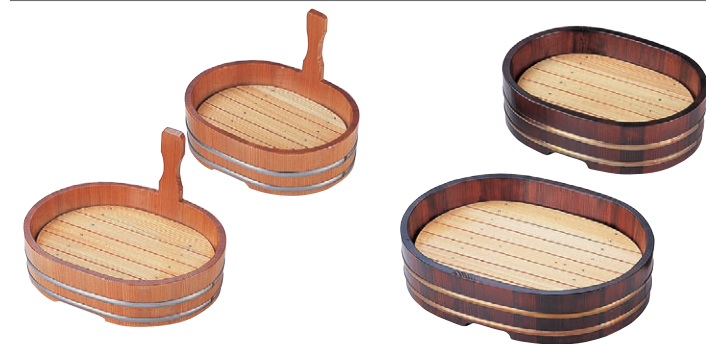
8-655-15 困小判片手桶(目皿付) M-13-41 7.5寸 ¥17,600 (23.5×18.5×16.5) 梱10 M-13-42 9寸 ¥20,300 (26.8×21.5×16.0) 梱10