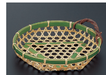
8-656-9 困(大)若竹 ユリカズラ 1-747-12 ¥2,800 (19φ×3) 梱100 限定品