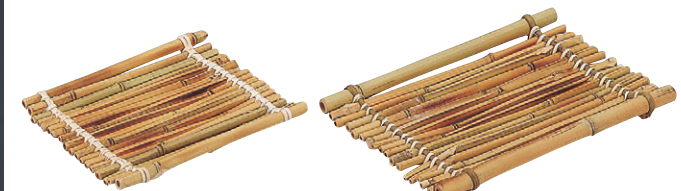
8-656-10 1-749-3 困鮎皿(小) ¥1,700 (17.5×13.5×2.5) 梱80