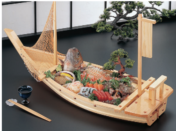
8-655-6 M-23-79 困川舟盛込舟(国産) ¥17,000 (37×16.3×9.2) 梱10