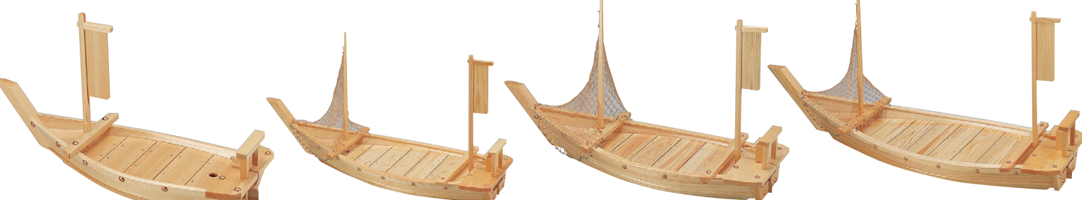
8-655-8 1-738-10 困2尺盛込舟(国産) ¥33,500 (60×20.4×35) 梱3