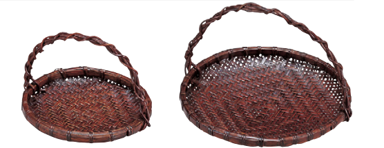
8-656-12 1-747-2 困溜塗白雲籠(小) 直送 ¥5,550 (16φ×14) 梱40