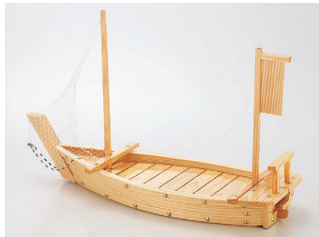
8-655-2 困2尺5寸豊漁舟(アミ付) O-6-60 ¥26,500 (75×25.5×47.8) 梱4