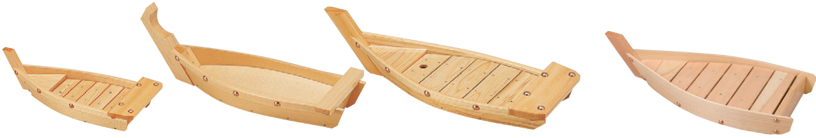
8-655-3 1-738-7 困1人盛込舟(国産) ¥11,000 (30×13.2×9.3) 梱10