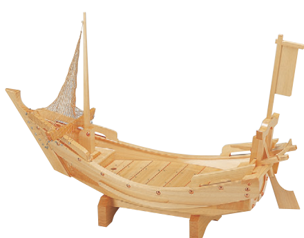
8-655-12 1-738-1 困3尺檜北前舟(国産)(網別売) ¥169,700 (90×31×38.2) 梱2