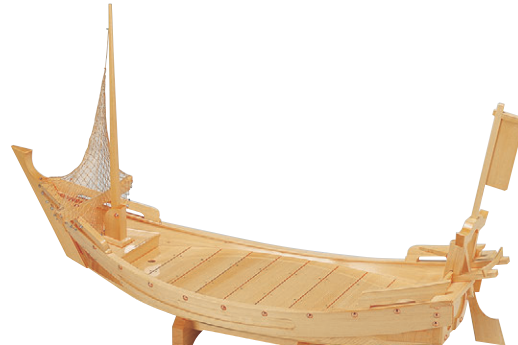
8-655-14 1-738-3 困4尺檜北前舟(国産)(網別売) ¥303,000 (120×39×39.5) 梱1