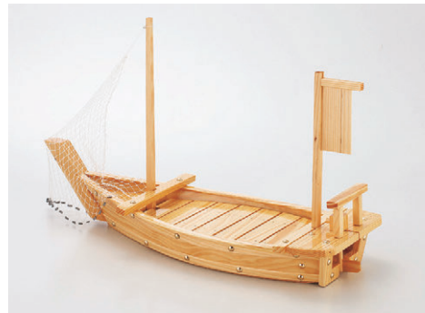
8-655-1 困2尺2寸豊漁舟(アミ付) O-6-59 ¥24,200 (66×24.4×40.6) 梱4