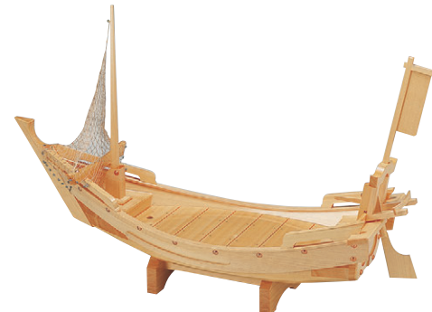
8-655-13 1-738-2 困3尺5寸檜北前舟(国産)(網別売) ¥182,000 (110×32.8×37.5) 梱2