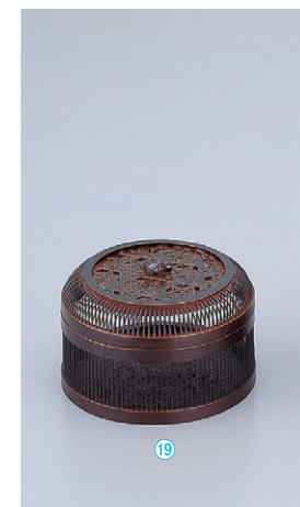
8-656-19 1-750-18 困菓子器 直送 ¥3,900 (14φ×8.5) 梱60