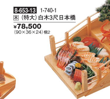
8-653-13 1-740-1 困 (特大) 白木3尺日本橋 ¥78,500 (90×36×24) 桶2