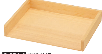
8-654-4 困造り板 1-745-30 (小) ¥5,000 (36×27×6) 桶10 1-745-31 (大) ¥6,350 (39×30×6) 桶10