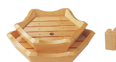
8-653-17 困六角盛器 白木 (目皿付) M-13-52 (小) ¥10,500 (23.5×20.5×5) 桶30