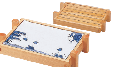
8-653-8 困 (中) 能登盛器 (表) 浜千鳥陶器 (裏) スノ子付 ¥32,750 (限定品) (40×27×9・陶板32.5×22.8) 桶2