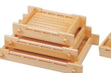
8-653-10 困桧盛込観梅 (小) M-3-52 ¥23,000 (38×28×6.4) 桶6