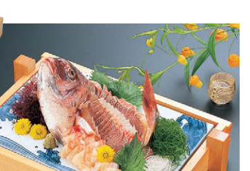
困桧両面盛込雲海 (中) M-3-53 ¥32,000 (45×33×7.3) 桶5