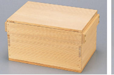
8-654-5 困角びつ 1-745-18 3升用 ¥36,500 (39×27×21.5) 桶3