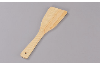
8-654-3 困桧サーバー (大) 30cm M-4-25 ¥900 (29) 桶100