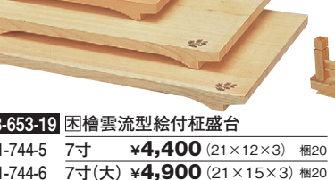
8-653-19 困檜雲流型桧付盛台 1-744-5 7寸 ¥4,400 (21×12×3) 桶20