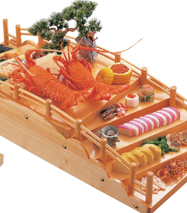
8-653-18 困イカダ型盛込台 1-744-2 尺0寸 ¥13,000 (30×24×8.5) 桶8