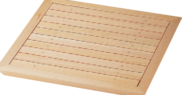
8-653-7 困菱舟角盛込器 (目皿付) M-13-40 ¥28,500 (43.8×43.8×3.9) 桶10