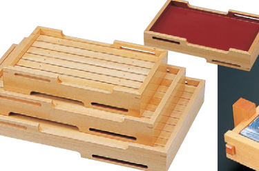
8-653-11 困桧両面盛込雲海 (小) M-3-58 ¥26,000 (38×22.5×6.8) 桶8