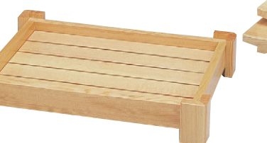
1-744-3 尺5寸 ¥21,000 (45×33×8.5) 桶3