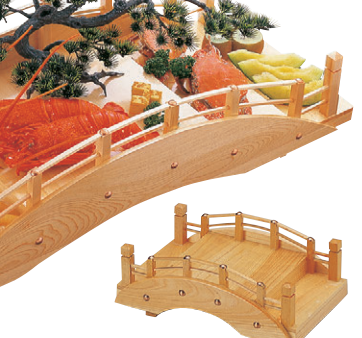
8-653-15 困 (特小) 白木9寸日本橋1人用 1-740-2 ¥23,000 (26×11×10) 桶10