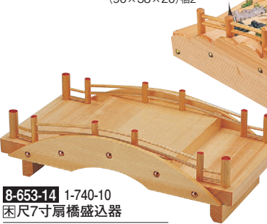
8-653-14 1-740-10 困尺7寸扇橋盛込器 ¥30,000 (50×25×18) 桶4