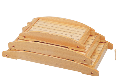
8-653-9 困桧盛込松嶋 (小) M-3-55 ¥22,500 (37.7×21×6.9) 桶8