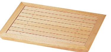
8-653-6 困菱舟長角盛込器 (目皿付) M-13-39 ¥20,500 (43.8×32.2×3.9) 桶10