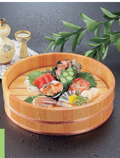
タガが抜けない新工法 (PAT)