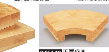
8-654-19 困扇盛皿 1-742-29 ¥5,000 (24×15×6) 桶15