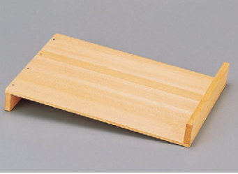
8-654-7 困造り板S型 1-745-28 (小) ¥4,400 (42×21×5.5) 桶20