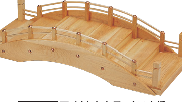
困 (小) 白木9寸日本橋 1-740-3 ¥27,500 (26×16×10) 桶10