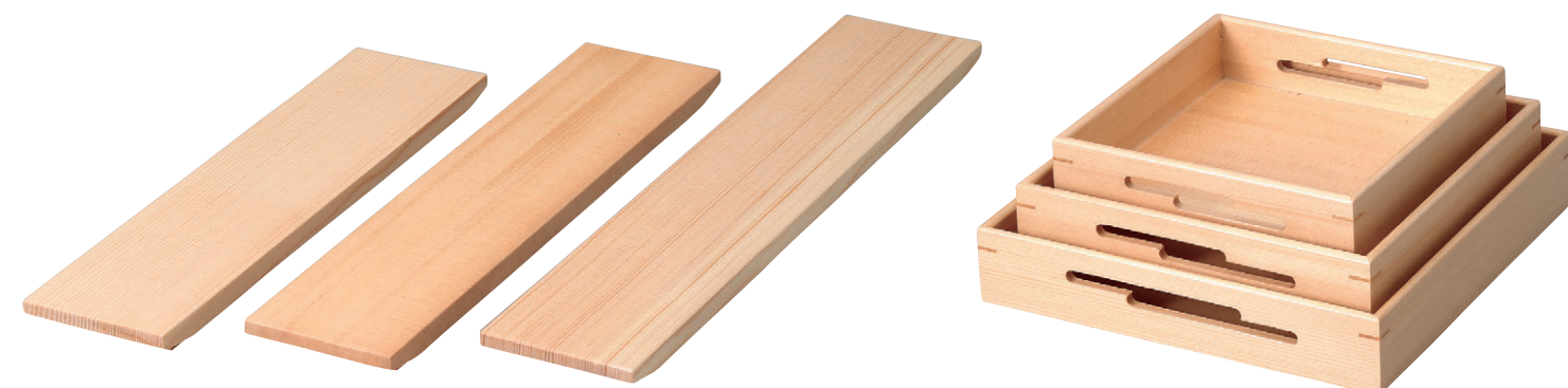
8-648-1 木製桃山長角盛台 M-25-35 (小) ¥3,500 (36×9×2.7) 櫃40 M-25-36 (中) ¥4,400 (39×9×2.7) 櫃30 M-25-37 (大) ¥5,500 (45×9×2.7) 櫃20 8-648-2 木製桃山透かし箱 M-25-38 (小) ¥5,000 (18.3×18.3×4.6) 櫃50 M-25-39 (中) ¥5,500 (21.3×21.3×4.6) 櫃40 M-25-40 (大) ¥6,400 (24.3×24.3×4.6) 櫃30