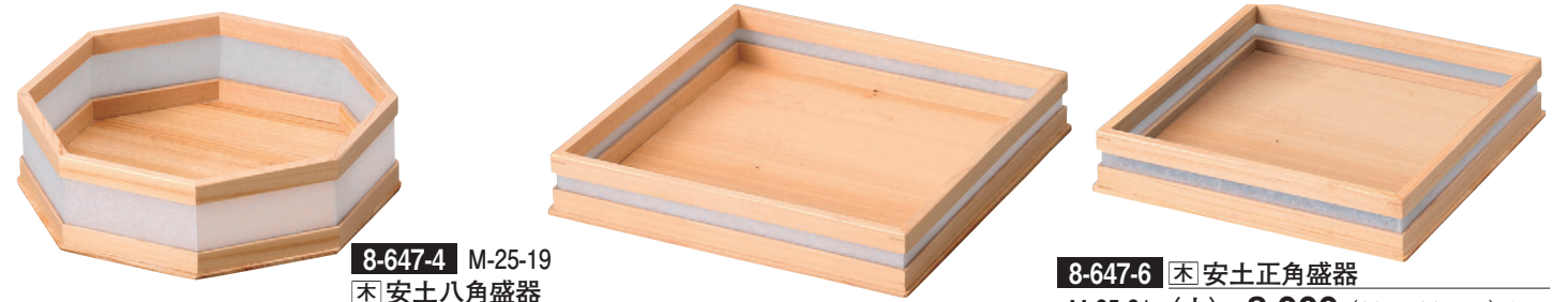
8-647-4 M-25-19 木製安土八角盛器 ¥9,400 (22×22×6) 櫃30 8-647-6 木製安土正角盛器 M-25-21 (小) ¥8,000 (20.5×20.5×4) 櫃40 M-25-23 (大) ¥9,100 (23.5×23.5×4) 櫃30