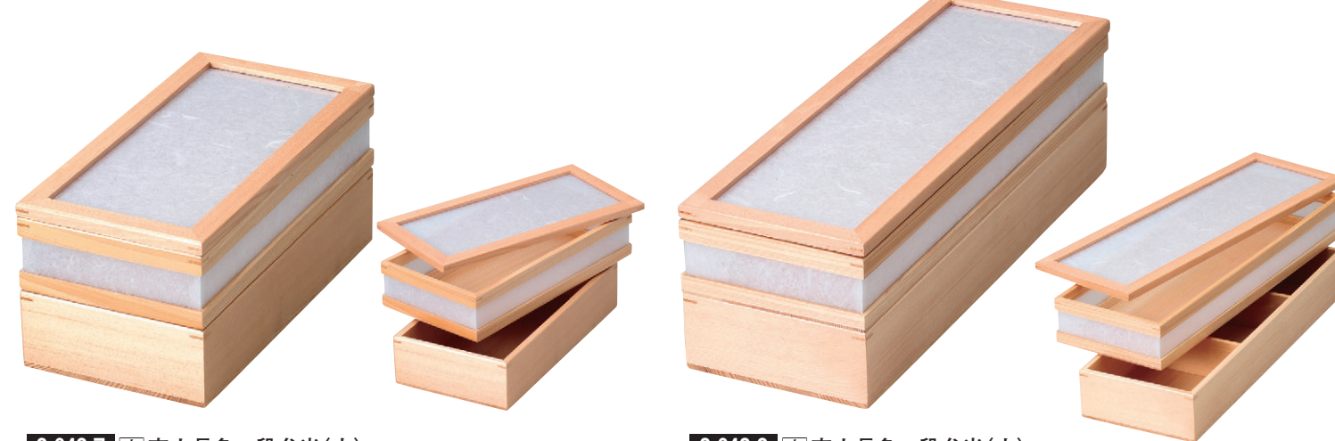
8-648-7 木製安土長角二段弁当(小) M-25-45 蓋 ¥2,200 (25.3×13×1.2) 櫃80 M-25-46 中段 ¥6,300 (25.2×13×5.4) 櫃40 M-25-47 下段 ¥5,800 (25.1×13×5.6) 櫃40 (下段仕切無) 8-648-8 木製安土長角二段弁当(大) M-25-48 蓋 ¥3,700 (37.2×13×1.2) 櫃60 M-25-49 中段 ¥8,400 (37.3×13×5.3) 櫃30 M-25-50 下段 ¥6,900 (37.3×13×5.6) 櫃30 (下段固定仕切 穴内寸11.5×11.5×5)