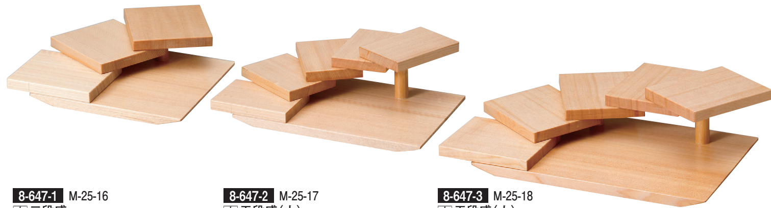
8-647-1 M-25-16 木製三段盛 ¥7,500 (25×23×5.5) 櫃15 8-647-2 M-25-17 木製五段盛(小) ¥9,000 (27.5×19.5×8.3) 櫃10 8-647-3 M-25-18 木製五段盛(大) ¥12,000 (37.5×25×8.7) 櫃5