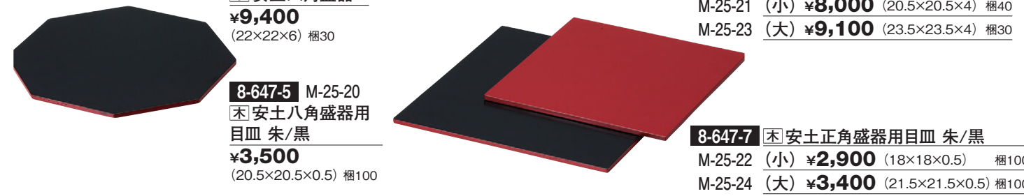
8-647-5 M-25-20 木製安土八角盛器用目皿 朱/黒 ¥3,500 (20.5×20.5×0.5) 櫃100 8-647-7 木製安土正角盛器用目皿 朱/黒 M-25-22 (小) ¥2,900 (18×18×0.5) 櫃100 M-25-24 (大) ¥3,400 (21.5×21.5×0.5) 櫃100