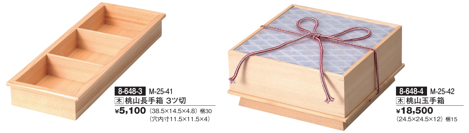
8-648-3 M-25-41 木製桃山長手箱 3ツ切 ¥5,100 (38.5×14.5×4.8) 櫃30 (穴内寸11.5×11.5×4) 8-648-4 M-25-42 木製桃山玉手箱 ¥18,500 (24.5×24.5×12) 櫃15