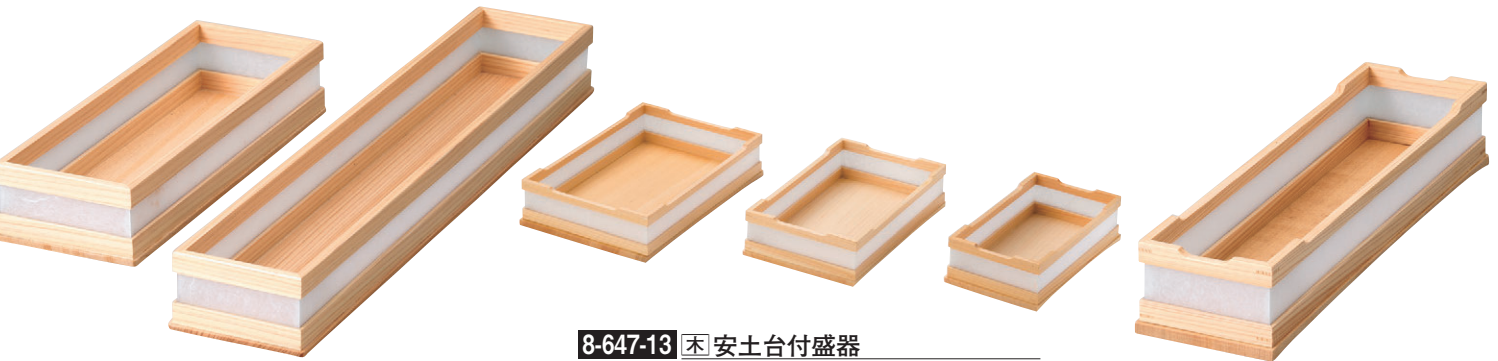
8-647-12 木製安土長角盛器 M-25-29 (小) ¥7,000 (26.5×9.7×5.3) 櫃50 M-25-30 (大) ¥9,200 (47×9×5.3) 櫃25 8-647-13 木製安土台付盛器 M-25-31 (小) ¥5,800 (21.5×12.2×6) 櫃40 M-25-32 (中) ¥6,600 (24.5×15×6) 櫃40 M-25-33 (大) ¥7,600 (27.5×18×6) 櫃30 8-647-14 M-25-34 木製安土台付長角盛器 ¥8,900 (33.5×9.3×6) 櫃30