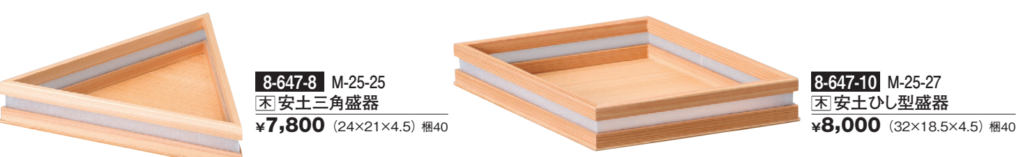
8-647-8 M-25-25 木製安土三角盛器 ¥7,800 (24×21×4.5) 櫃40 8-647-10 M-25-27 木製安土ひし型盛器 ¥8,000 (32×18.5×4.5) 櫃40