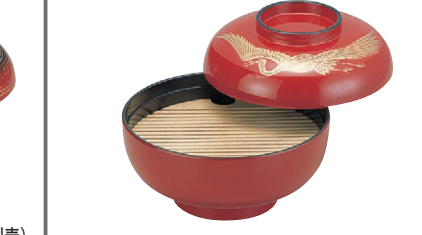
8-638-10 A)6.5寸盛込椀 鶴(目皿別売) 1-703-4 オヤ、フタ ¥3,300 (19.8φ×13) 椀40