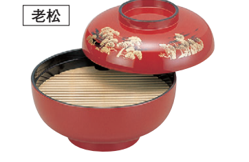
8-638-11 A)6.5寸盛込椀 老松(目皿別売) 1-703-5 オヤ、フタ ¥3,500 (19.8φ×13) 椀40