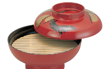
8-638-13 A)9寸盛込椀 老松手描繪(目皿別売) 1-703-7 オヤ、フタ ¥7,600 (26.5φ×16.8) 椀20