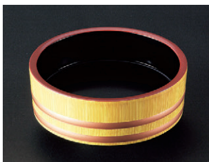
8-637-3 M-14-31 A)D.X7.5寸盛込桶 白木帯金内黒塗 ¥3,200 (22.8φ×7.9) 椀30