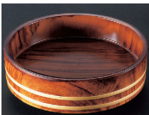
8-637-7 O-5-24 A)D.X尺0寸盛込桶 紫檀帯金 ¥6,200 (30φ×8.5) 椀20