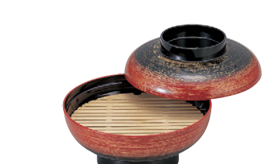
8-638-6 A)8寸盛込椀 レインボー(目皿別売) 1-702-2 ¥5,400 (24.3φ×15.6) 椀20