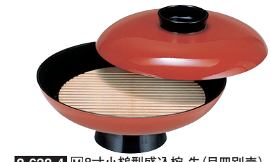
8-638-4 M)8寸小植型盛込椀 朱(目皿別売) W-2-58 ¥5,300 (23.9φ×12.3) 椀40