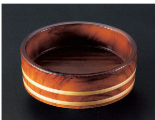
8-637-4 O-5-22 A)D.X7.5寸盛込桶 紫檀帯金 ¥3,950 (22.8φ×7.9) 椀30