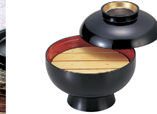
8-638-1 M)6寸高砂椀 黒つば金内朱(目皿別売) 1-211-9 オヤ、フタ ¥3,500 (18φ×15.3) 椀50