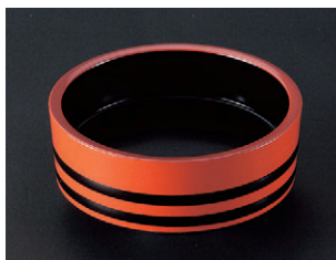
8-637-2 M-14-81 A)D.X7.5寸盛込桶 朱帯黒内黒塗 ¥3,000 (22.8φ×7.9) 椀30