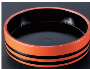
8-637-5 M-14-82 A)D.X尺0寸盛込桶 朱帯黒内黒塗 ¥4,550 (30φ×8.5) 椀20