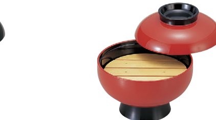
8-638-2 M)6寸高砂椀 朱つば内黒(目皿別売) 1-211-10 オヤ、フタ ¥3,500 (18φ×15.3) 椀50