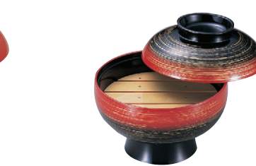
8-638-3 M)6寸高砂椀 レインボー(目皿別売) M-12-36 オヤ、フタ ¥3,850 (18φ×15.3) 椀50