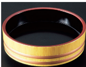
8-637-6 M-14-33 A)D.X尺0寸盛込桶 白木帯金内黒塗 ¥4,900 (30φ×8.5) 椀20