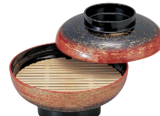
8-638-7 A)9寸盛込椀 レインボー(目皿別売) 1-702-3 ¥6,700 (26.5φ×16.8) 椀20