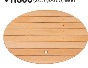
8-637-16 困33.7φ目皿 1-474-6 ¥6,000 (33.7φ×1.3) 椀20