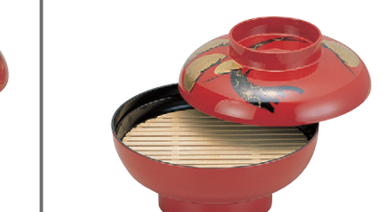
8-638-12 A)8寸盛込椀 老松手描繪(目皿別売) 1-703-6 オヤ、フタ ¥6,200 (24.3φ×15.6) 椀20