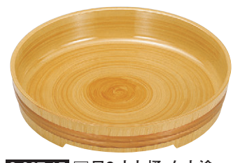
8-637-15 M)尺2寸丸桶 白木塗 M-2-43 ¥6,400 (36.5φ×7) 椀20