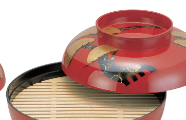
8-638-15 A)尺2寸盛込椀 老松手描繪(目皿別売) 1-703-9 オヤ、フタ ¥14,000 (37φ×24.5) 椀10