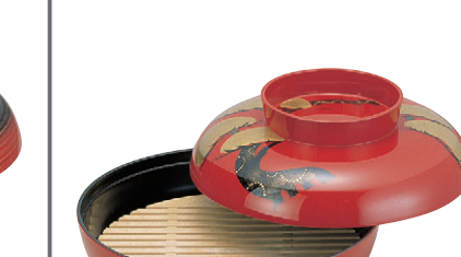
8-638-14 A)尺0寸盛込椀 老松手描繪(目皿別売) 1-703-8 オヤ、フタ ¥9,600 (30φ×20) 椀20