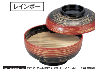
8-638-5 A)6.5寸盛込椀 レインボー(目皿別売) 1-702-1 ¥4,000 (19.8φ×13) 椀40