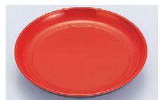
8-621-8 M-4-42 5寸椿皿 朱 ¥850 (15φ×2.8) 梱100