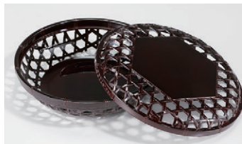
8-621-16 1-620-5 6寸かごめ溜 オヤ・フタ ¥1,300 (18φ×6) 梱100