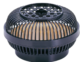
8-621-1 1-621-1 銀河かご 黒セット(中皿別売) ¥2,500 (16.7φ×9) 梱80