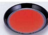
8-621-6 M-4-40 5寸多用皿 曙 ¥1,000 (14.8φ×1.8) 梱100