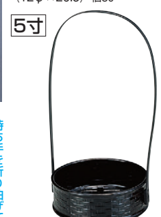
5寸 8-622-4 1-613-4 A(大)一閑張籠 黒(折畳式) ¥1,450 (15φ×30.5) 梱60