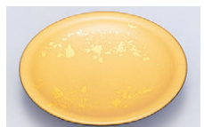
8-621-5 1-505-16 寿司皿 色紙金箔 ¥870 (15φ×2.1) 梱200