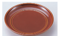
8-621-9 M-9-17 5寸椿皿 漆調春慶底黒塗 ¥1,400 (15φ×2.8) 梱100