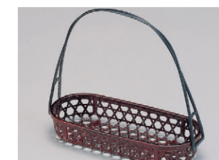
8-621-19 1-620-8A 8.5寸長手愛染籠溜(折畳式) ¥1,600 (25×10.9×22) 梱60