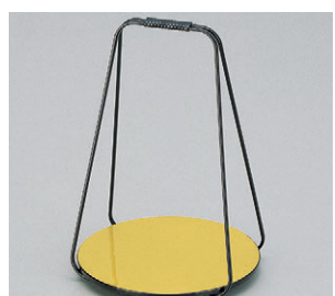
8-622-12 1-612-2 A(飛鳥丸手提盛器) 金底黒塗 ¥2,800 (17.5×16×22.5) 梱50