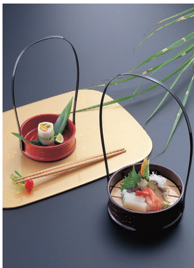
4寸 8-622-1 1-613-1 A(小)一閑張籠 黒(折畳式) ¥1,200 (12φ×26.5) 梱80