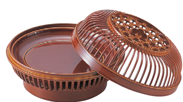
8-621-3 1-9-3 銀河かご 漆調春慶底黒塗(中皿別売) ¥2,900 (16.7φ×9) 梱80