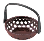
8-621-12 M-9-14 ミニかご 新溜(折畳式) ¥800 (13.5×12.1×11.6) 梱200