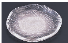
8-621-10 1-621-4 ガラス5寸ガラス丸皿 雪波 ¥3,950 (14.5φ×2) 梱60 限定品