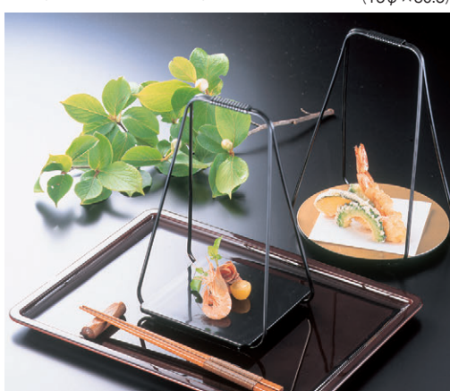
8-622-8 1-613-8 困(大)スノ子 ¥2,100 (13.5φ×1.8) 梱100