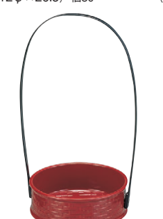
8-622-5 1-613-5 A(大)一閑張籠 朱(折畳式) ¥1,450 (15φ×30.5) 梱60