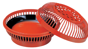
8-621-2 1-621-2 銀河かご 朱セット(中皿別売) ¥2,500 (16.7φ×9) 梱80