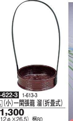
8-622-3 1-613-3 A(小)一閑張籠 溜(折畳式) ¥1,300 (12φ×26.5) 梱80