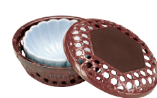
8-621-13 1-620-1 3.5寸かごめ溜 オヤ・フタ ¥780 (10.4φ×4.7) 梱200