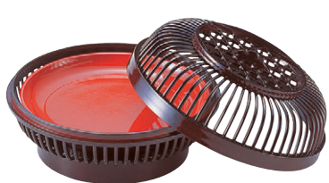
8-621-4 1-621-3 銀河かご 溜セット(中皿別売) ¥2,700 (16.7φ×9) 梱80