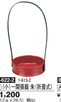
8-622-2 1-613-2 A(小)一閑張籠 朱(折畳式) ¥1,200 (12φ×26.5) 梱80