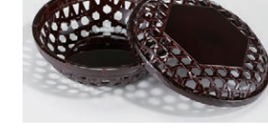
8-621-15 1-620-3 4.6寸かごめ溜 オヤ・フタ ¥900 (13.9φ×6) 梱150