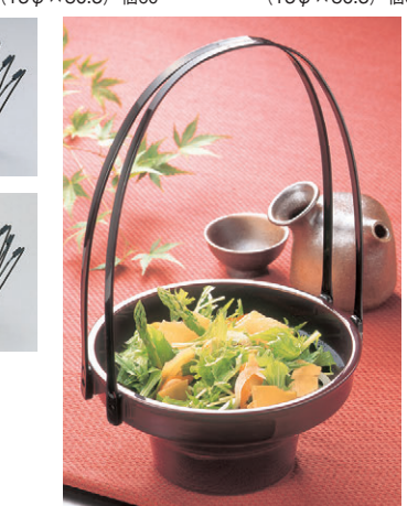
8-622-15 S-7-54 M(平羽反鉢) 5.5寸朱天黒 ¥1,400 (16.6φ×3.8) 梱80