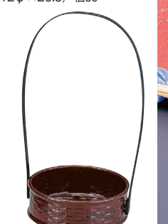
8-622-6 1-613-6 A(大)一閑張籠 溜(折畳式) ¥1,600 (15φ×30.5) 梱60