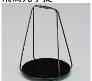
8-622-11 1-612-1 A(飛鳥丸手提盛器) 黒 ¥1,950 (17.5×16×22.5) 梱50