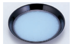
8-621-7 M-4-41 5寸多用皿 雲海 ¥1,000 (14.8φ×1.8) 梱100