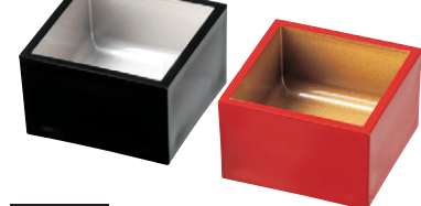
8-610-17 [A]ニュー1合マス M-16-28 黒内銀 ¥700 (7.8×7.8×4.9) 櫃200 M-16-29 朱内金 ¥700 (7.8×7.8×4.9) 櫃200