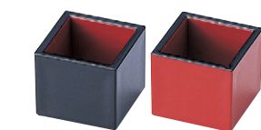
8-610-1 [A]プチマス (4.1×4.1×3.6) 櫃200 M-10-3 黒内朱 ¥435 M-10-4 朱天黒 ¥435