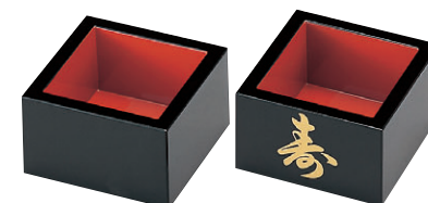
8-610-5 [A]D.X一合マス (8×8×5) 櫃200 1-458-5 黒内朱 ¥500 1-458-6 黒内朱寿 ¥580