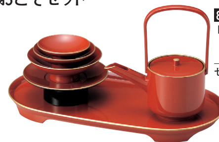
8-610-18 M-10-10 [A]小判おとそセット 朱天金(化粧箱入) ¥9,300 セット内容 [A]銚子 朱天金 [A]盃台 朱天金 [A]2.6寸盃 朱天金 [A]3寸盃 朱天金 [A]3.5寸盃 朱天金 [A]セット盆 朱天金 箱寸(36×20×20.5)