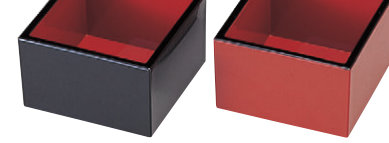
8-610-4 [A]新一合マス (7.8×7.8×4.9) 櫃200 1-458-3 黒内朱 ¥490 1-458-4 朱天黒 ¥490