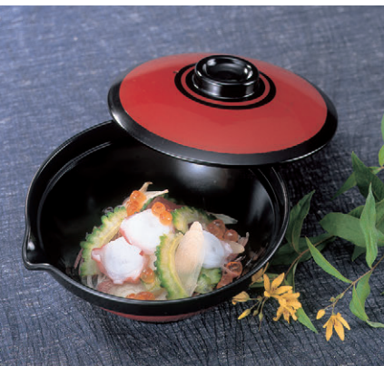
8-609-12 M-9-50 [A]大広椀珍味入 総銀刷毛目 ¥1,850 (9φ×4.5) 櫃100