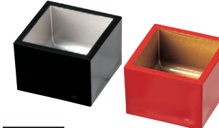
8-610-16 [A]ニュー5勺マス M-16-26 黒内銀 ¥620 (5.8×5.8×4.3) 櫃200 M-16-27 朱内金 ¥620 (5.8×5.8×4.3) 櫃200