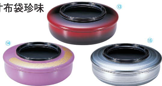
8-609-13 [M]4寸布袋珍味 黒朱ぼかし M-9-35 ¥2,000 (11.2φ×4.6) 櫃100 8-609-14 [M]4寸布袋珍味 バイオレット金一筆 M-9-36 ¥2,650 (11.2φ×4.6) 櫃100 8-609-15 [M]4寸布袋珍味 銀刷毛目内黒 M-9-37 ¥2,450 (11.2φ×4.6) 櫃100