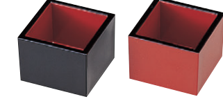
8-610-3 [A]5勺マス (5.9×5.9×4.2) 櫃200 1-458-1 黒内朱 ¥480 1-458-2 朱天黒 ¥480