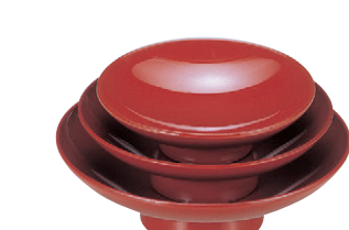
8-610-8 [A]2.6寸盃 朱塗 M-10-7 ¥300 (7.7φ×2.6) 櫃200 8-610-9 [A]3寸盃 朱塗 M-10-8 ¥315 (9φ×2.9) 櫃200 8-610-10 [A]3.5寸盃 朱塗 M-10-9 ¥350 (10.5φ×3.4) 櫃150