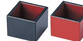
8-610-2 [A]ミニマス (5.2×5.2×4.5) 櫃200 M-10-5 黒内朱 ¥435 M-10-6 朱天黒(内塗無) ¥435