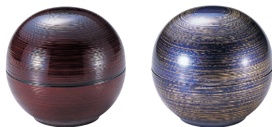
8-609-16 M-9-33 [M]みゆき盛器 溜刷毛目 ¥4,900 (12.5φ×10.5) 櫃50 8-609-17 M-9-34 [M]みゆき盛器 紫金かすり ¥5,000 (12.5φ×10.5) 櫃80