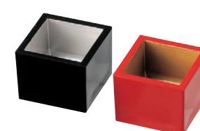
8-610-15 [A]ニューミニマス M-16-24 黒内銀 ¥540 (5.1×5.1×4.2) 櫃200 M-16-25 朱内金 ¥540 (5.1×5.1×4.2) 櫃200

内側の隅が丸いので、汚れが付きにくく洗浄しやすくなっております。また、上げ底なので盛り付けやすく、食べやすくなっております。