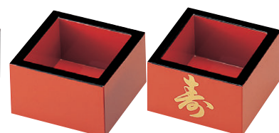
8-610-6 [A]D.X一合マス (8×8×5) 櫃200 1-458-7 朱天黒 ¥500 1-458-8 朱天黒寿 ¥580