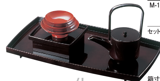
8-610-20 M-10-13 [A][M]胴張おとそセット 溜(化粧箱入) ¥16,700 セット内容 [A]銚子 溜 [M]盃台 溜 [M]2.6寸盃 朱 [M]3寸盃 朱 [M]3.6寸盃 朱 [M]セット盆 溜 箱寸(43×25×20)