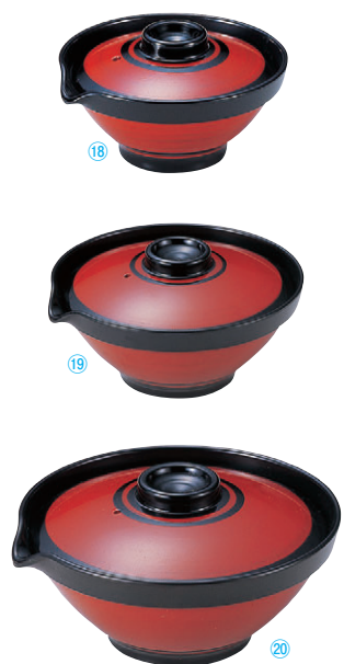
8-609-18 [A] (小)片口タレ入れ 朱駒内黒 M-9-38 ¥1,350 (8.7φ×5.1) 櫃150 8-609-19 [A] (中)片口タレ入れ 朱駒内黒 M-9-39 ¥1,550 (11.4φ×6.3) 櫃120 8-609-20 [A] (大)片口タレ入れ 朱駒内黒 M-9-40 ¥1,700 (13.4φ×7.2) 櫃100