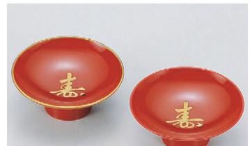
8-610-7 [A]3寸盃 (9.1φ×3.6) 櫃300 1-458-15 朱寿 ¥330 1-458-16 朱寿天金 ¥340