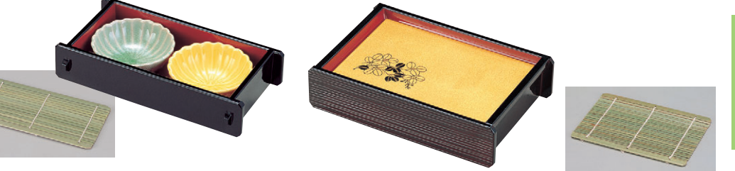
8-608-1 A井戸淵セイロ 溜内朱(オプション別) 1-539-7 ¥1,600 (12×12×5) 櫃100 1-535-9B 陶竹ス ¥400 (9×9) 1-338-22 陶3寸菊型千代久 青磁 ¥1,000 (9φ×3.2) 櫃100 1-338-20 陶3寸菊型千代久 黄 ¥1,000 (9φ×3.2) 櫃100 1-535-11A 陶竹ス ¥500 (18.5×9.2) 8-608-4 A長手ツノセイロ底板付 黒内朱(オプション別) 1-535-11 ¥1,750 (22.5×11.8×4.8) 櫃60 1-338-21 陶3寸菊型千代久 ヒワ ¥1,000 (9φ×3.2) 櫃100 8-608-5 A長手千筋セイロ底板付 溜内朱(オプション別) 1-534-10 ¥1,800 (21.8×14.2×5.7) 櫃60 1-665-5A A長角皿 金雅萩 ¥2,550 (18×12×0.3) 櫃200 1-533-1A 陶竹ス ¥380 (18×12)