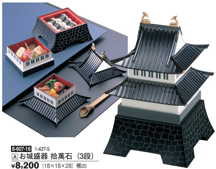
8-607-16 1-427-5 Aお城盛器 拾萬石 (3段) ¥8,200 (18×18×28) 櫃20