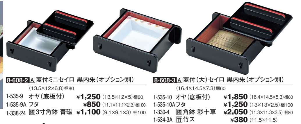
8-608-2 A蓋付ミニセイロ 黒内朱(オプション別) (13.5×12×6.8) 櫃80 1-535-9 オヤ(底板付) ¥1,250 (13.5×12×5) 櫃80 1-535-9A フタ ¥850 (11.1×11.1×2.3) 櫃100 1-338-24 陶3寸角鉢 青磁 ¥1,100 (9.1×9.1×3) 櫃100 8-608-3 A蓋付(大)セイロ 黒内朱(オプション別) (16.4×14.5×7.3) 櫃60 1-535-10 オヤ(底板付) ¥1,850 (16.4×14.5×5.3) 櫃60 1-535-10A フタ ¥1,250 (13×13×2.5) 櫃100 1-330-4 陶角鉢 彩十草 ¥2,050 (11.3×11.3×3.5) 櫃80 1-534-3A 陶竹ス ¥380 (11.5×11.5)