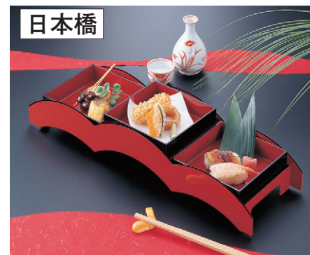
8-607-18 1-662-15 A4.5寸角鉢 黒内朱 ¥750 (13.5×13.5×3.9) 櫃200 8-607-17 M-8-50 A日本橋 朱天黒 ¥4,000 (48.7×14.7×9.8) 櫃10