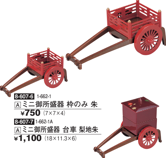
8-607-6 1-662-1 Aミニ御所盛器 枠のみ 朱 ¥750 (7×7×4) 8-607-7 1-662-1A Aミニ御所盛器 台車 梨地朱 ¥1,100 (18×11.3×6)