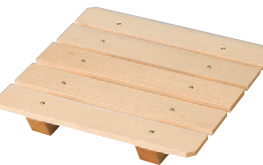
8-583-7 M-23-60 困6寸角鉢用木製目皿 (クリアー付) ¥2,500 (13×13×2) 幅100