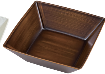
8-583-3 M-23-56 A 6寸加賀角鉢 枳刷毛目 ¥3,200 (18.1×18.1×6) 幅60