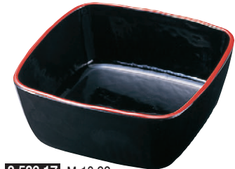
8-583-17 M-10-92 M 6寸吉野角鉢 黒天朱 ¥4,100 (18.1×18.1×7.2) 幅60