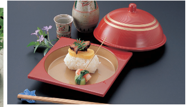
8-584-3 A 蓋向盛器 朱金ライン内金 1-643-5A 蓋 ¥1,300 (16.3φ×8) 幅80 1-643-5 本体 ¥1,350 (16.8×16.8×2.6) 幅80