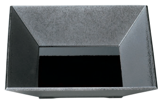
8-583-19 M-18-43 PET耐熱四方深型鉢 銀石目 内黒 ¥3,450 (20.5×20.5×5.2) 幅60