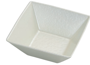
8-583-5 M-23-58 A 4寸加賀角鉢 クリームアクア ¥1,950 (12.7×12.7×5) 幅80