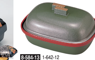
8-584-13 1-642-12 M 小判型盛器 クリーンパール天金 (目皿別) ¥4,300 (19×13.8×10) 幅40