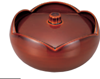
8-584-14 M-16-76 M 福梅鉢 総漆調春慶底黒塗 ¥3,500 (10.9φ×6.4) 幅80