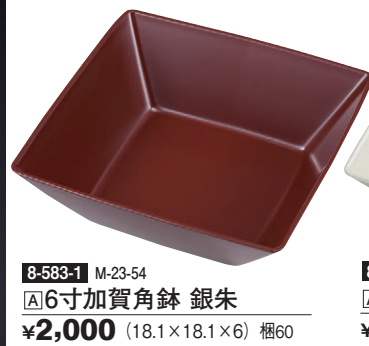
8-583-1 M-23-54 A 6寸加賀角鉢 銀朱 ¥2,000 (18.1×18.1×6) 幅60