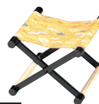
8-584-16 M-17-9 A 囲床机盛台 松竹梅 ¥3,300 (11.5×14×10.3) 幅50