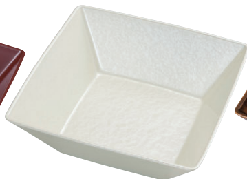
8-583-2 M-23-55 A 6寸加賀角鉢 クリームアクア ¥3,000 (18.1×18.1×6) 幅60