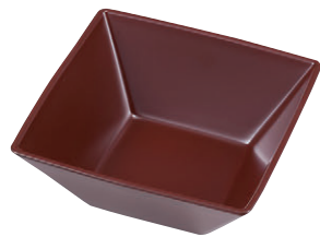
8-583-4 M-23-57 A 4寸加賀角鉢 銀朱 ¥1,300 (12.7×12.7×5) 幅80