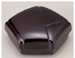
8-584-7 1-643-1 M 結び珍味入れ 溜内朱天黒 ¥2,650 (15×13×7) 幅50