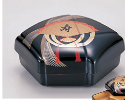
8-584-9 1-643-3 M 結び珍味入れ 扇面に結び黒内金 ¥3,950 (15×13×7) 幅50