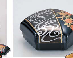
8-584-10 1-643-4 M 結び珍味入れ 流水に桜黒内金 ¥3,950 (15×13×7) 幅50