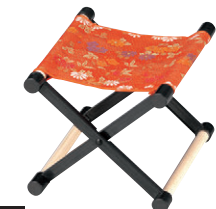
8-584-15 M-17-8 A 囲床机盛台 春秋 ¥3,300 (17.5×14×10.3) 幅50