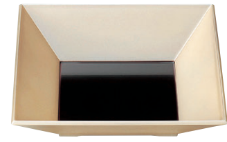
8-583-20 M-18-44 PET耐熱四方深型鉢 銀透き内溜 ¥3,500 (20.5×20.5×5.2) 幅60