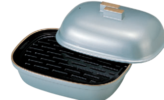
8-584-11 1-642-10 M 小判型盛器 銀パール天金 (目皿別) ¥4,000 (19×13.8×10) 幅40 8-584-12 1-642-11 A 小判型盛器用 目皿黒 ¥700 (18×13×0.5)