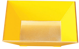
8-583-21 M-18-45 PET耐熱四方深型鉢 黄内銀雅 ¥4,500 (20.5×20.5×5.2) 幅60