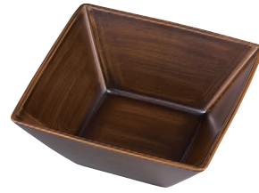
8-583-6 M-23-59 A 4寸加賀角鉢 枳刷毛目 ¥2,000 (12.7×12.7×5) 幅80