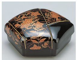
8-584-8 1-643-2 M 結び珍味入れ 桔梗内黒天朱 ¥3,550 (15×13×7) 幅50