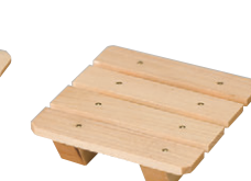
8-583-8 M-23-61 困4寸角鉢用木製目皿 (クリアー付) ¥2,100 (8×8×2) 幅100