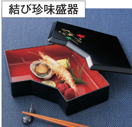
8-584-1 A 結び珍味盛器 黒内朱春秋 M-7-19 身 ¥1,350 (28.5×19.5×5.2) 幅60 M-7-20 蓋 ¥1,400 (28.5×19.5×1.3) 幅100