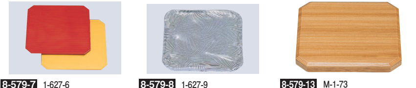
8-579-7 1-627-6 A隅切盛器用中皿 朱千筋/金 ¥1,300 (17×17×0.3) 梱200 8-579-8 1-627-9 ガラス隅切盛器用ガラス中皿 雪波 限定品 ¥5,400 (16.5×16.5×1.2) 梱30 8-579-13 M-1-73 困隅切かぶせ蓋(隅切盛器用・大徳重盛器用) ¥4,750 (17.6×17.6×1.6) 梱100