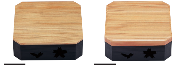
8-579-5 M-1-28 困隅切透かし盛器用のせ蓋(本体別売) ¥3,650 (18.2×18.2×0.7) 梱80 8-579-6 M-1-29 困隅切透かし盛器用インロー蓋(本体別売) ¥4,900 (18.3×18.3×2) 梱80