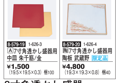
8-579-19 1-626-3 A7寸角透かし盛器用中皿 朱千筋/金 ¥1,500 (19.5×19.5×0.3) 梱100 8-579-20 1-626-4 困7寸角透かし盛器用陶板 武蔵野 限定品 ¥4,800 (19.3×19.3×0.8) 梱40