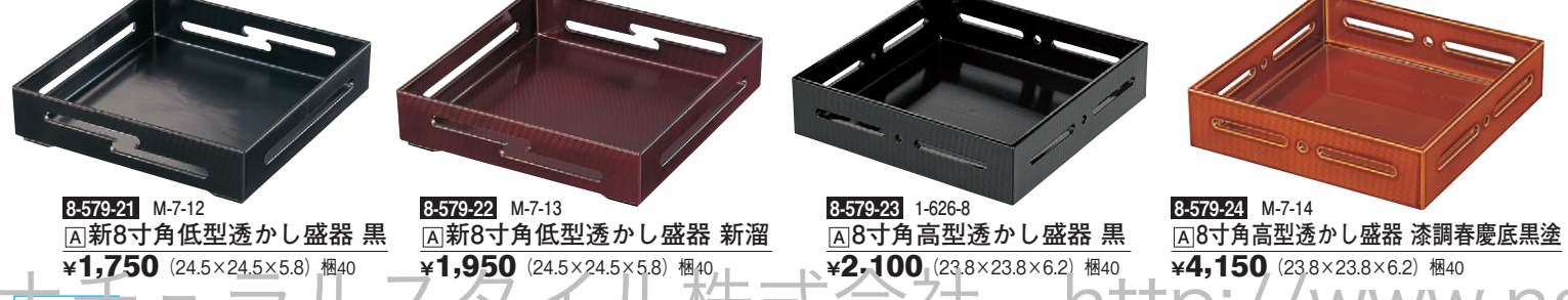
8-579-21 M-7-12 A新8寸角低型透かし盛器 黒 ¥1,750 (24.5×24.5×5.8) 梱40 8-579-22 M-7-13 A新8寸角低型透かし盛器 新溜 ¥1,950 (24.5×24.5×5.8) 梱40 8-579-23 1-626-8 A8寸角高型透かし盛器 黒 ¥2,100 (23.8×23.8×6.2) 梱40 8-579-24 M-7-14 A8寸角高型透かし盛器 漆調春慶底黒塗 ¥4,150 (23.8×23.8×6.2) 梱40