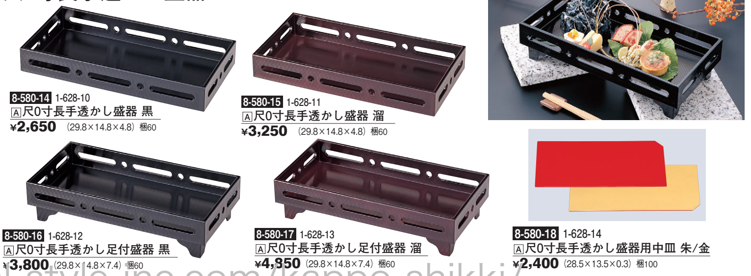
8-580-1 1-628-1 A7.5寸長手透かし盛器 黒 ¥2,250 (22.4×15×4.5) 梱60 8-580-2 1-628-2 A7.5寸長手透かし盛器 溜 ¥2,750 (22.4×15×4.5) 梱60 8-580-3 1-9-10 A7.5寸長手透かし盛器 漆調春慶底黒塗 ¥3,650 (22.4×15×4.5) 梱60 8-580-4 1-628-5 A7.5寸長手透かし盛器用中皿 朱/金 ¥1,850 (21×13.5×0.3) 梱150 8-580-5 1-628-6 A7.5寸長手透かし盛器用中皿 シルバー ¥1,950 (21×13.5×0.3) 梱150 8-580-6 1-628-7 困7.5寸長手透かし盛器用陶板 吹墨 ¥2,250 限定品 (21×13.5×0.7) 梱40 8-580-7 1-628-8 困7.5寸長手透かし盛器用陶板 春秋 ¥3,450 限定品 (21×13.5×0.7) 梱40 8-580-8 1-628-9 困7.5寸長手透かし盛器用ガラス中皿 雪波 限定品 ¥4,450 限定品 (21.5×13.3×1.2) 梱30 8-580-9 1-628-3 A7.5寸長手足付透かし盛器 黒 ¥2,650 (22.4×15×7.4) 梱60 8-580-10 1-628-4 A7.5寸長手足付透かし盛器 溜 ¥3,300 (22.4×15×7.4) 梱60 8-580-11 1-629-1 A朝日盛器 黒 ¥2,450 (26×12.5×5.5) 梱60 8-580-12 1-629-2 A朝日盛器 溜 ¥2,850 (26×12.5×5.5) 梱60 8-580-13 1-629-3 困朝日盛器用陶板 グリーン波千鳥 ¥2,450 (24.9×11×0.9) 梱40 8-580-14 1-628-10 A尺0寸長手透かし盛器 黒 ¥2,650 (29.8×14.8×4.8) 梱60 8-580-15 1-628-11 A尺0寸長手透かし盛器 溜 ¥3,250 (29.8×14.8×4.8) 梱60 8-580-16 1-628-12 A尺0寸長手足付透かし足付盛器 黒 ¥3,800 (29.8×14.8×7.4) 梱60 8-580-17 1-628-13 A尺0寸長手足付透かし足付盛器 溜 ¥4,350 (29.8×14.8×7.4) 梱60 8-580-18 1-628-14 A尺0寸長手透かし盛器用中皿 朱/金 ¥2,400 (28.5×13.5×0.3) 梱100