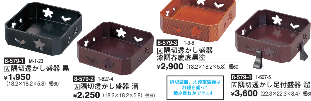
8-579-1 M-1-23 A隅切透かし盛器 黒 ¥1,950 (18.2×18.2×5.8) 梱60 8-579-2 1-627-4 A隅切透かし盛器 溜 ¥2,250 (18.2×18.2×5.8) 梱60 8-579-3 1-9-8 A隅切透かし盛器 漆調春慶底黒塗 ¥2,900 (18.2×18.2×5.8) 梱60 8-579-4 1-627-5 A隅切透かし足付盛器 溜 ¥3,600 (22.3×22.3×8.4) 梱60 隅切盛器、大徳重盛器は料理を盛って積み重ねができます。