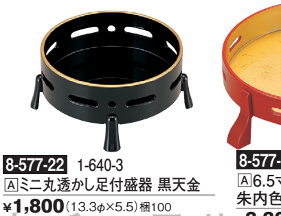
ミニ丸透かし足付盛器