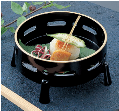
ミニ丸透かし盛器