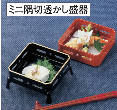
ミニ隅切透かし盛器