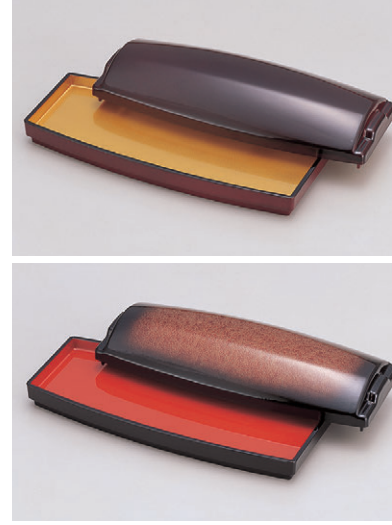
8-568-1 宝生盛器 溜内金雅 セット ¥3,800 (26.6×11×6.3) 幅40 1-643-7 溜内金雅 身 ¥2,200 (26.6×11×2.5) 幅80 1-643-7A 溜内金雅 蓋 ¥1,600 (26.6×11×4.8) 幅80 8-568-2 宝生盛器 アクアブラウン内朱 セット ¥4,200 (26.6×11×6.3) 幅40 1-643-8 黒内朱 身 ¥1,900 (26.6×11×2.5) 幅80 1-643-8A アクアブラウン内朱 蓋 ¥2,300 (26.6×11×4.8) 幅80