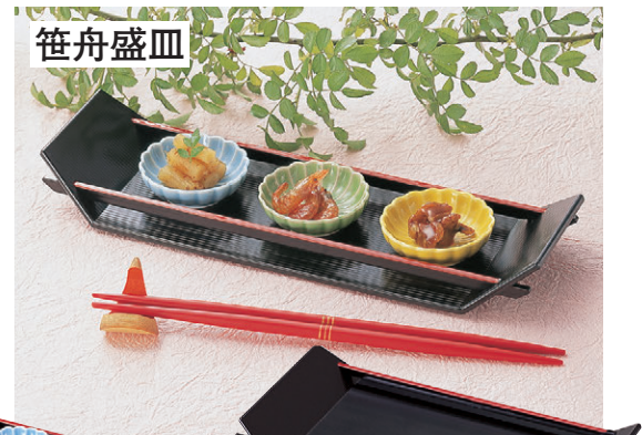
8-567-8 1-655-10 尺(小)笹舟盛皿 黒天朱 本体 ¥1,350 (27.2×9.2×3.5) 幅100 8-567-9 1-655-11 尺(大)笹舟盛皿 黒天朱 本体 ¥1,900 (27.2×14.5×3.3) 幅60 8-567-10 陶菊豆皿 (5.8φ×1.8) 幅200 1-655-10A ①トルコ ¥630 1-655-10B ②ヒワグリーン ¥630 1-655-10C ③黄 ¥630