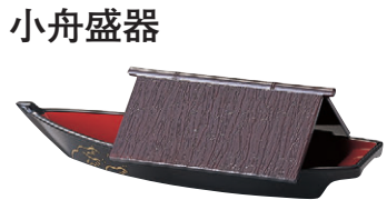
8-567-11 小舟 波内朱 1-334-15 ¥1,800 (24.3×8.3×3.5) 幅100 8-567-12 屋根 マルーン 1-664-4 ¥900 (10×13.8×4.7) 幅100