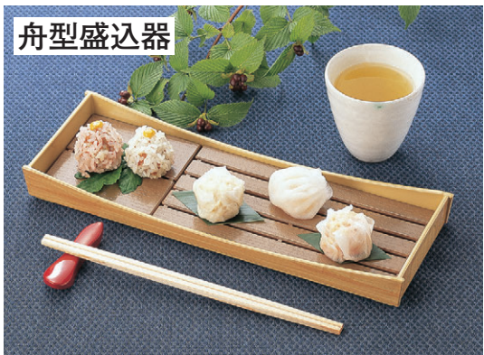
8-567-7 M-7-64 尺0寸舟型盛込器用目皿 ¥600 (20.2×9.8×0.8) (9.8×9.8×0.8)