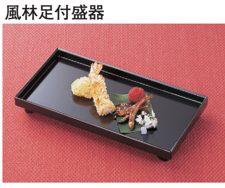
8-568-5 M-7-40 風林足付盛器 黒(全面塗) ¥2,600 (26×13.5×3.5) 幅80 8-568-6 M-7-41 風林足付盛器 新溜(全面塗) ¥2,700 (26×13.5×3.5) 幅80