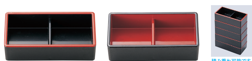
8-559-1 ㊦(小)二点珍味入れ 黒天朱 M-2-17 ¥750 (13×6.8×3.6) 梱100 8-559-2 ㊦(小)二点珍味入れ 黒内朱 M-2-16 ¥850 (13×6.8×3.6) 梱100