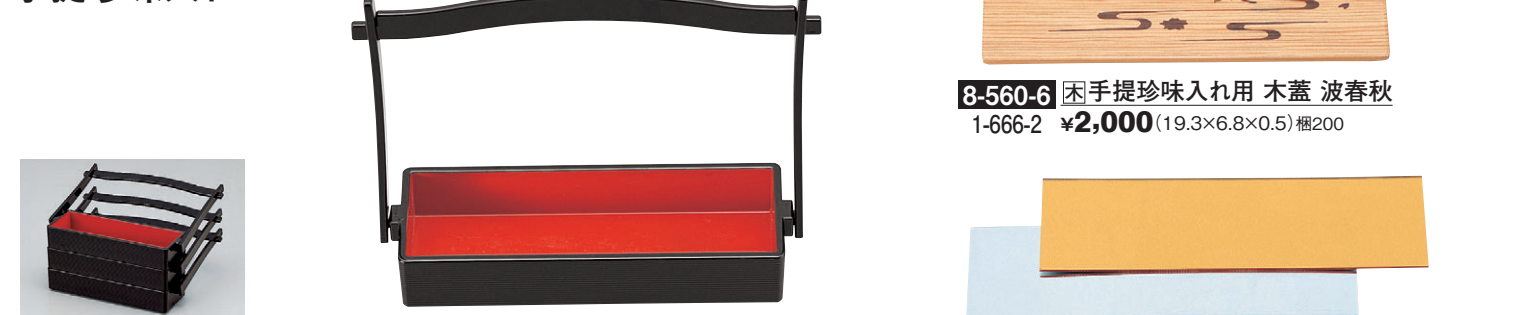
8-560-5 ㊦手提珍味入れ 黒内朱 本体 1-667-1 ¥2,050 (22.2×6.8×17.1) 梱80 8-560-6 ㊦手提珍味入れ用 木蓋 波春秋 1-666-2 ¥2,000 (19.3×6.8×0.5) 梱200