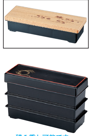
積み重ね可能です。