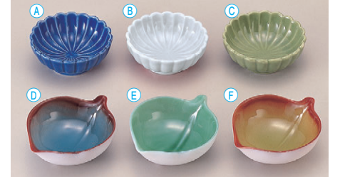
8-560-4 ㊦1-337-15 ㊦2.6寸菊型千代久 瑠璃 ¥1,000 (7.8φ×3.3) ㊦1-337-14 ㊦2.6寸菊型千代久 青磁 ¥1,000 (7.8φ×3.3) ㊦1-337-13 ㊦2.6寸菊型千代久 グリーン ¥850 (7.8φ×3.3) 限定品 ㊦1-338-7 ㊦この葉鉢 青磁 ¥1,050 (10×8.1×3.5) ㊦1-338-6 ㊦この葉鉢 グリーン ¥750 (10×8.1×3.5) ㊦1-338-8 ㊦この葉鉢 織部 ¥1,050 (10×8.1×3.5)