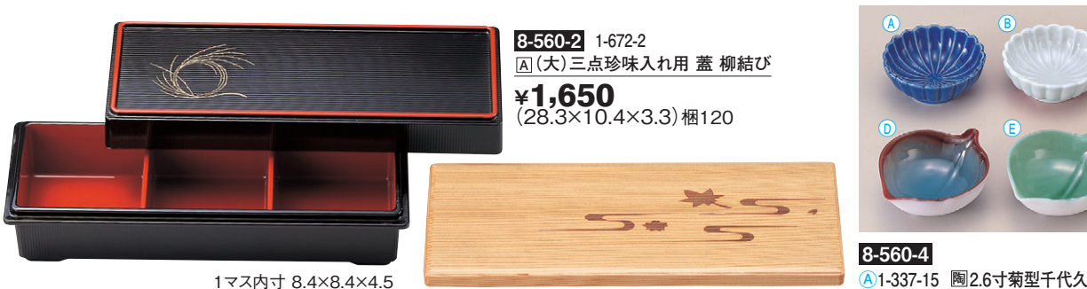
8-560-2 1-672-2 ㊦(大)三点珍味入れ用 蓋 柳結び ¥1,650 (28.3×10.4×3.3) 梱120 8-560-1 1-672-1 ㊦(大)三点珍味入れ 黒内朱 (固定仕切) ¥1,700 (28.3×10.4×5.4) 梱60 8-560-3 1-672-3 ㊦(大)三点珍味入れ用 木蓋 波春秋 ¥4,000 (28.3×10.5×1.3) 梱120