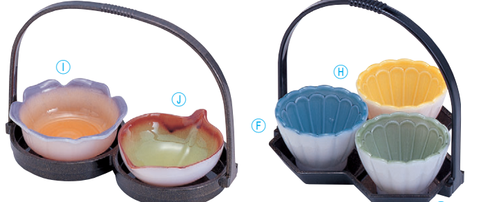
8-560-10 M-2-22 ㊦めがね手提盛器 梨地 ¥1,050 (18.7×9.1×14.1) 梱100 ㊦1-338-11 ㊦花鉢 オレンジ紫 ¥950 (9.1×9.1×3.7) 梱200 ㊦1-338-8 ㊦この葉鉢 織部 ¥1,050 (10×8.1×3.5) 梱200 8-560-11 M-2-21 ㊦六角珍味手揚げ盛器 梨地 ¥550 (10.8×10.5×11.2) 梱100 ㊦1-339-29 ㊦菊千代久 青磁 ¥730 (5.2φ×3.6) 梱200 ㊦1-339-30 ㊦菊千代久 グリーン ¥730 (5.2φ×3.6) 梱200 ㊦M-2-21C ㊦菊千代久 黄 ¥730 (5.2φ×3.6) 梱200