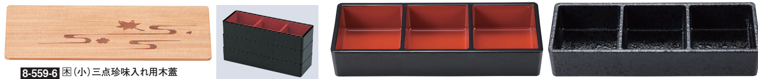
8-559-6 ㊦(小)三点珍味入れ用木蓋 1-666-2 波春秋 ¥2,000 (19.3×6.8×0.5) 梱200 8-559-7 ㊦天切三点珍味箱 黒内朱天黒 M-23-45 ¥1,000 (19.3×6.8×3.7) 8-559-8 ㊦天切三点珍味箱 新黒石目 M-23-46 ¥1,000 (19.3×6.8×3.7)