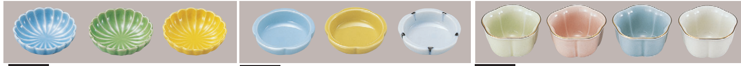
8-559-9 ㊦1-655-10A ㊦1-655-10B ㊦1-655-10C ㊦1-655-10D ㊦1-666-1E ㊦1-666-1F ㊦M-6-55 ㊦M-6-56 ㊦M-6-57 ㊦M-6-58 ㊦菊豆皿 トルコ ¥630 (5.8φ×1.8) 梱200 ㊦菊豆皿 ヒワグリーン ¥630 (5.8φ×1.8) 梱200 ㊦菊豆皿 黄 ¥630 (5.8φ×1.8) 梱200 ㊦菊豆皿 トルコ ¥680 (5.8φ×1.8) 梱200 ㊦菊豆皿 黄 ¥680 (5.8φ×1.8) 梱200 ㊦菊豆皿 古染立筋 ¥680 (5.8φ×1.8) 梱200 ㊦天切梅型珍味 ¥750 (5.2φ×2.8) 梱200 ㊦天切梅型珍味 ¥750 (5.2φ×2.8) 梱200 ㊦天切梅型珍味 ¥750 (5.2φ×2.8) 梱200 ㊦天切梅型珍味 ¥750 (5.2φ×2.8) 梱200