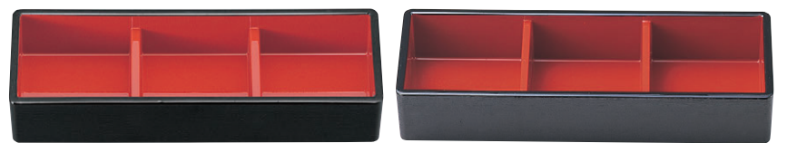
8-559-4 ㊦(小)三点珍味入れ 黒内朱 1-666-1 (固定仕切) ¥1,000 (19.3×6.8×3.7) 梱100 8-559-5 ㊦(小)新三点珍味入れ 黒内朱 M-6-59 (固定仕切) ¥950 (19.3×6.8×3.7) 梱100